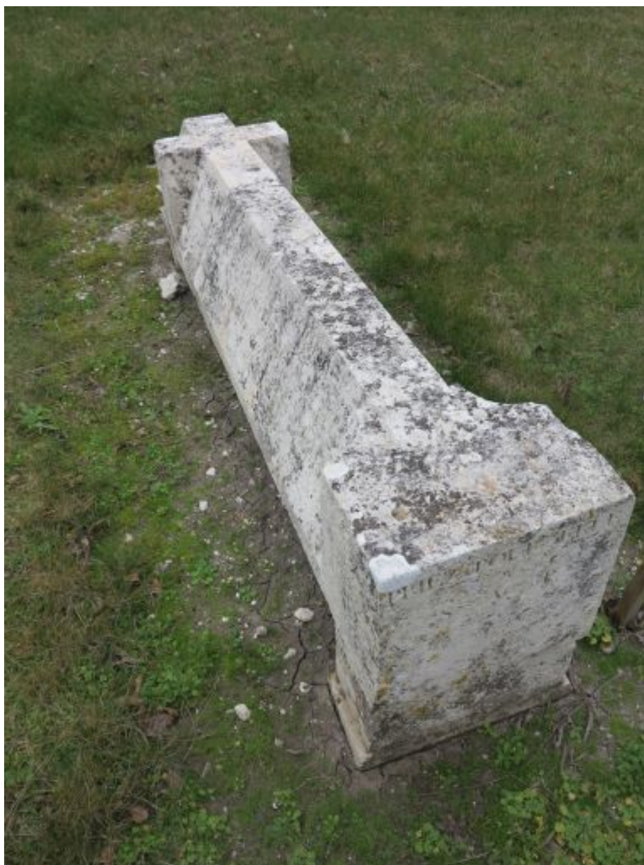
La pierre tombale d'Eugénie Charron.