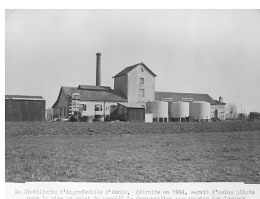
Vue de l'ensemble, avant la destruction en 1944. IVR54_19911700409X