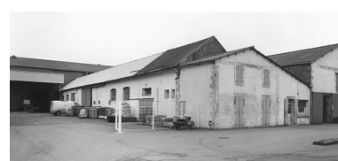
Vue de l'ancienne distillerie prise du sud est.