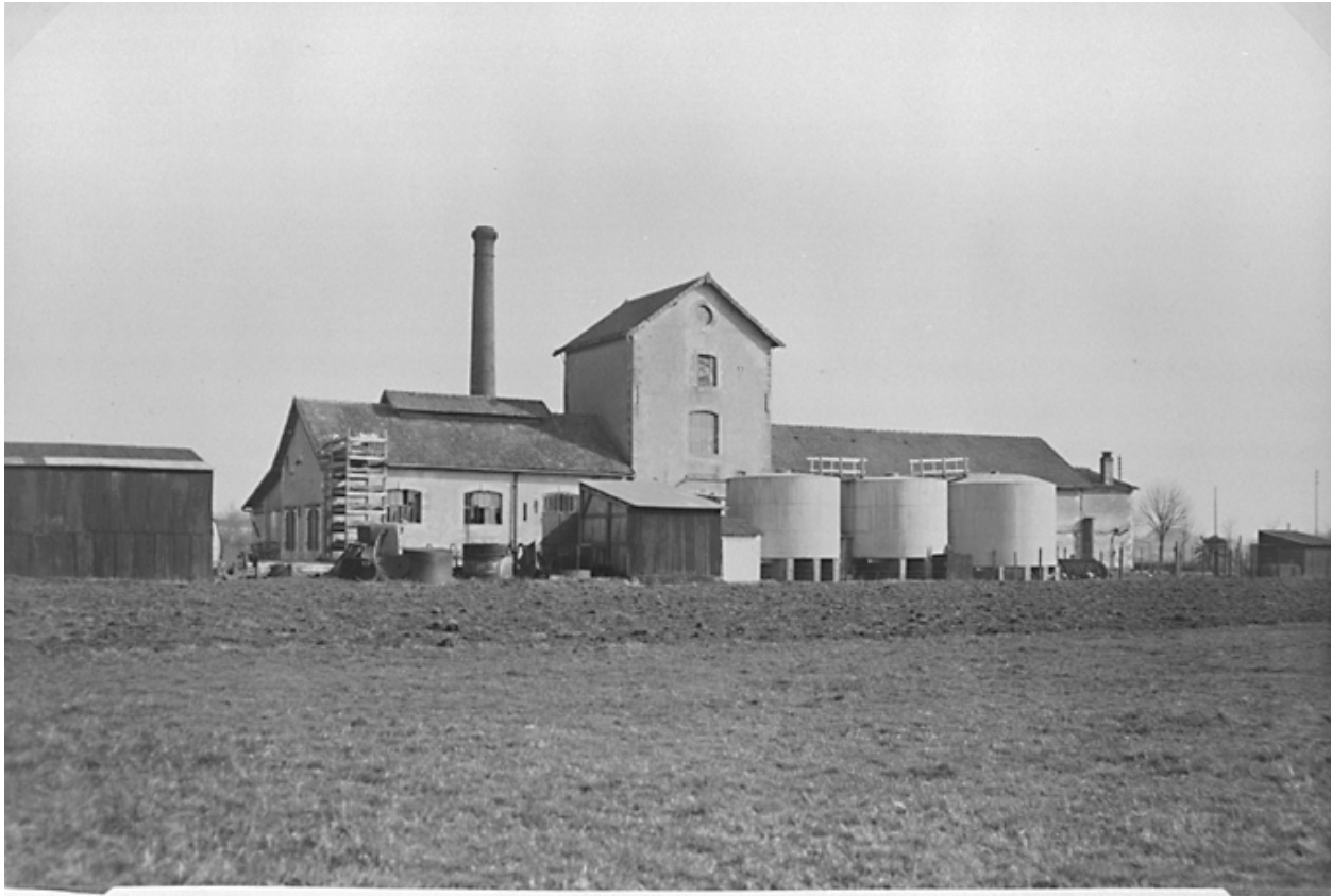
La Distillerie d'Aigrefeuille d'Aunis, détruite en 1944, servit d'usine pilote pour la mise au point du procédé de fermentation par reprise des levures

Vue de l'ensemble, avant la destruction en 1944.