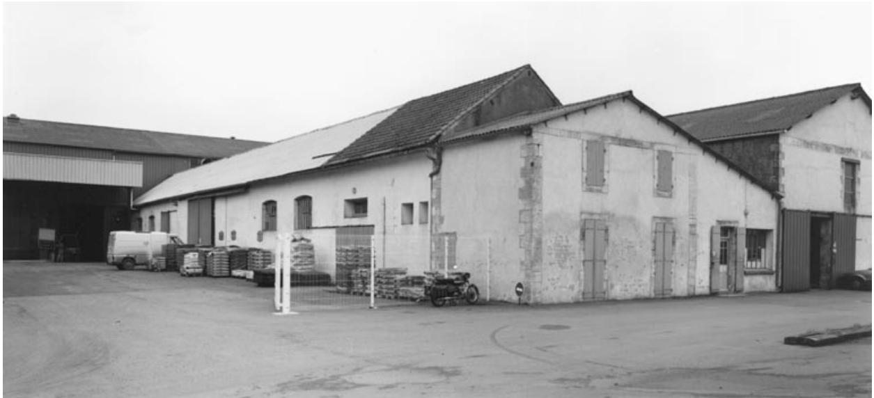
Vue de l'ancienne distillerie prise du sud est.