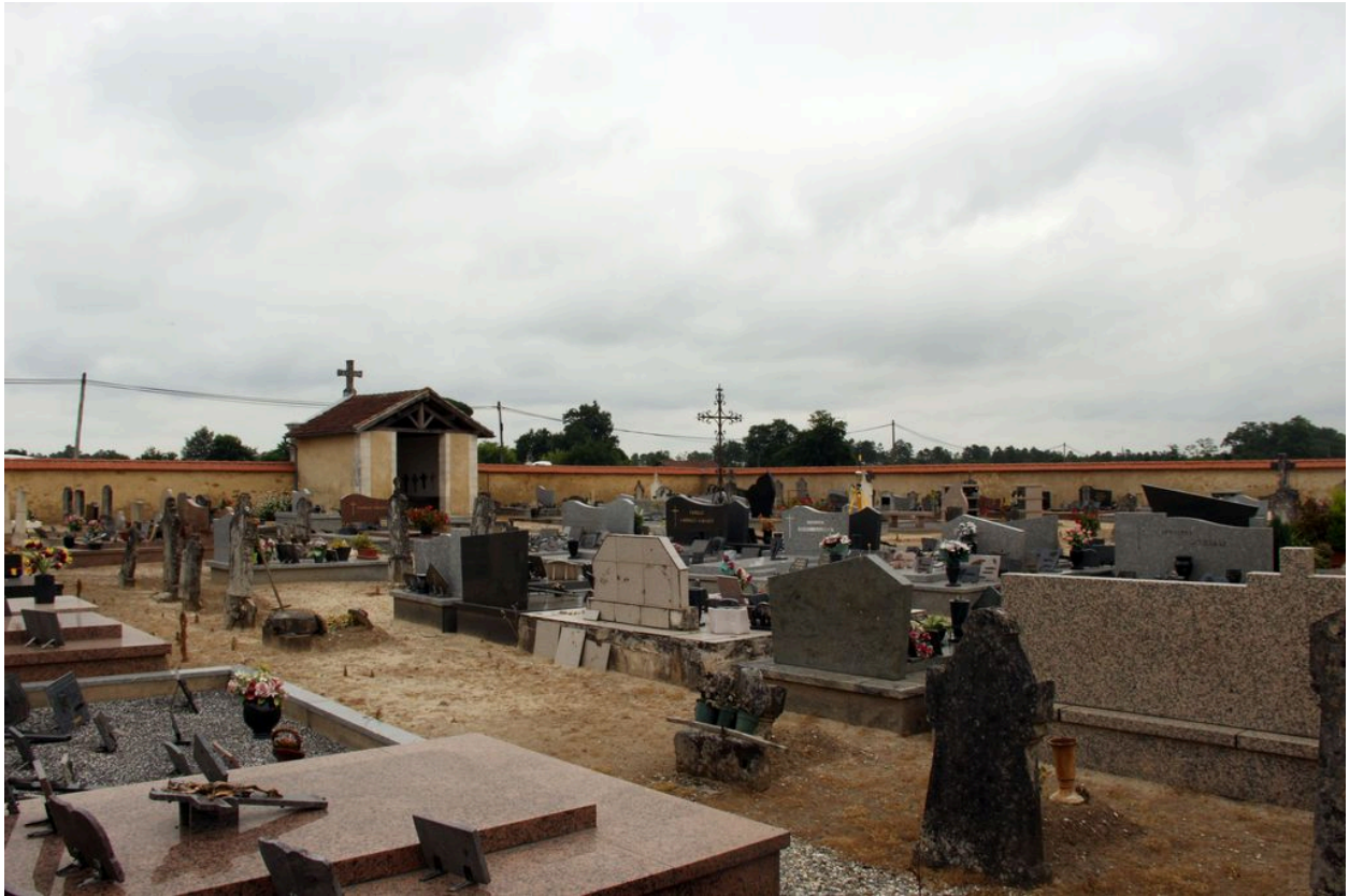
Vue d'ensemble depuis l'angle sud-ouest.