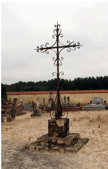
Croix de cimetière. IVR72_20184001270NUC2A