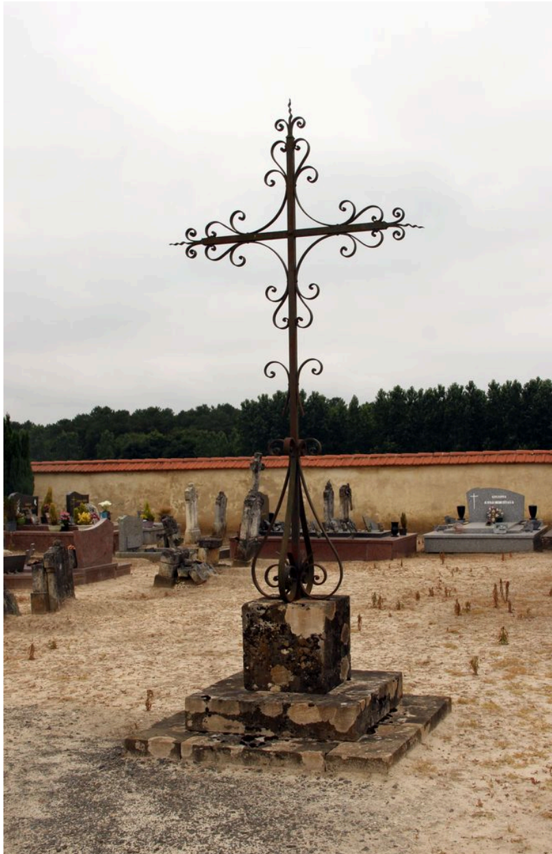
Croix de cimetière.