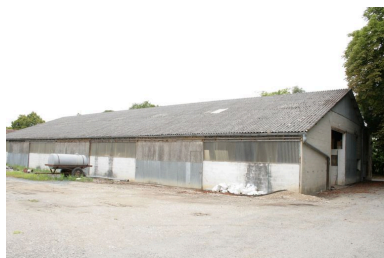
Un hangar agricole, depuis le nord-est.