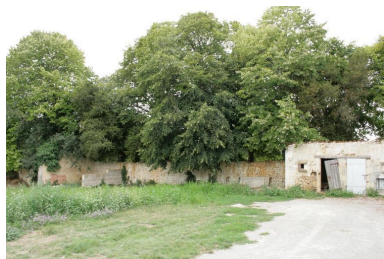
Des dépendances et un toit à bêtes, depuis le nord-ouest. IVR54_20091701598NUCA