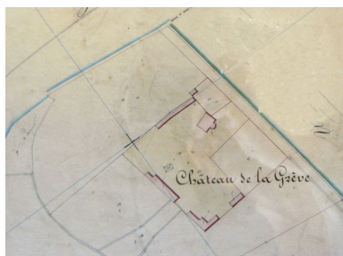
Le château de La Grève, extrait du plan cadastral napoléonien, 1838.