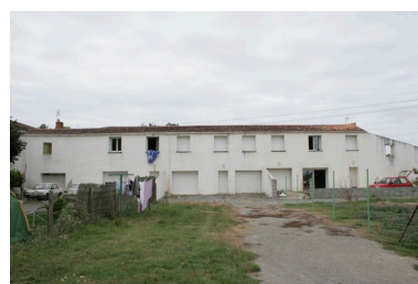
D'anciennes dépendances réhabilitées en logements, depuis le sud-ouest.