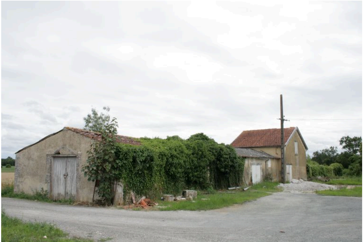
Une série de dépendances, depuis le nord-ouest.