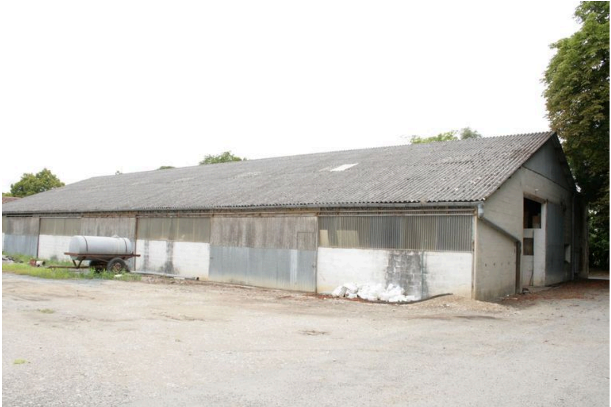
Un hangar agricole, depuis le nord-est.