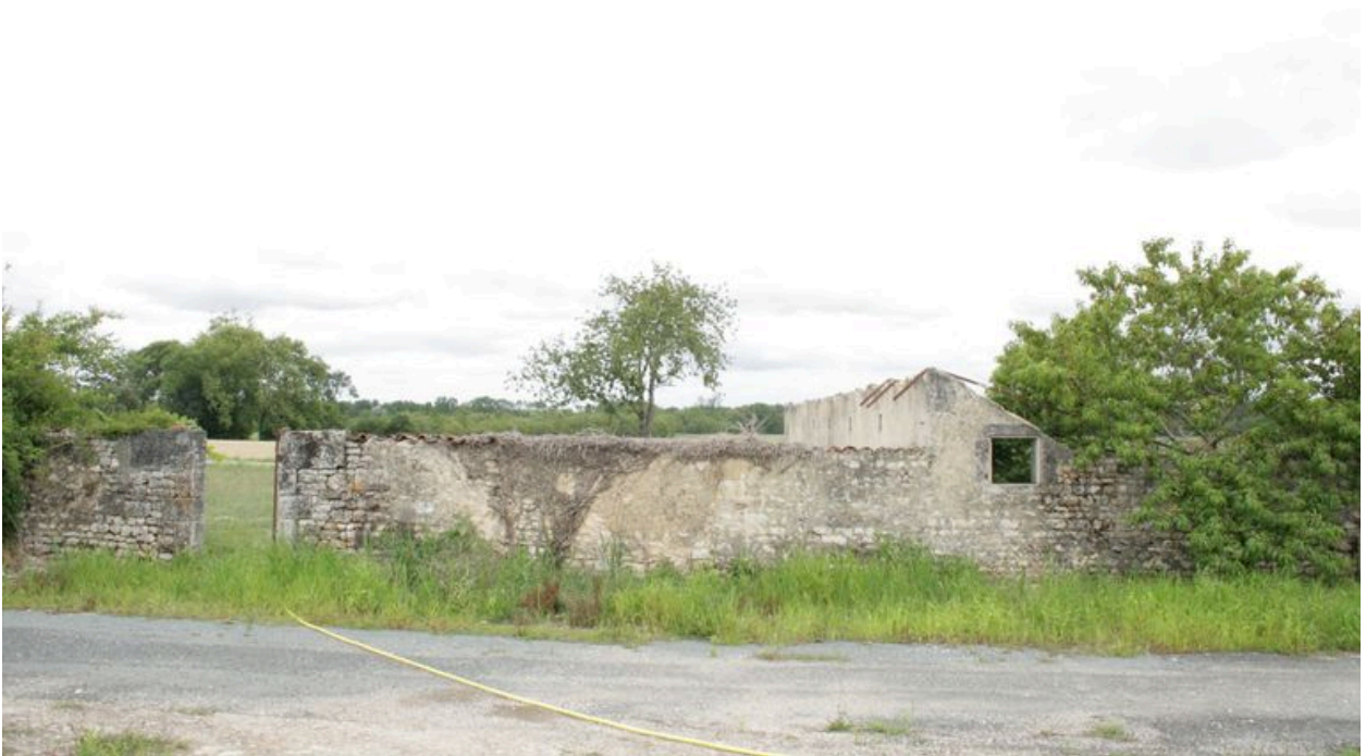
D'anciennes dépendances, depuis le nord-ouest.