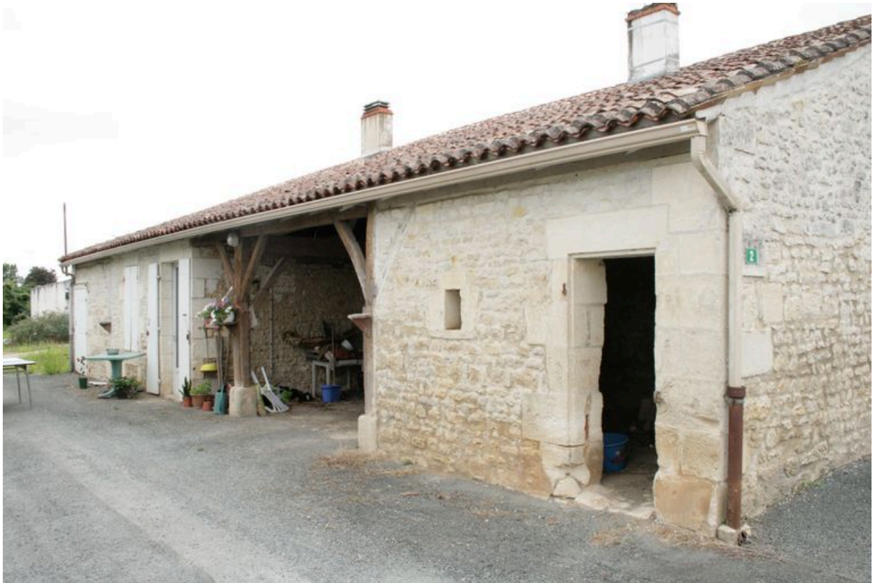
Les dépendances adossées au logement, depuis le nord-est.