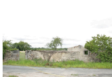
D'anciennes dépendances, depuis le nord-ouest. IVR54_20091701595NUCA