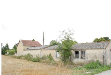
La série de dépendances, façades postérieures, depuis le nord-est.