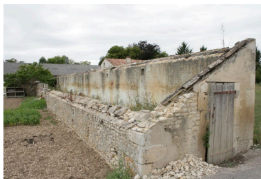
D'anciens toits à bêtes, depuis le sud-est. IVR54_20091701596NUCA