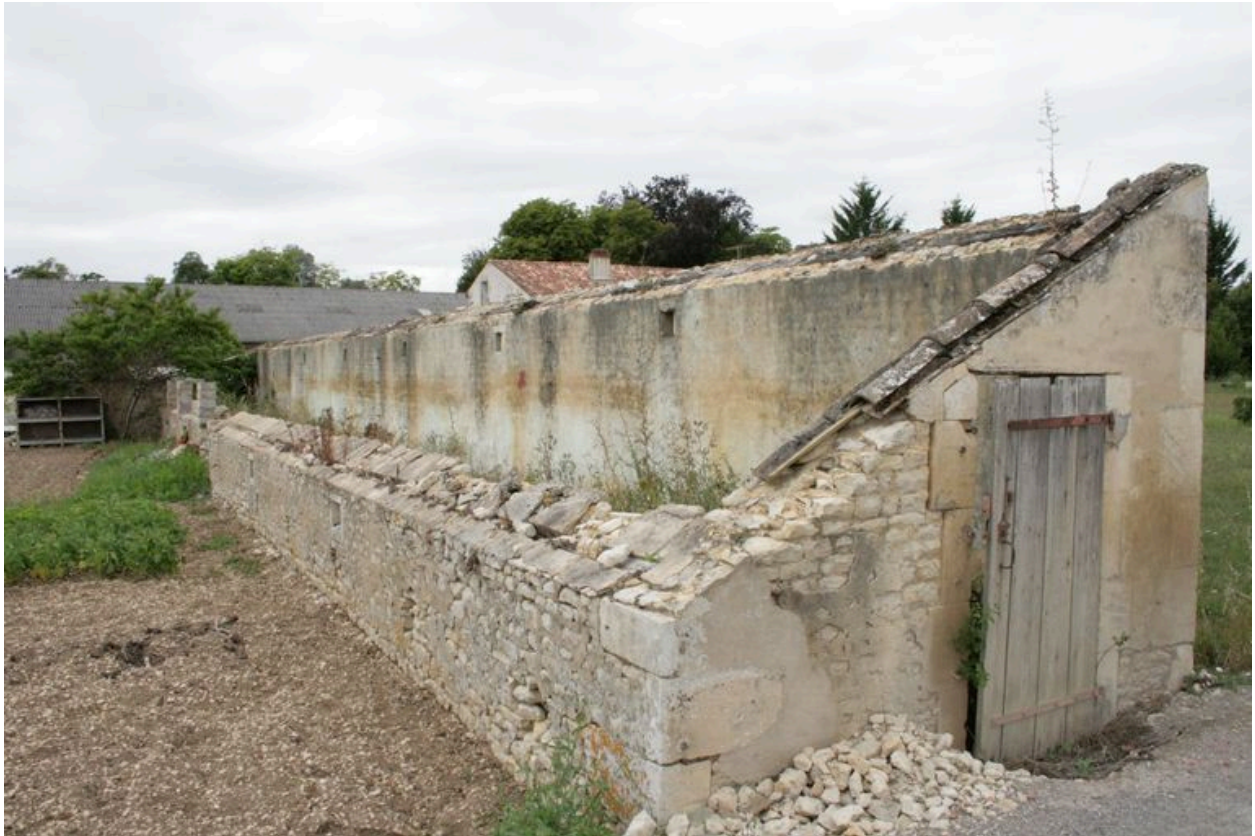
D'anciens toits à bêtes, depuis le sud-est.