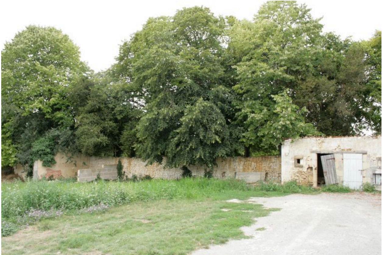
Des dépendances et un toit à bêtes, depuis le nord-ouest.