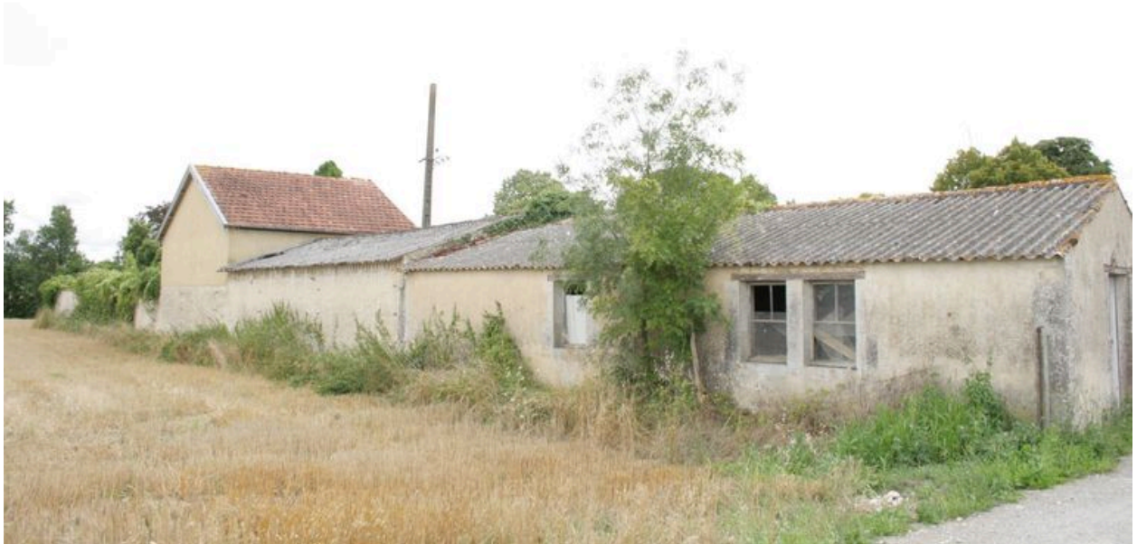
La série de dépendances, façades postérieures, depuis le nord-est.