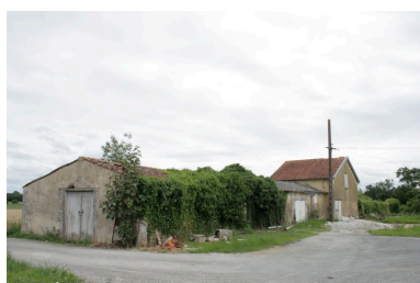
Une série de dépendances, depuis le nord-ouest.