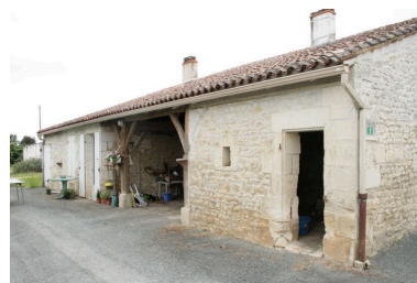
Les dépendances adossées au logement, depuis le nord-est. IVR54_20091701601NUCA