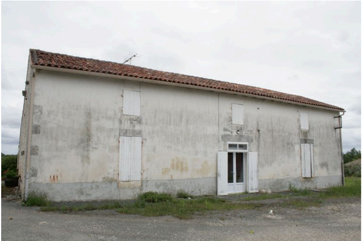
Le logement de la ferme, depuis le nord-ouest.