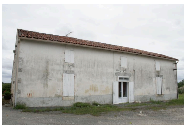
Le logement de la ferme, depuis le nord-ouest.