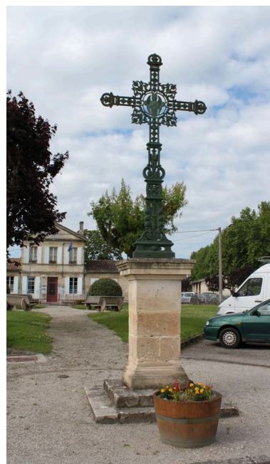
Vue d'ensemble. IVR72_20103303917NUCA