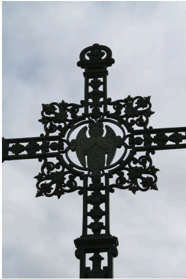
Détail. IVR72_20103303927NUCA