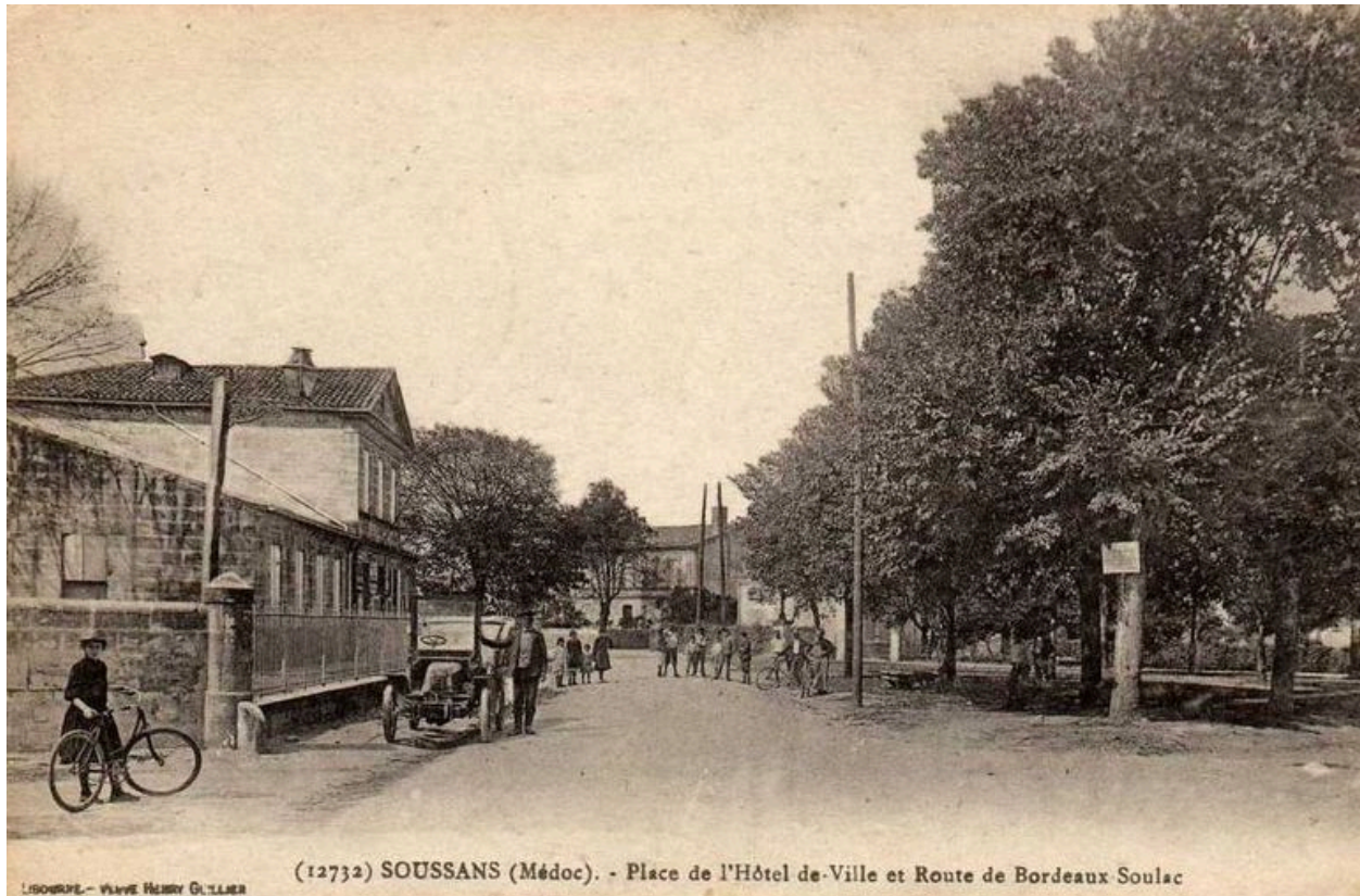
Carte postale : place de l'hôtel de Ville et route Bordeaux-Soulac (collection particulière).