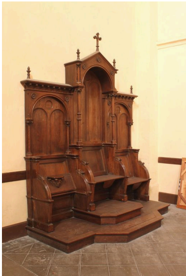
Ensemble avec la stalle du célébrant principal.

IVR72_20124000507NUC2A