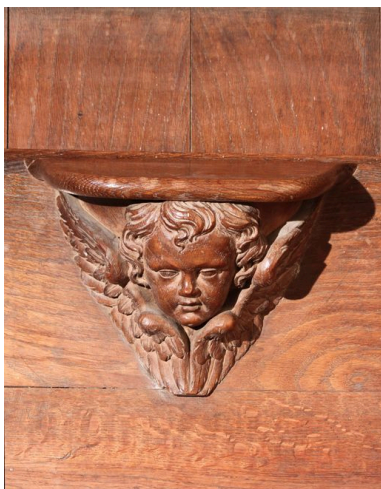
Ensemble avec la stalle du célébrant principal : miséricorde centrale.