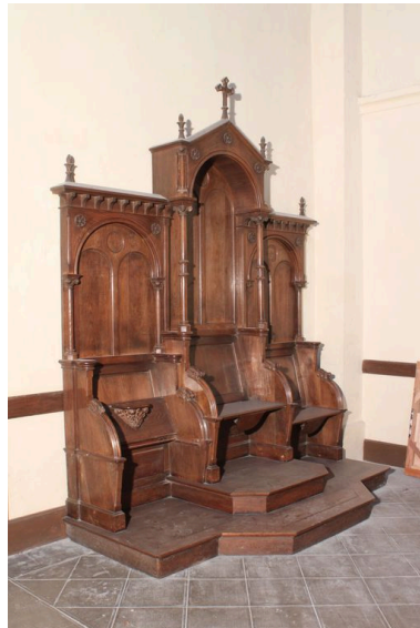
Ensemble avec la stalle du célébrant principal.

IVR72_20124000507NUC2A