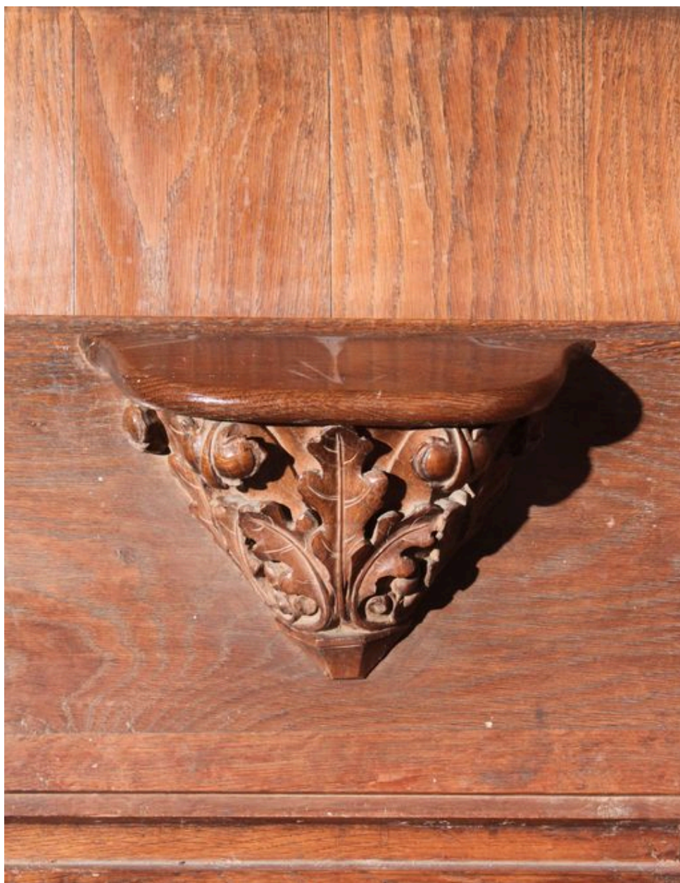
Ensemble avec la stalle du célébrant principal : miséricorde de gauche.