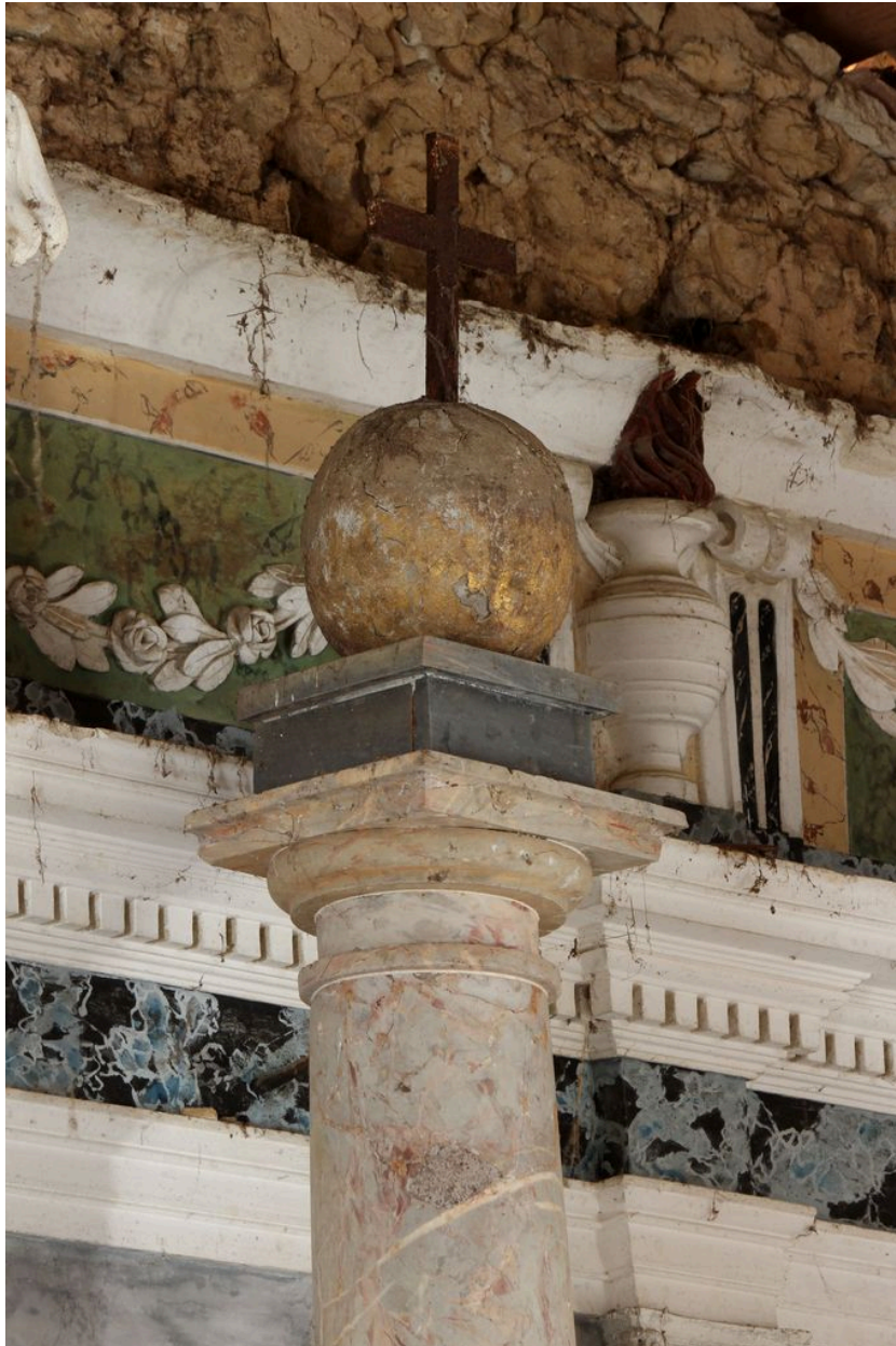
Détail du globe curcifère sommital.