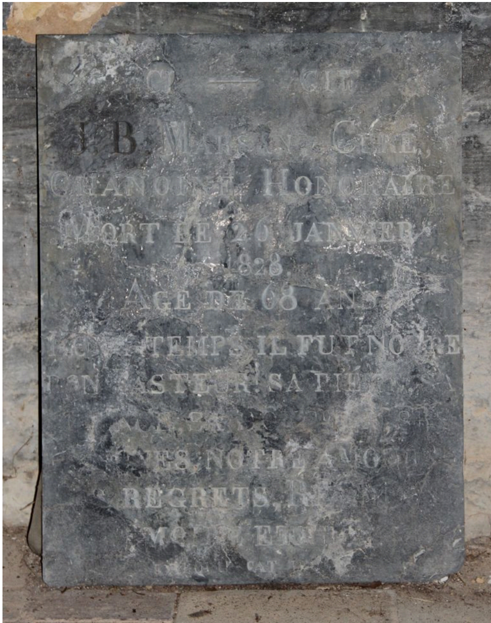
Détail de l'épithaphe.