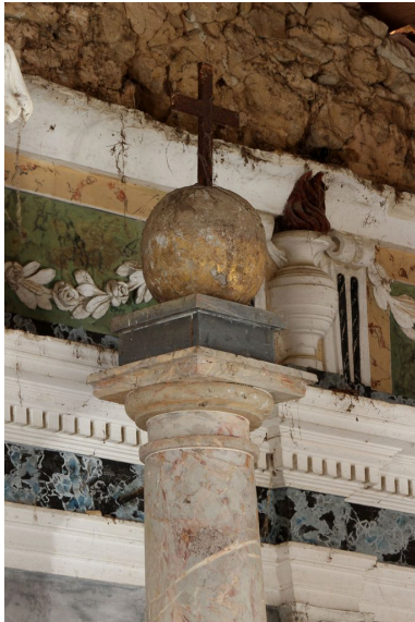
Détail du globe curcifère sommital.