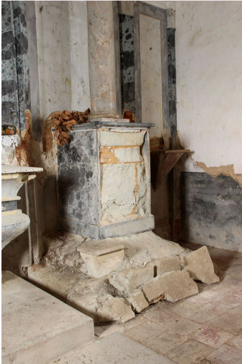
Détail du piédestal.