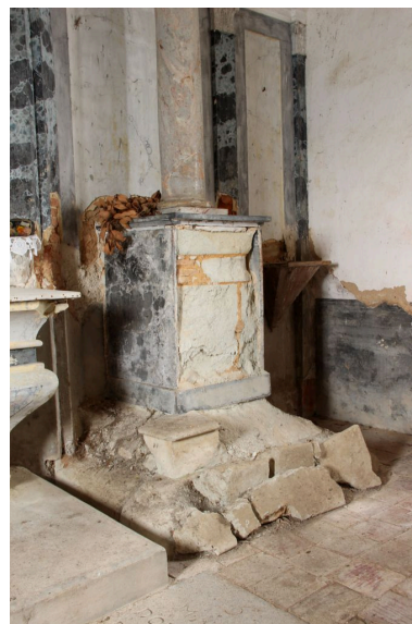
Détail du piédestal.

IVR72_20154000295NUC2A