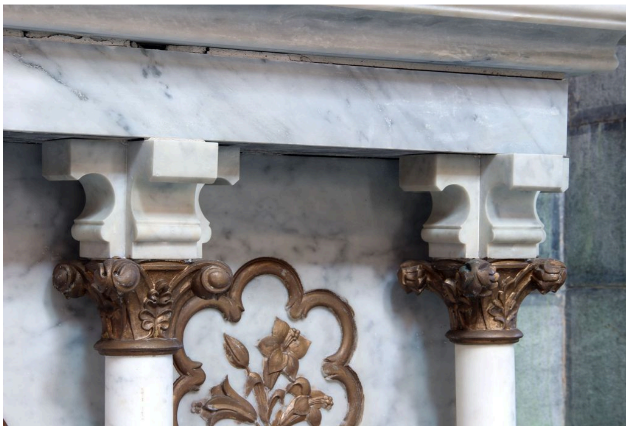
Détail du tombeau d'autel : chapiteaux et consoles de colonnettes.