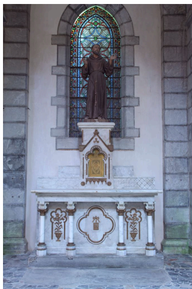
Ensemble de face. IVR72_20206401755NUC2A