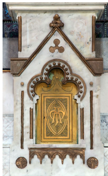
Tabernacle : armoire eucharistique. IVR72_20206401757NUC2A