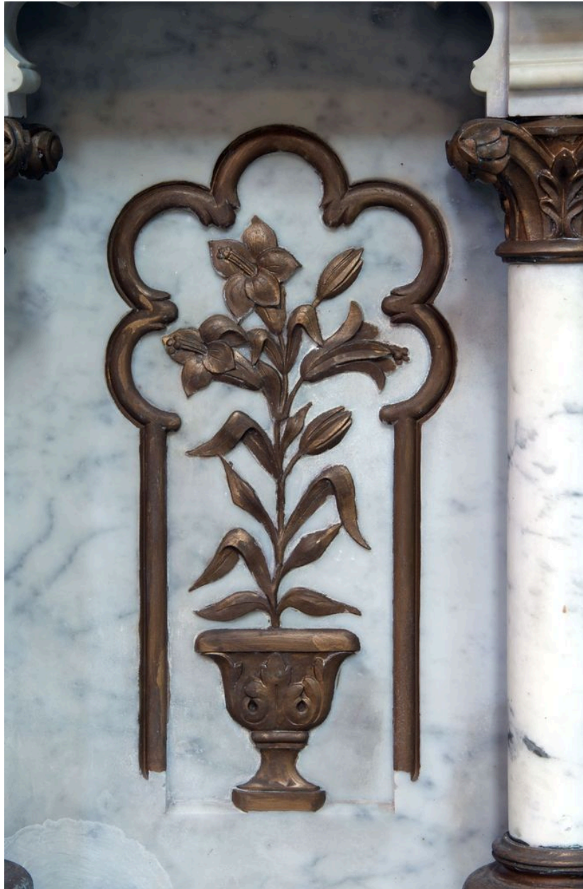
Détail du tombeau d'autel : lys dans un vase.