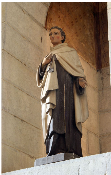
Statue de saint Simon Stock, originellement sur l'autel du Scapulaire (?), actuellement à l'entrée du collatéral droit. IVR72_20206401780NUC2A