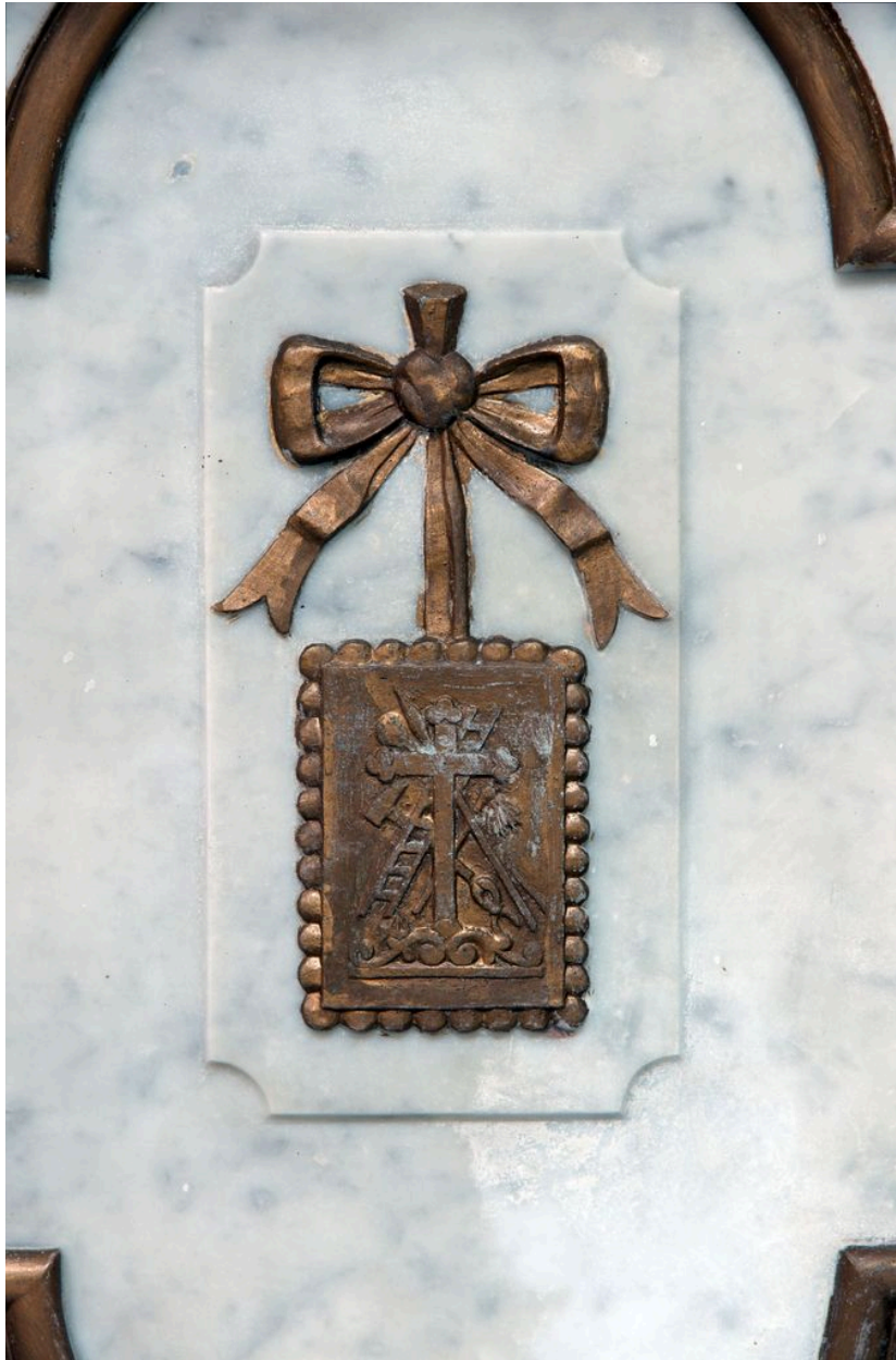
Détail du tombeau d'autel : scapulaire.