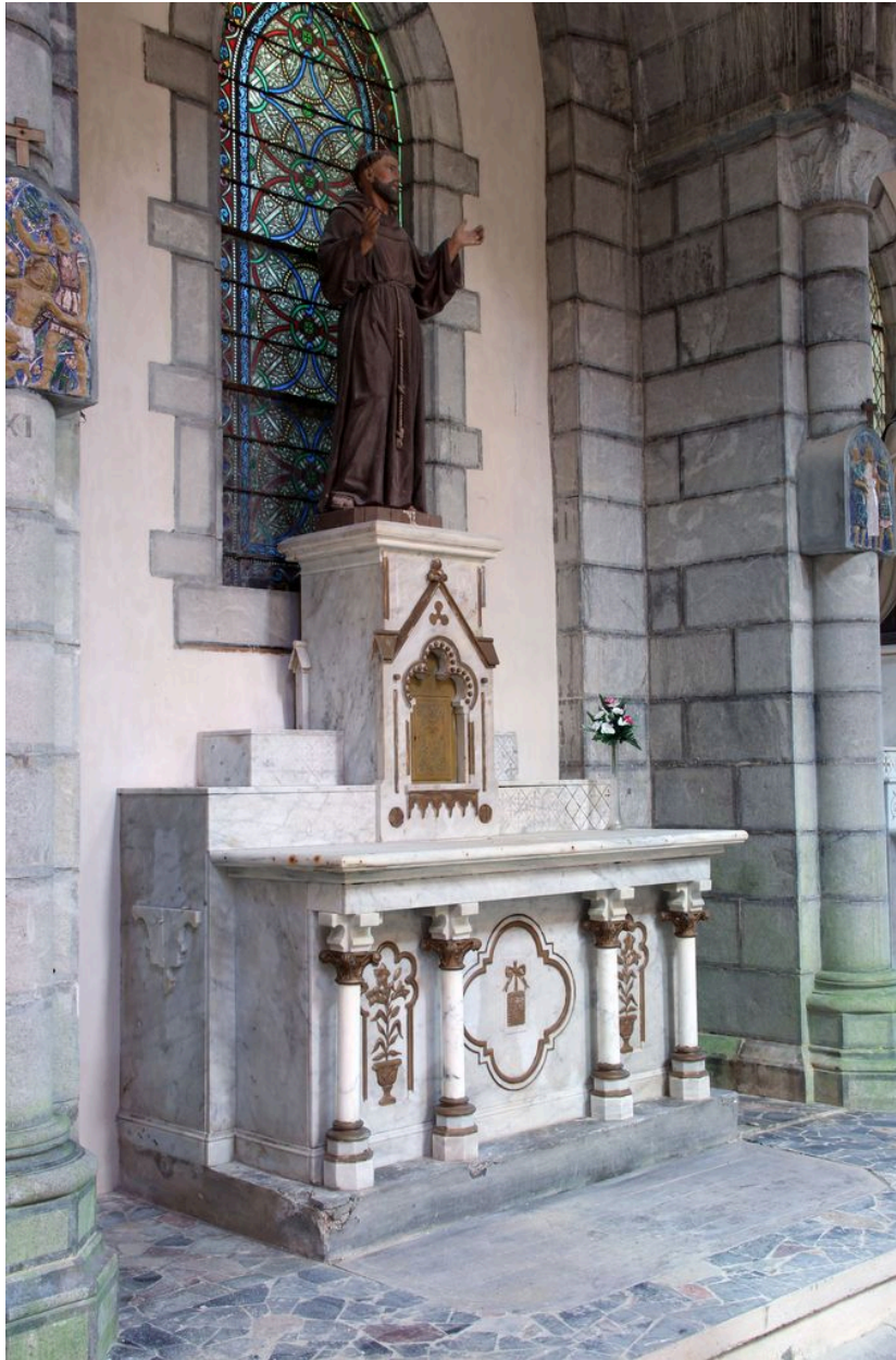
Ensemble de trois-quarts gauche.