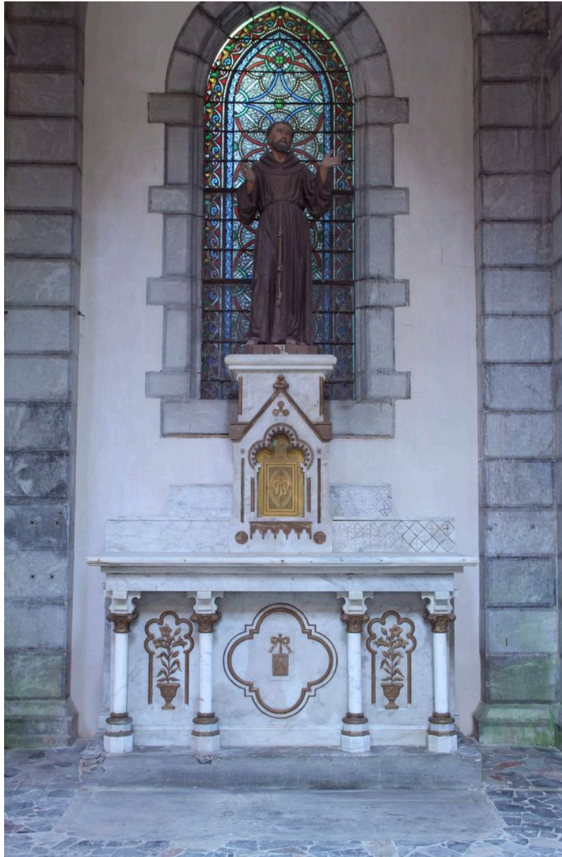
Ensemble de face.