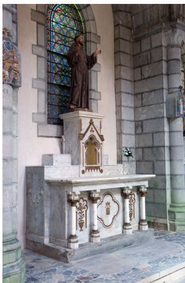
Ensemble de trois-quarts gauche. IVR72_20206401756NUC2A