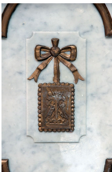
Détail du tombeau d'autel : scapulaire. IVR72_20206401759NUC2A