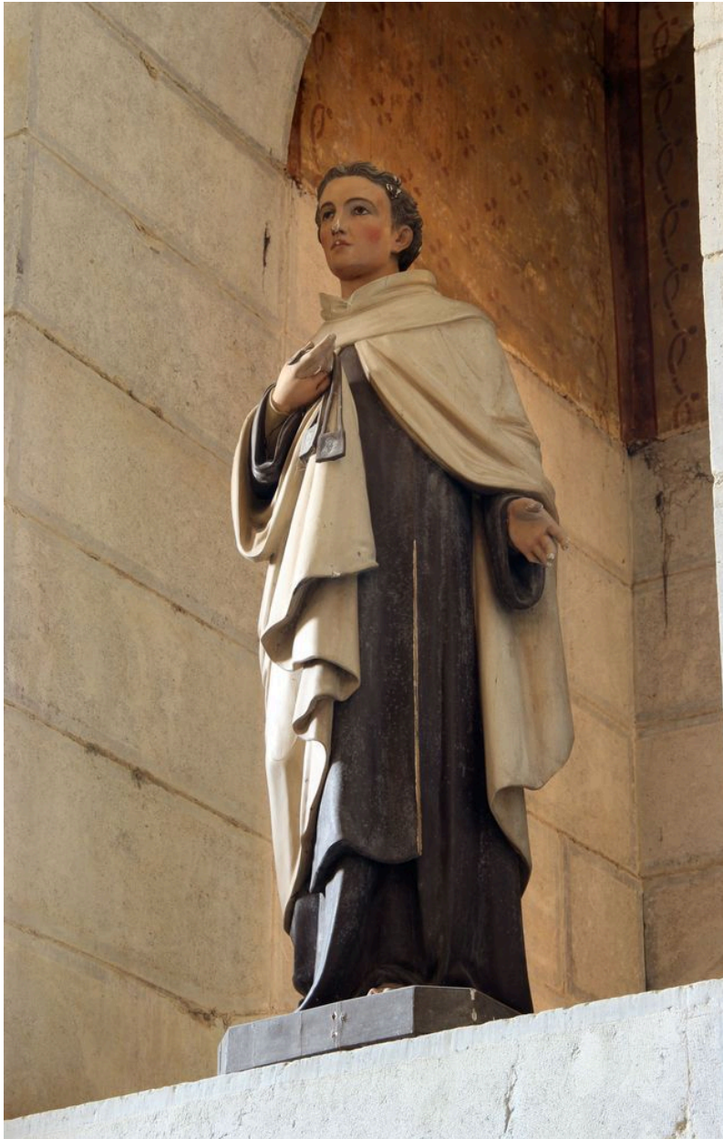
Statue de saint Simon Stock, originellement sur l'autel du Scapulaire (?), actuellement à l'entrée du collatéral droit.