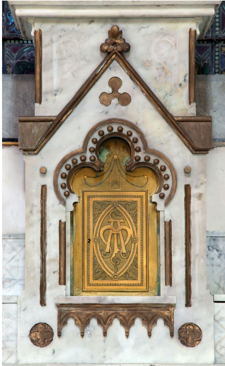
Tabernacle : armoire eucharistique.