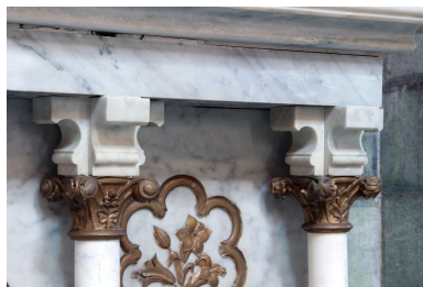
Détail du tombeau d'autel : chapiteaux et consoles de colonnettes.