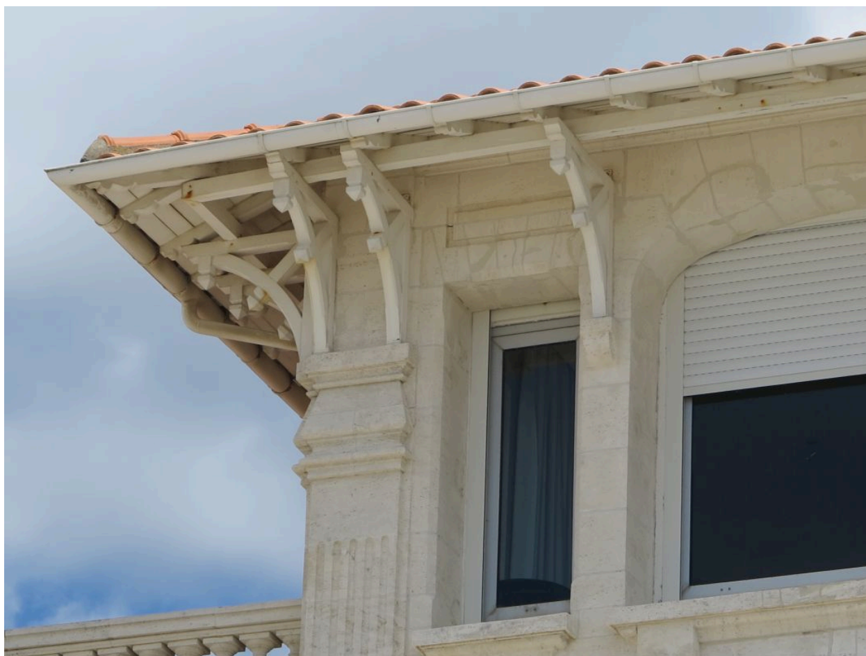
Détail du décor : débordement de toit, aisseliers en bois, pilastre.