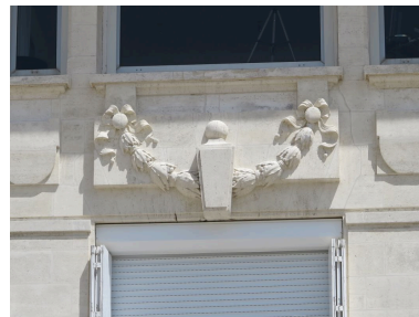
Détail du décor sculpté : guirlande végétale.