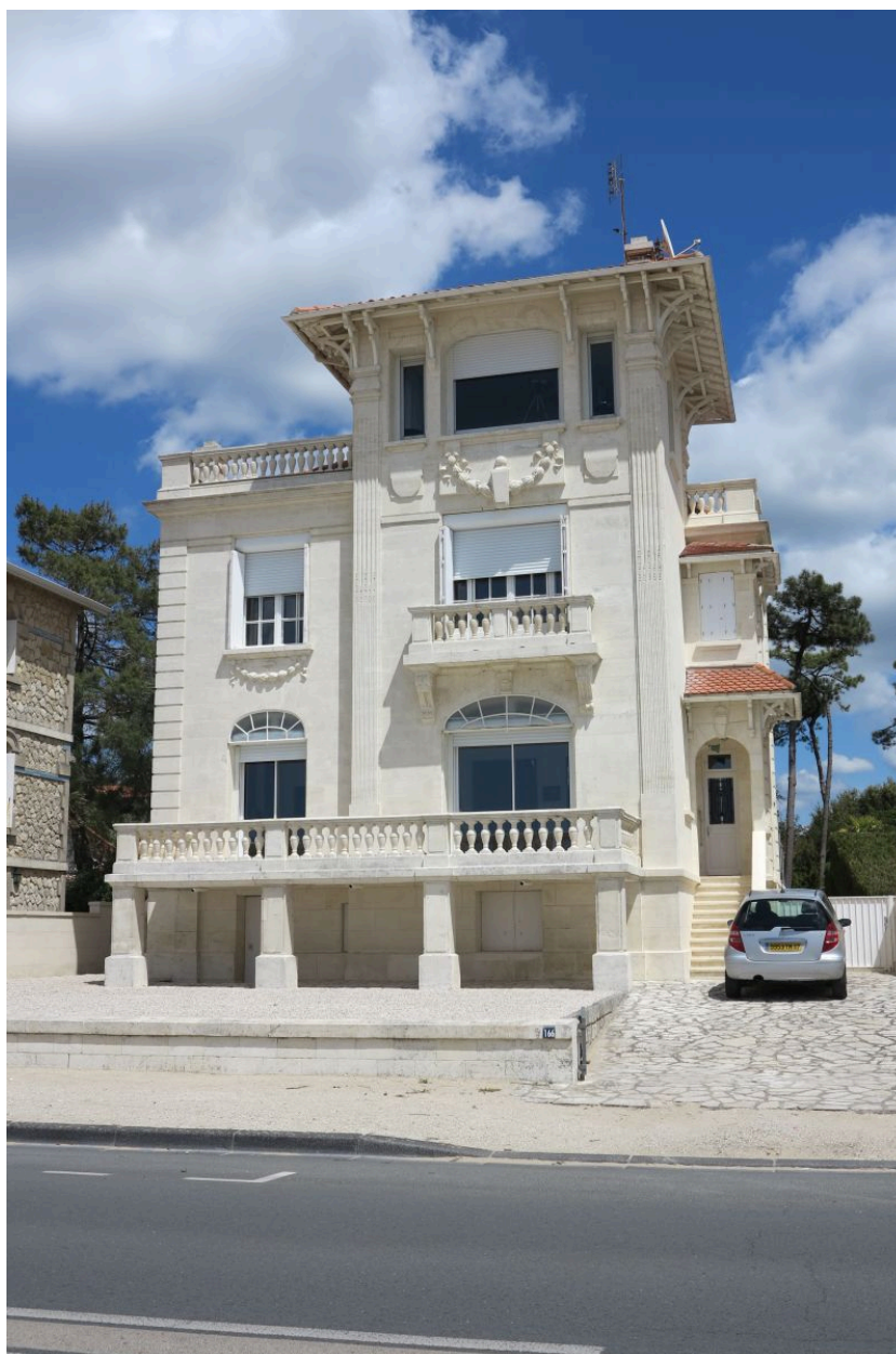
La villa vue depuis le sud-ouest.