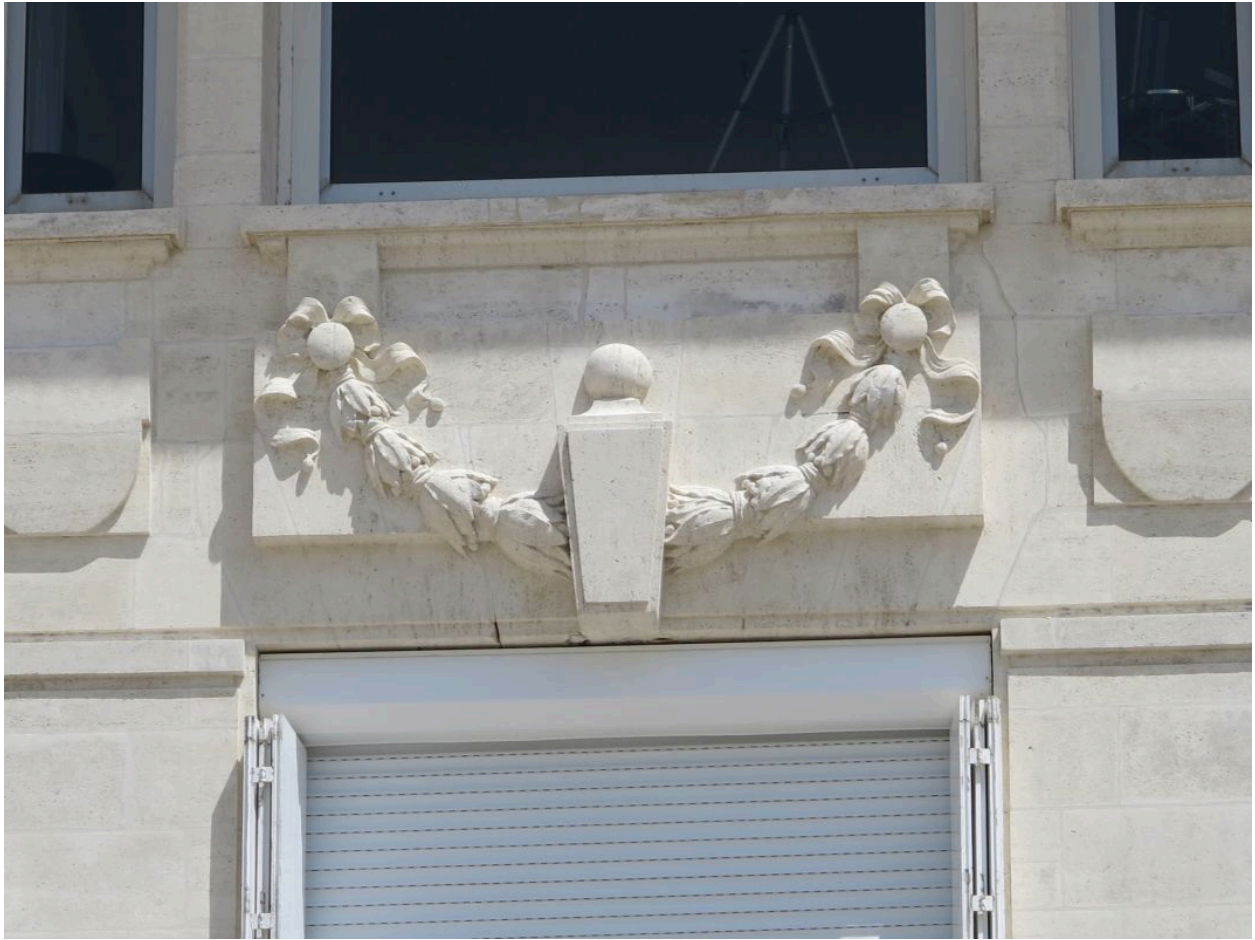
Détail du décor sculpté : guirlande végétale.