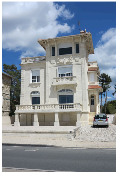
La villa vue depuis le sud-ouest.