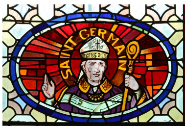
Détail : médaillon à l'effigie de saint Germain. IVR72_20204000818NUC2A

IVR72_20204000816NUC2A