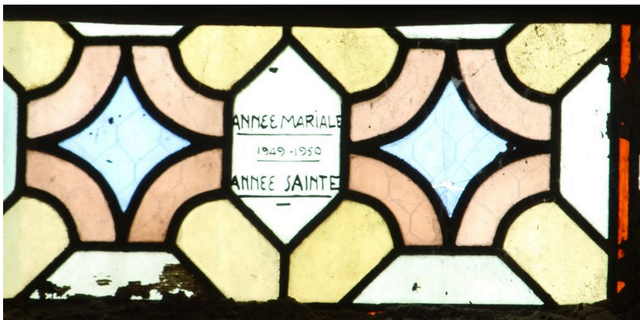
Détail : inscription.