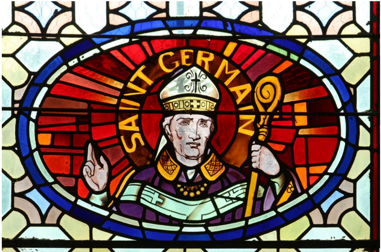
Détail : médaillon à l'effigie de saint Germain.