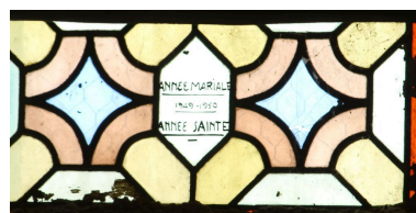
Détail : inscription. IVR72_20204000817NUC2A