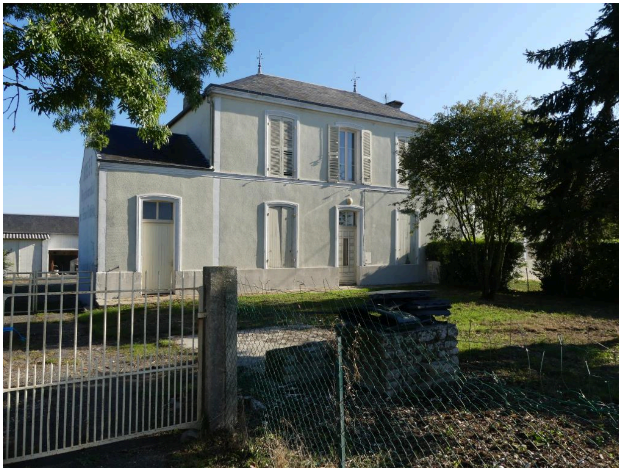
Façade orientée au sud de l'ancienne école communale de Vergné.