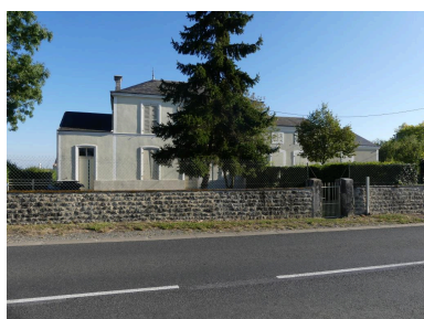
Vue générale de la mairie-école de Vergné, prise depuis le sud-ouest. IVR75_20211706001NUCA