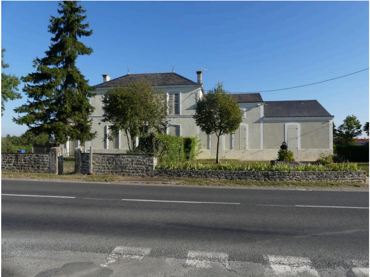
Vue générale de la mairie-école de Vergné, prise depuis le sud.