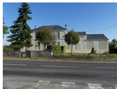
Vue générale de la mairie-école de Vergné, prise depuis le sud.