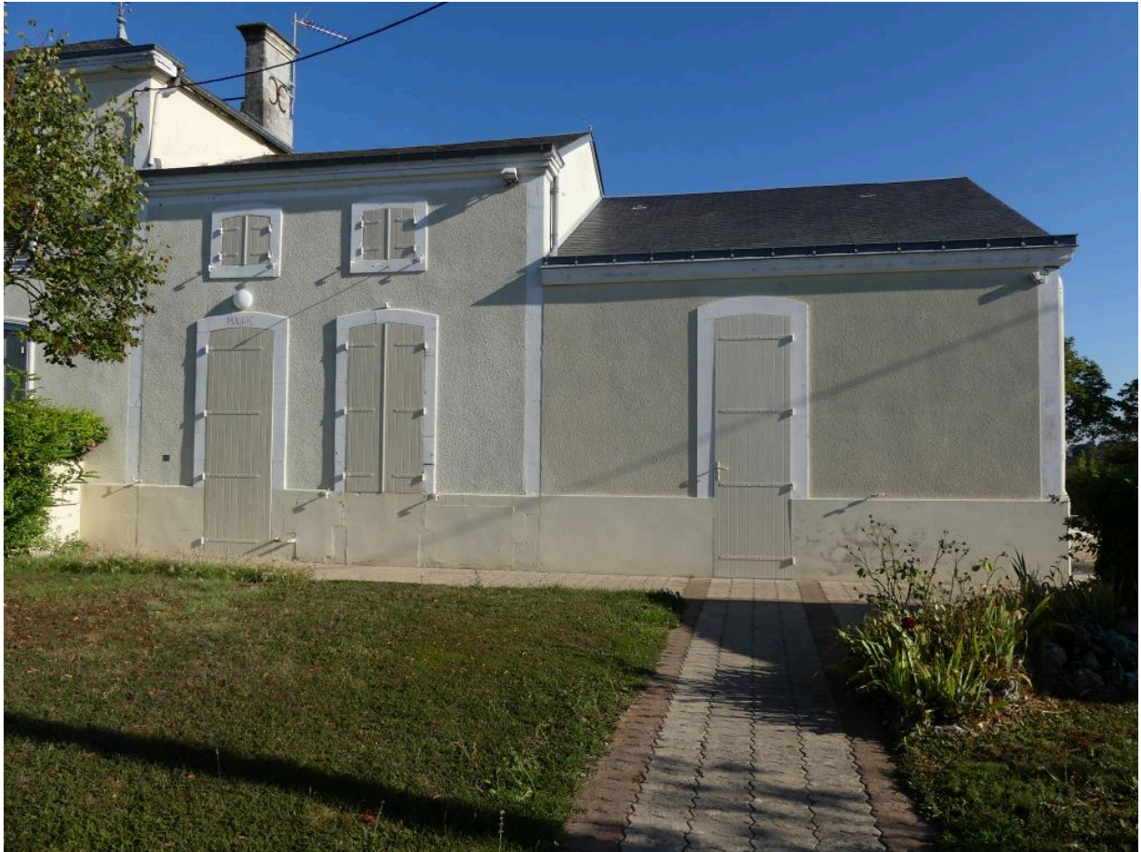
Façade, orientée au sud, de la mairie de la commune de Vergné.