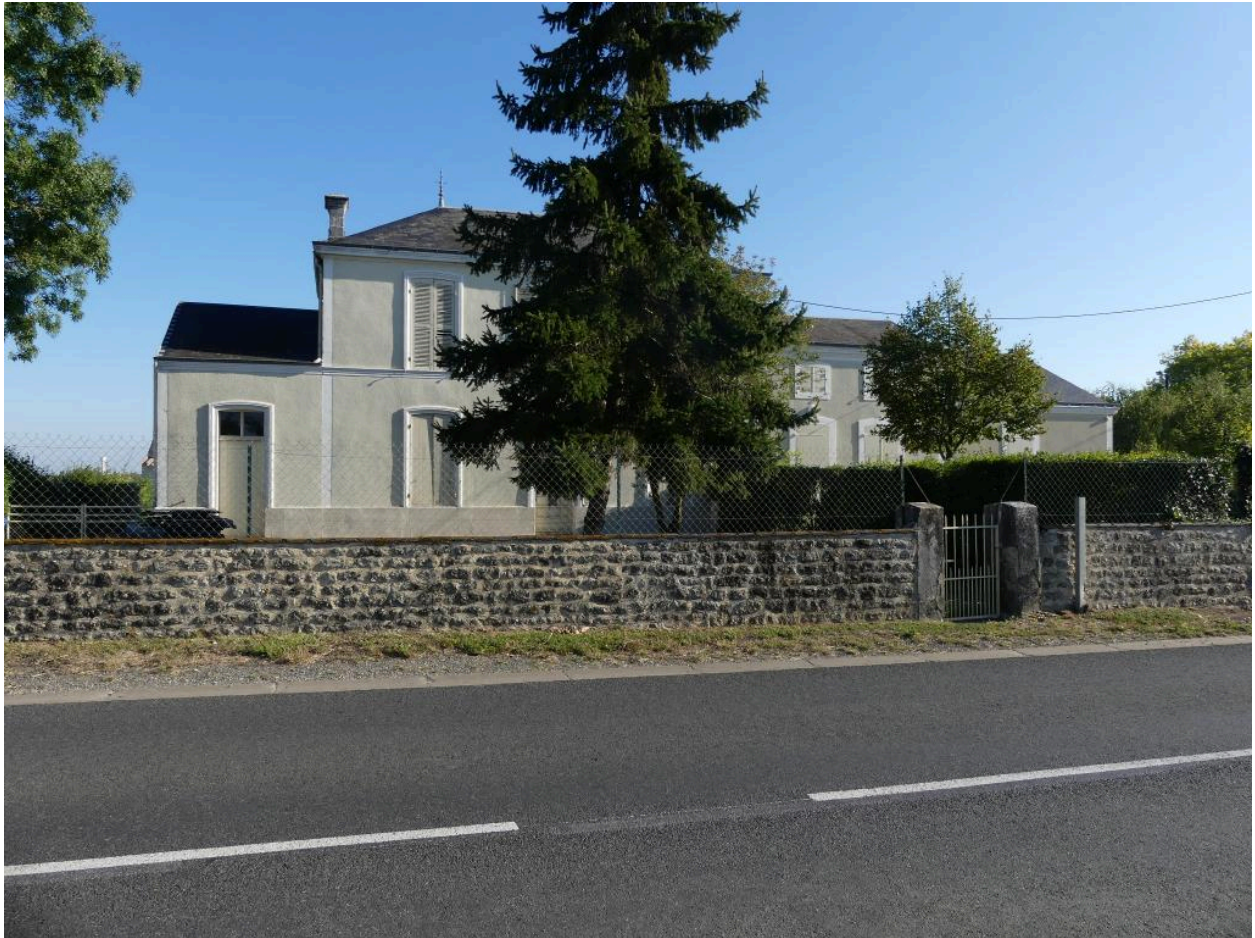
Vue générale de la mairie-école de Vergné, prise depuis le sud-ouest.