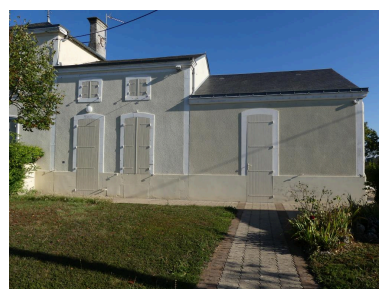
Façade, orientée au sud, de la mairie de la commune de Vergné. IVR75_20211706003NUCA