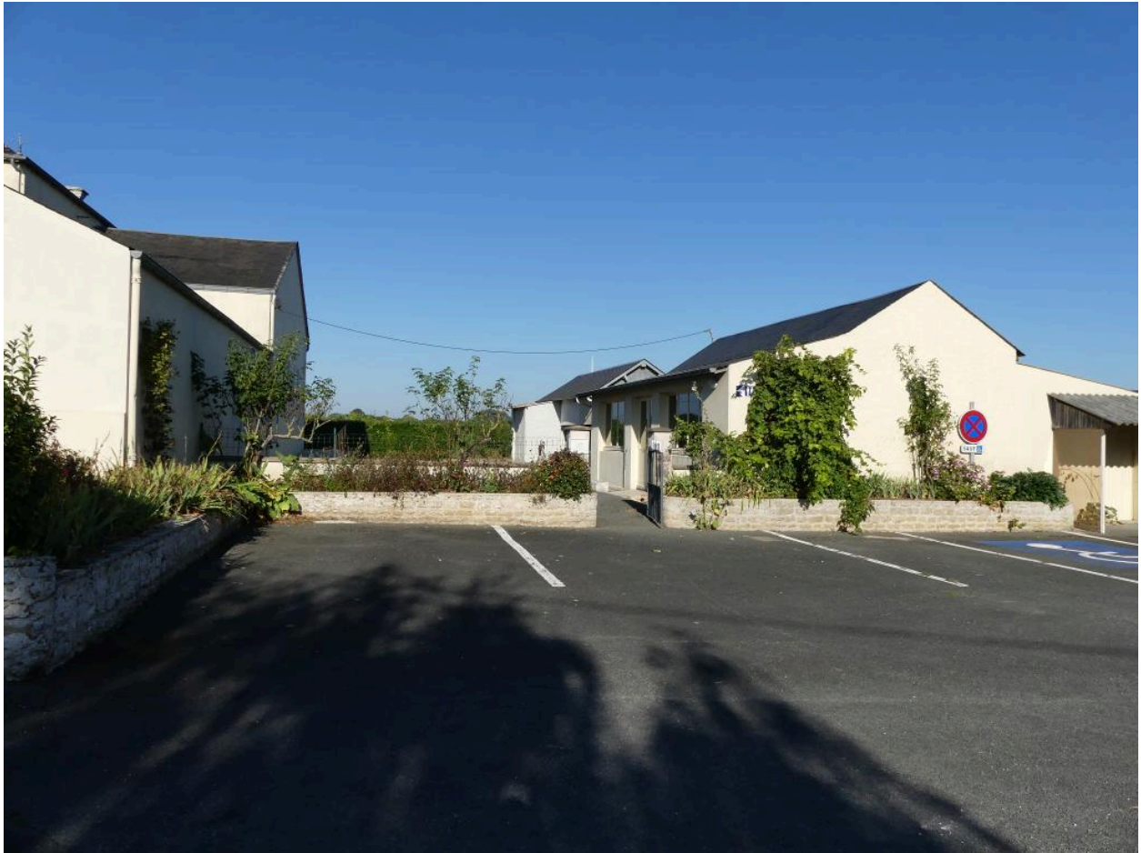
Vue générale de la mairie-école de Vergné, prise depuis l'est.