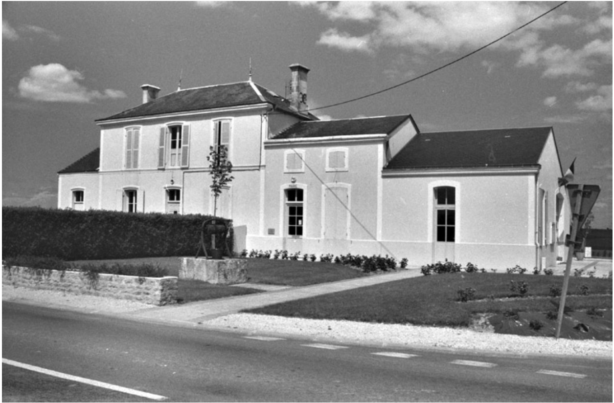
Vue général de la mairie de Vergné, prise depuis le sud-est, 1994.