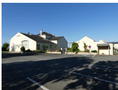
Vue générale de la mairie-école de Vergné, prise depuis le nord-est.