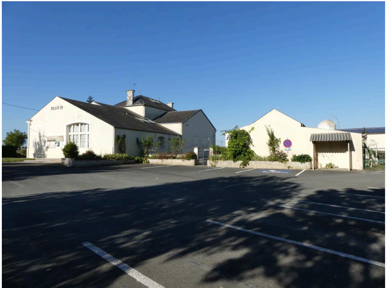
Vue générale de la mairie-école de Vergné, prise depuis le nord-est.