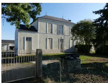
Façade orientée au sud de l'ancienne école communale de Vergné. IVR75_20211706002NUCA