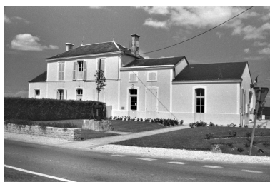
Vue général de la mairie de Vergné, prise depuis le sud-est, 1994. IVR54_19941701639Z