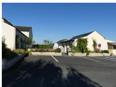
Vue générale de la mairie-école de Vergné, prise depuis l'est.