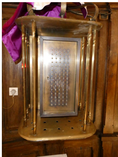
Le tabernacle en laiton doré, vu de face. IVR75_20228601994NUCA