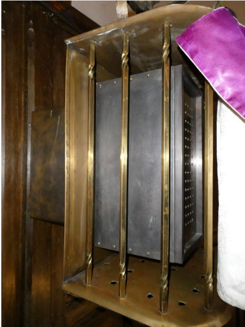
Côté gauche du tabernacle.