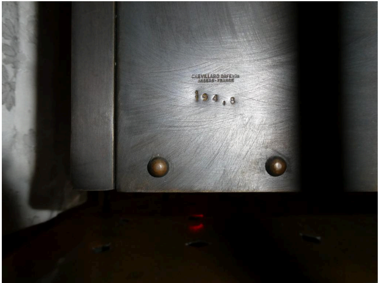
Signatures des établissements Chevallard, à Angers.