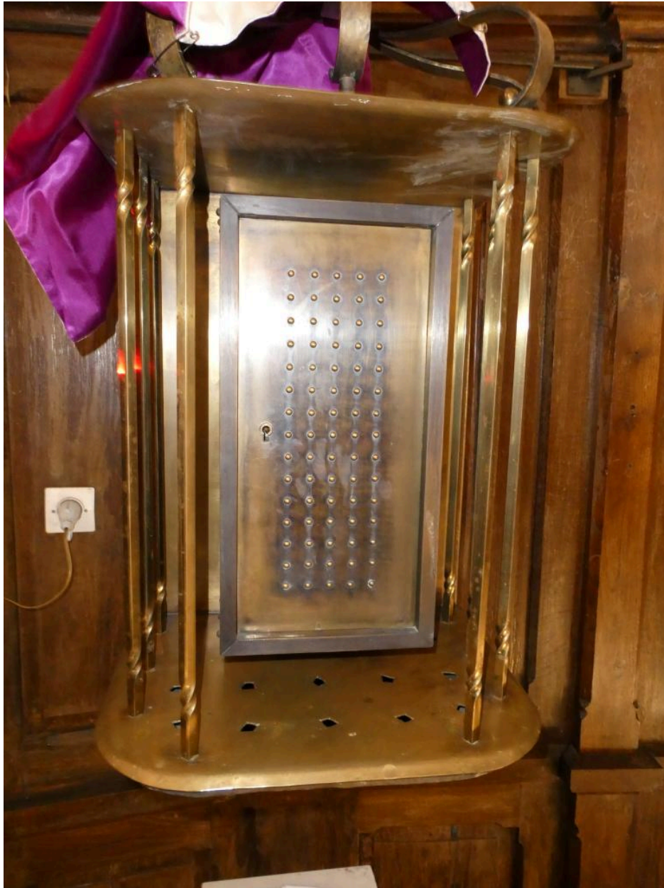
Le tabernacle en laiton doré, vu de face.