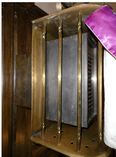
Côté gauche du tabernacle.