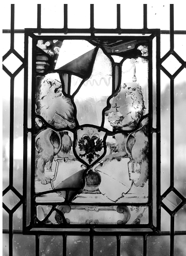
Panneau de droite : écus armoriés. IVR74_19948701350X