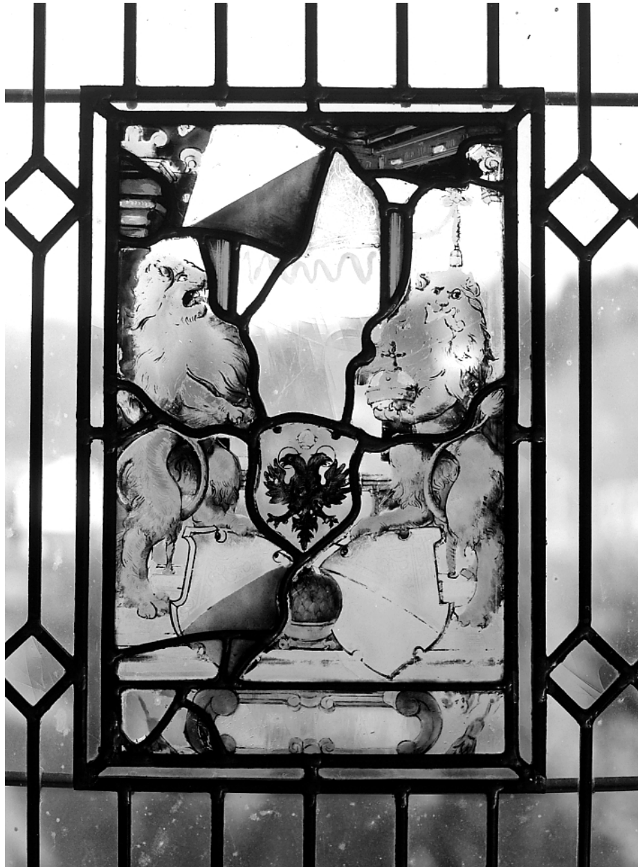
Panneau de droite : écus armoriés.