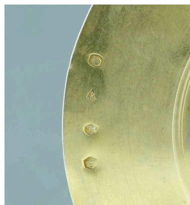
Détail des poinçons.

IVR72_20204002546NUC2A