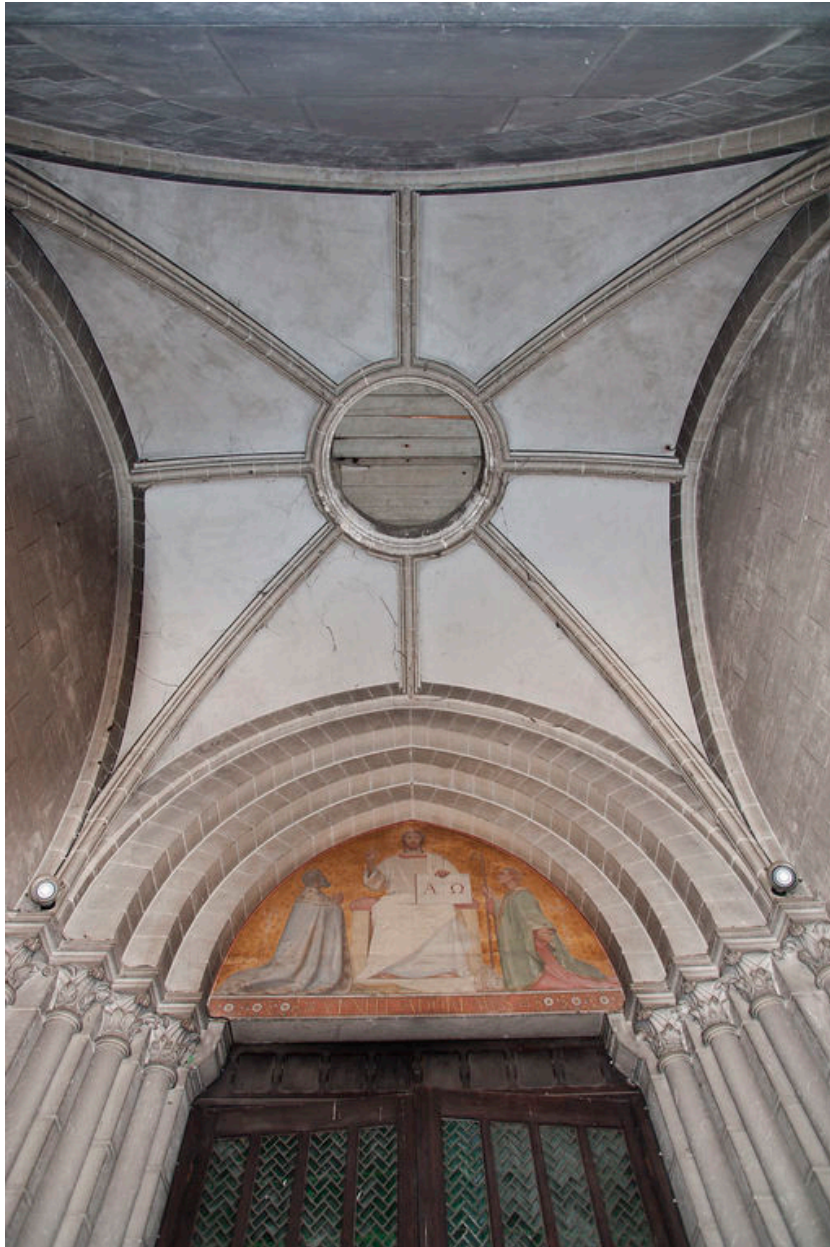
Voûte et tympan du porche.