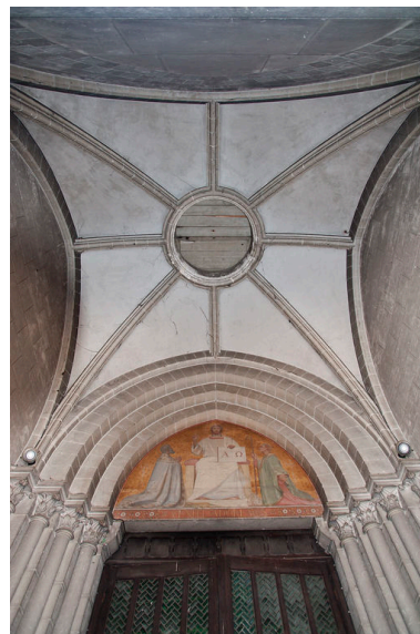
Voûte et tympan du porche.