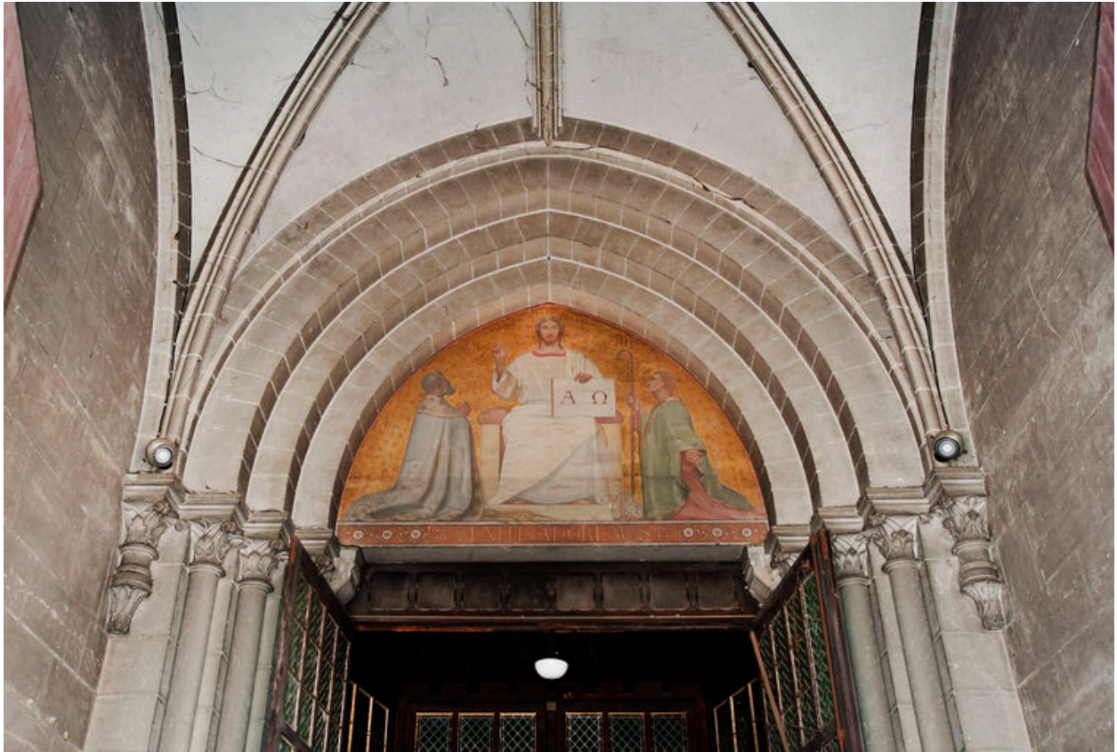
Tympan intérieur de l'église.