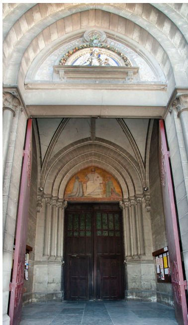
Porche de l'église.