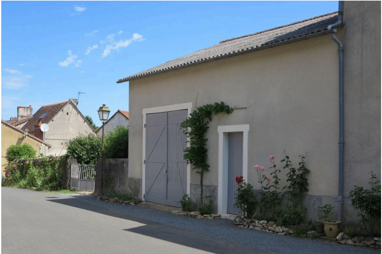
Garage, au nord de la parcelle H3 844.