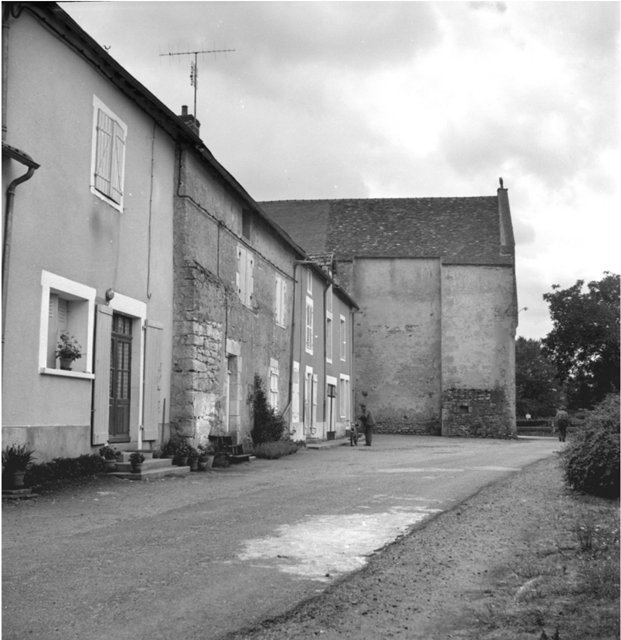
Elévation ouest, en 1976.