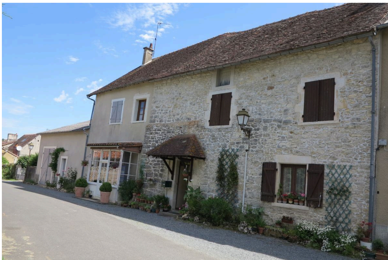
Maisons cadastrées H3 844 (à gauche) et H3 846 (à droite), façades ouest.