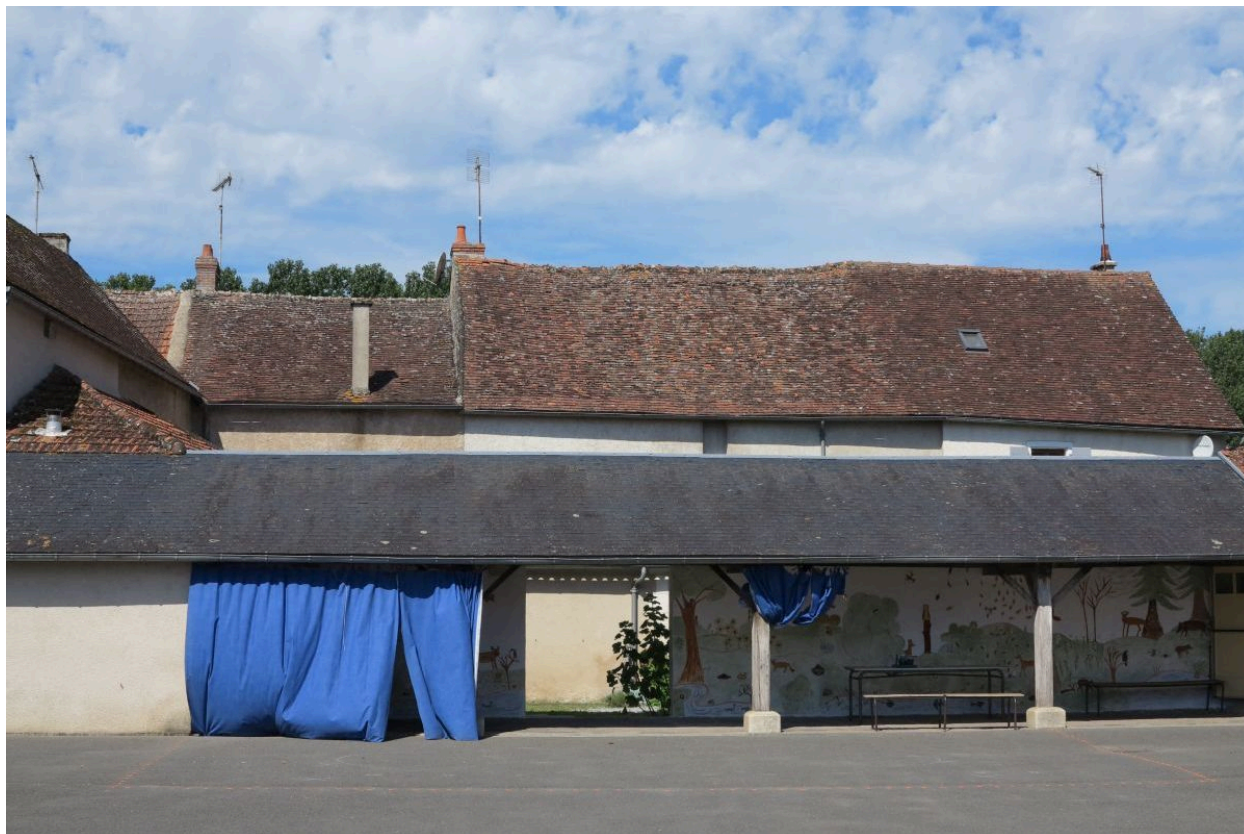
Maisons cadastrées H3 846 (à gauche) et H3 844 (à droite), toitures orientales.