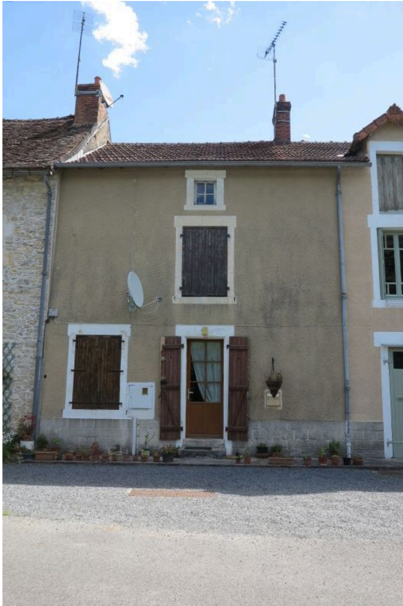
Maison cadastrée H3 672, façade ouest.