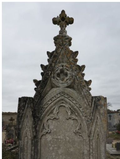
Détail. IVR54_20131705698NUCA