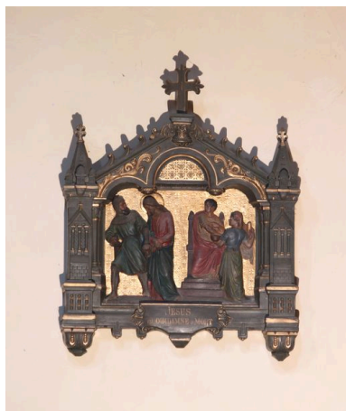
Station I.