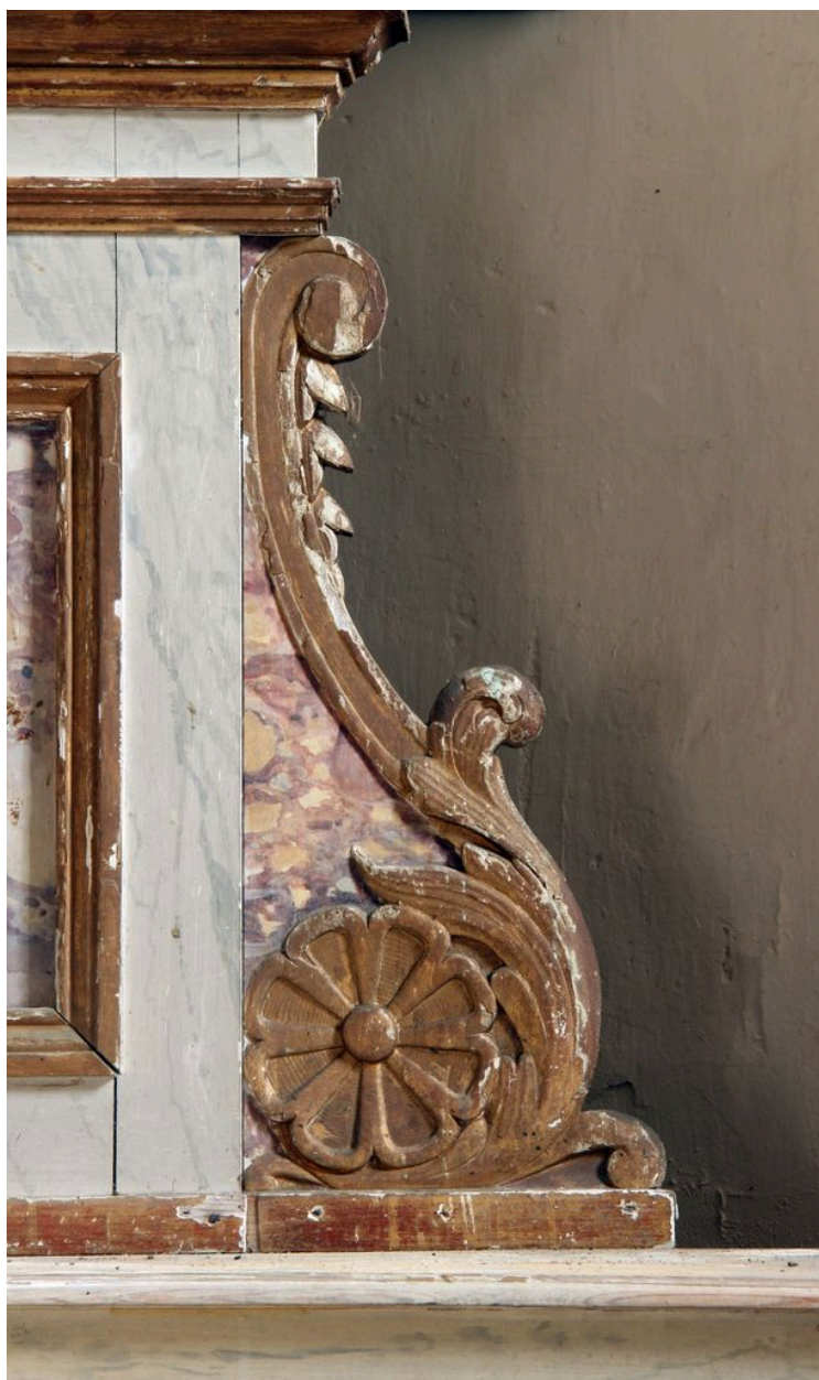
Tabernacle : aileron de l'aile droite.