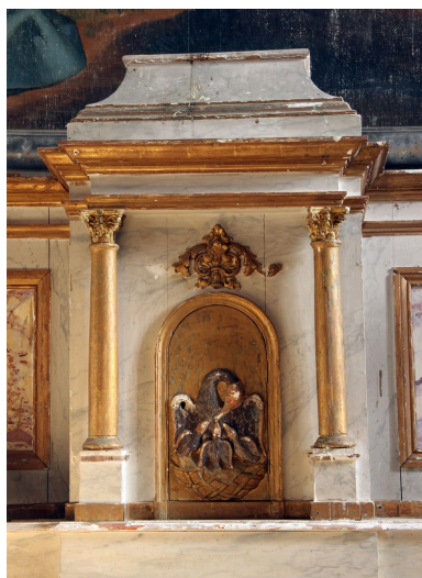
Tabernacle : armoire eucharistique.