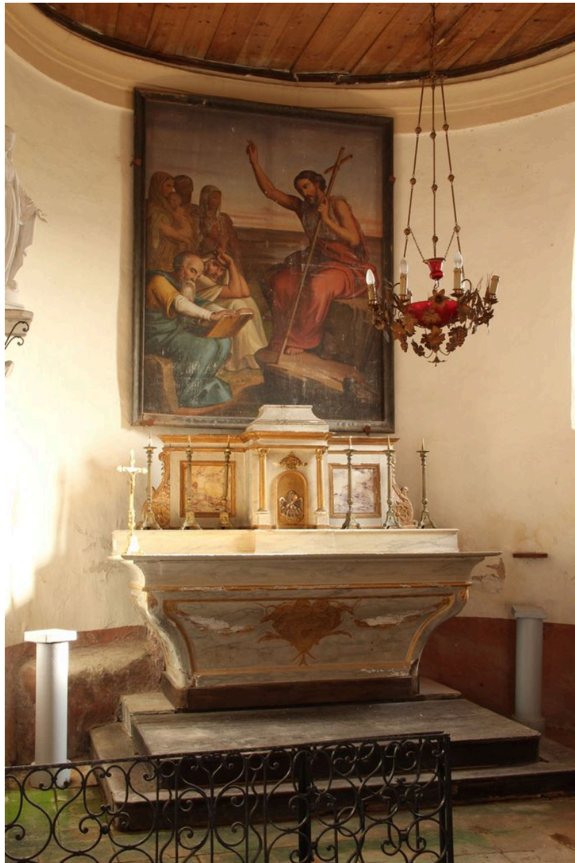
Ensemble avec le tableau d'autel.