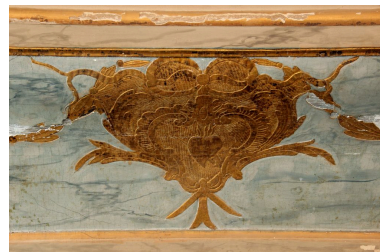
Détail du tombeau d'autel : cartouche avec cœur sacré de la Vierge en réparation.