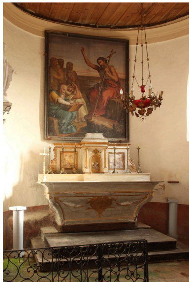
Ensemble avec le tableau d'autel. IVR72_20184002938NUC2A