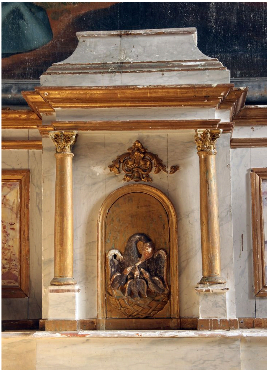
Tabernacle : armoire eucharistique.