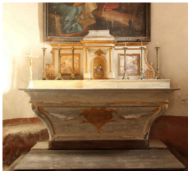
Ensemble. IVR72_20184002939NUC2A