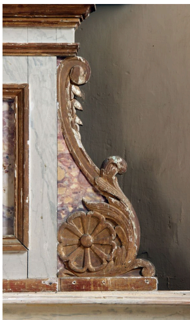
Tabernacle : aileron de l'aile droite. IVR72_20184002942NUC2A