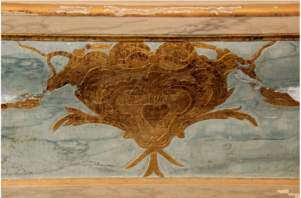
Détail du tombeau d'autel : cartouche avec cœur sacré de la Vierge en réparation.