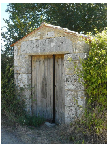
La construction qui abrite l'entrée du souterrain, depuis le sud-ouest. IVR54_20091701728NUCA