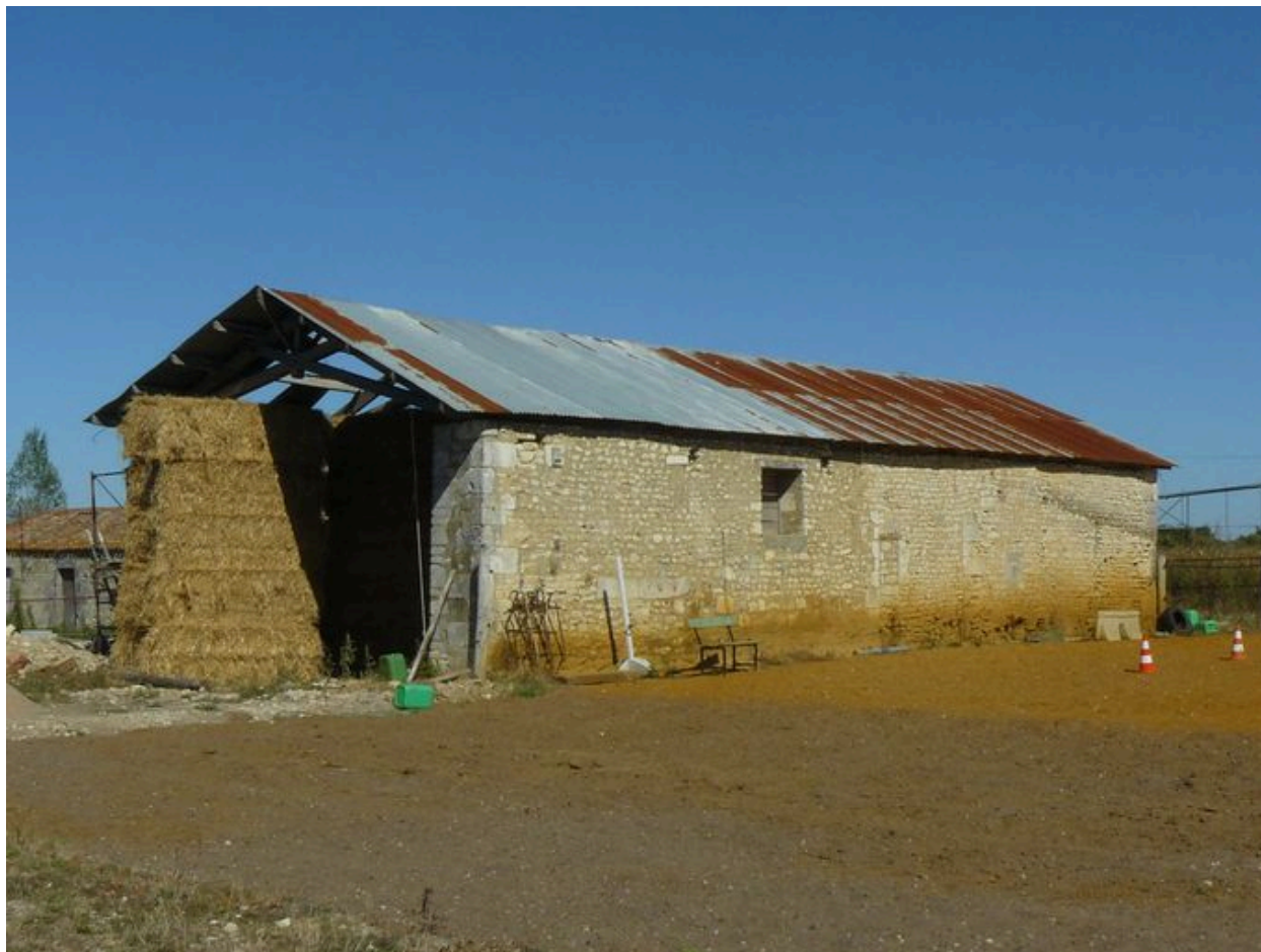
Un hangar, depuis le sud-est.