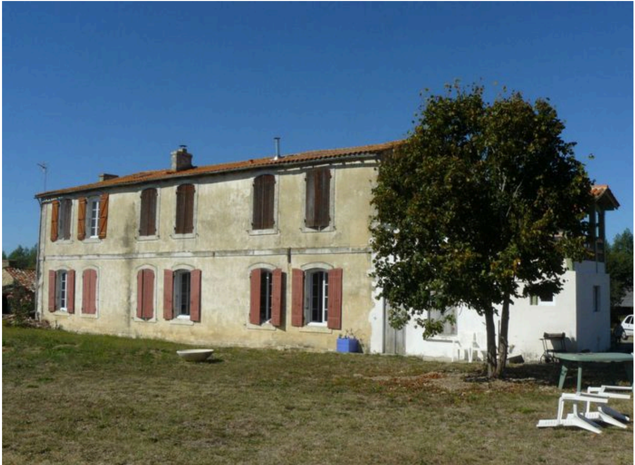
La façade sud-est du logis, depuis le nord-est.