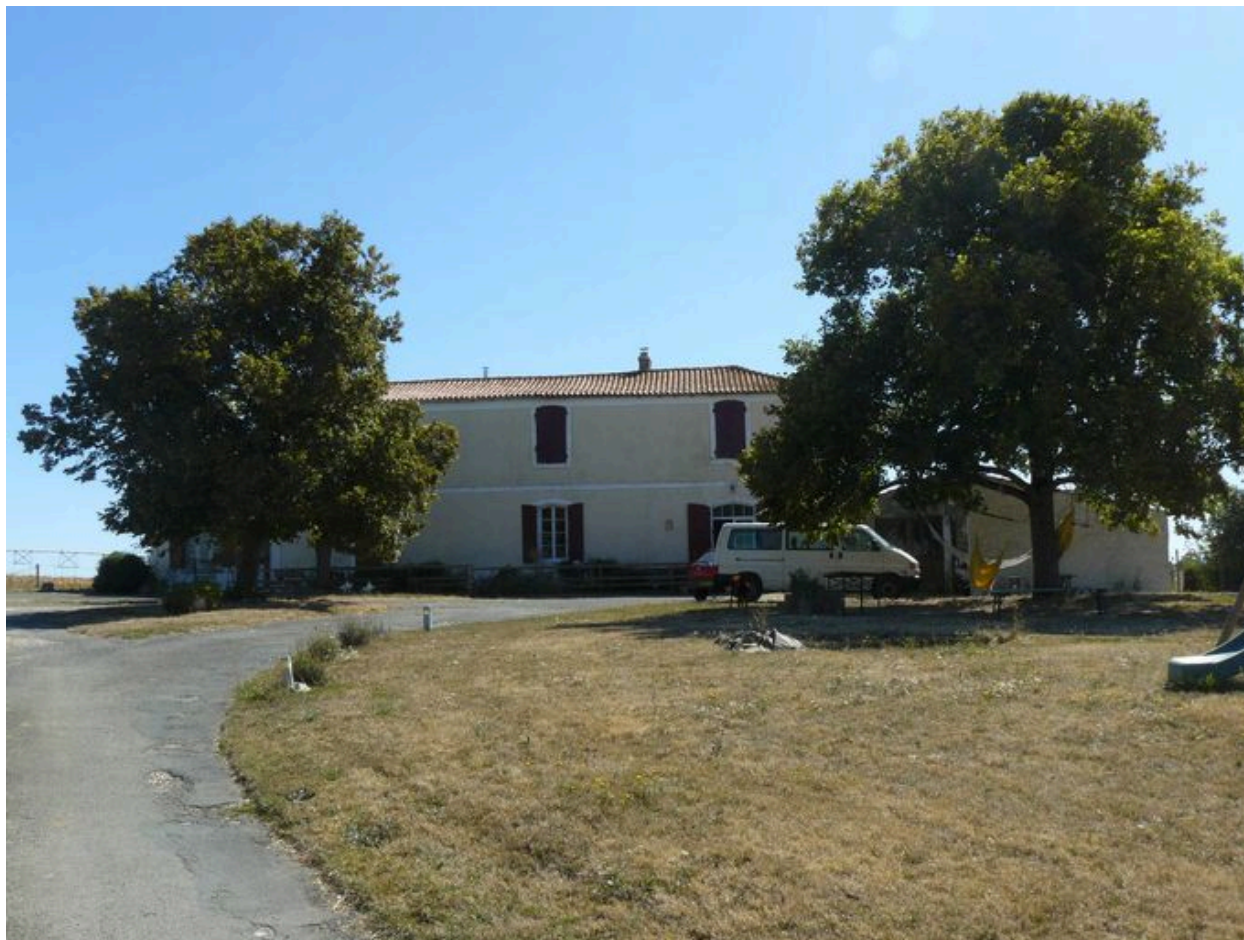
Le logis du Fresne, depuis le nord-ouest.