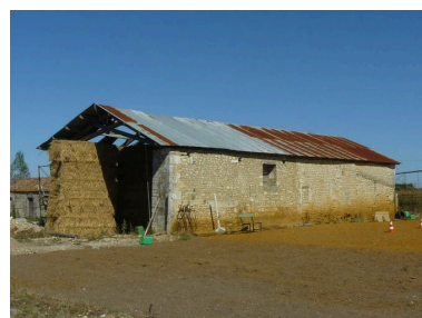
Un hangar, depuis le sud-est.