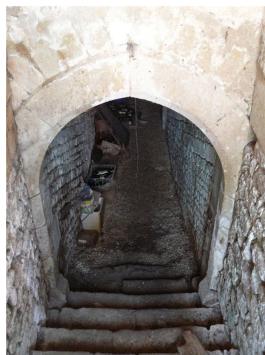
L'entrée du souterrain, depuis le sud-ouest. IVR54_20091701727NUCA