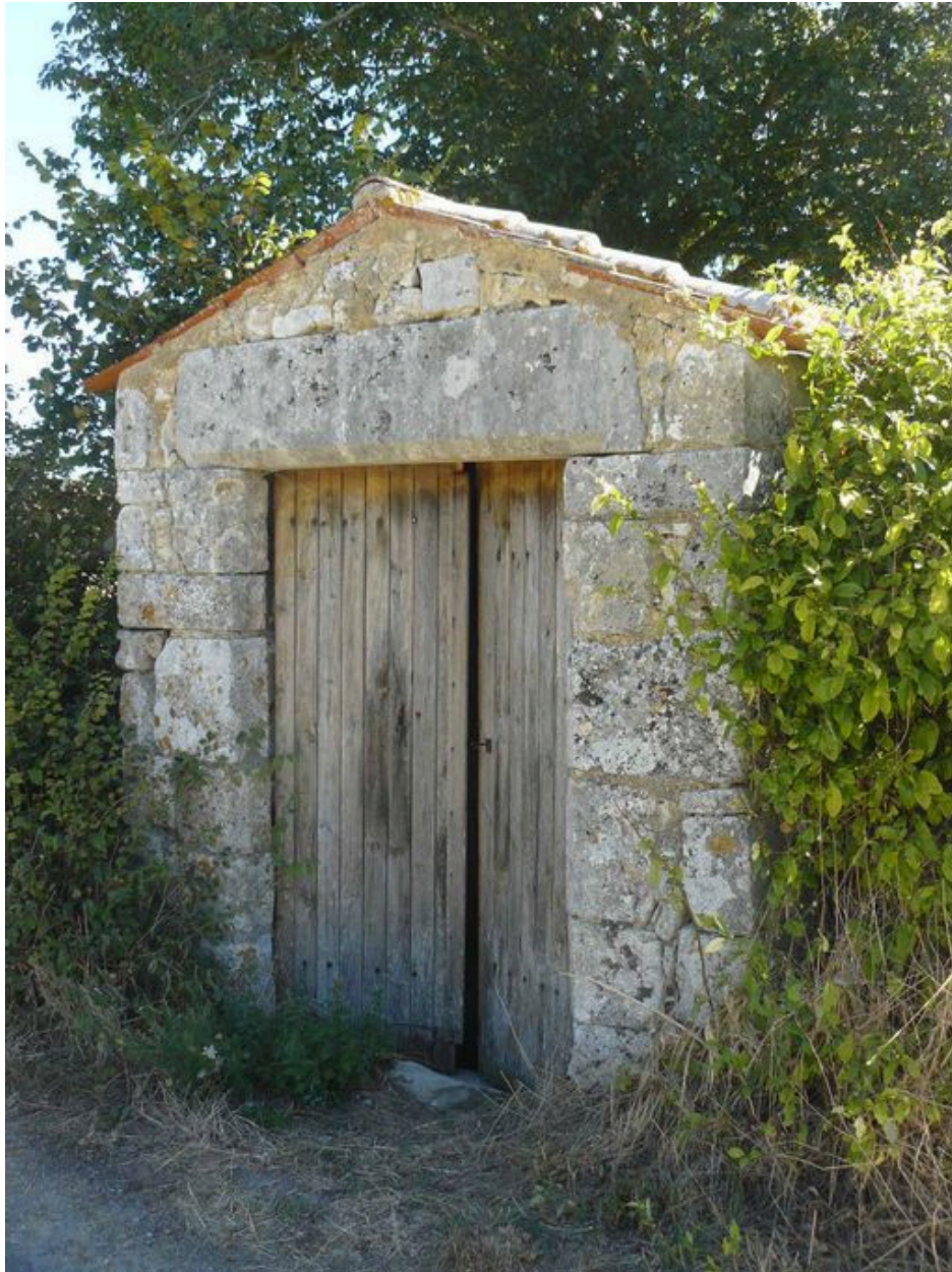
La construction qui abrite l'entrée du souterrain, depuis le sud-ouest.