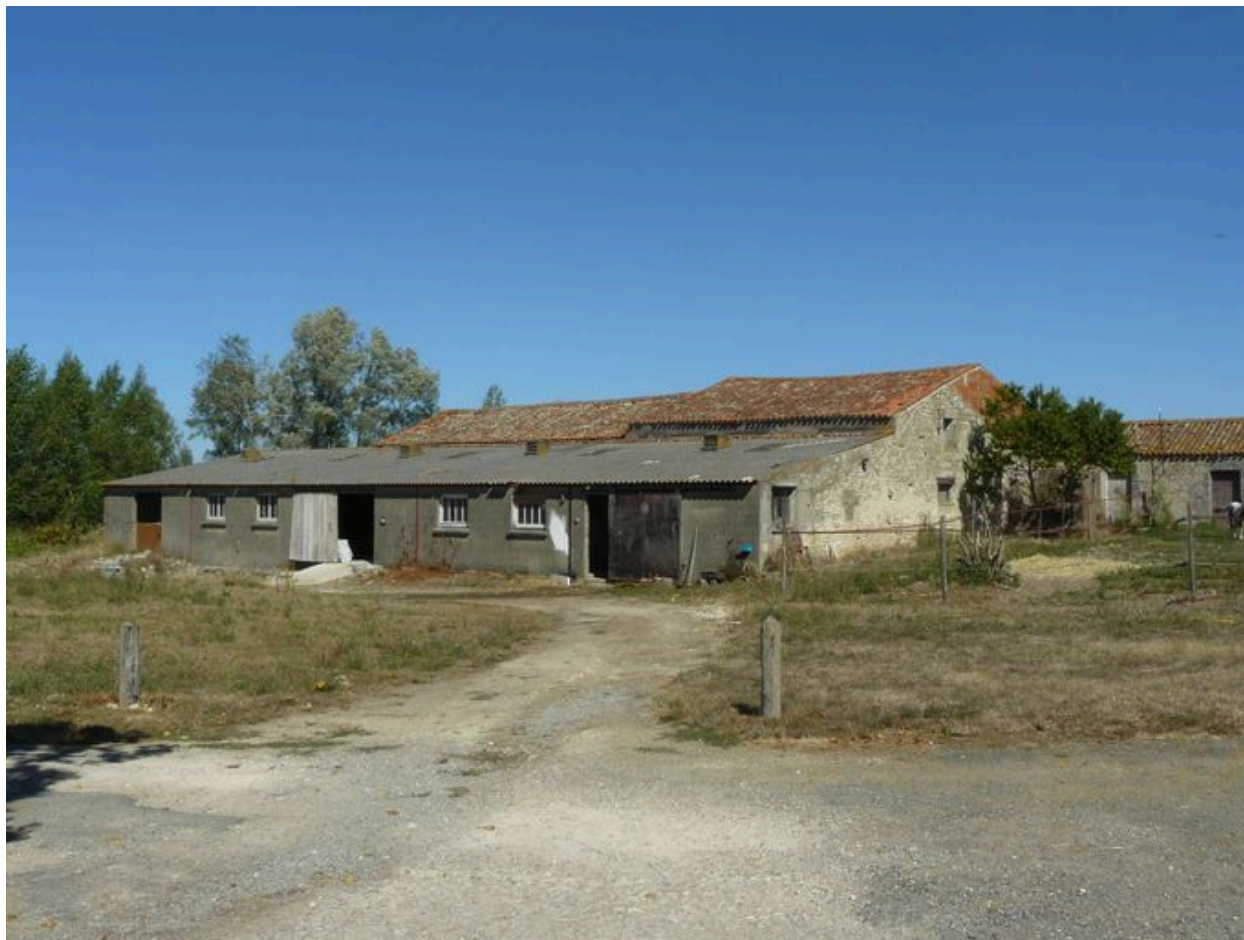
Une vue d'ensemble des dépendances, depuis le sud-est.