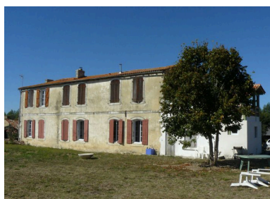
La façade sud-est du logis, depuis le nord-est. IVR54_20091701725NUCA