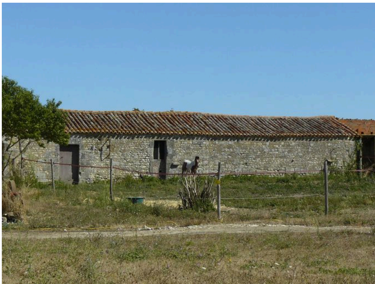
Une dépendance, depuis le sud-est.