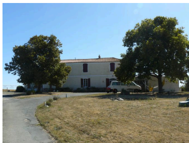
Le logis du Fresne, depuis le nord-ouest.