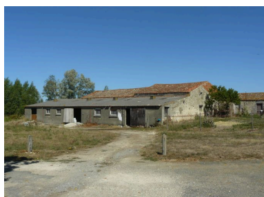
Une vue d'ensemble des dépendances, depuis le sud-est.