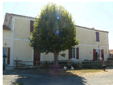
La façade sur cour du logis, depuis le nord-ouest. IVR54_20091701732NUCA