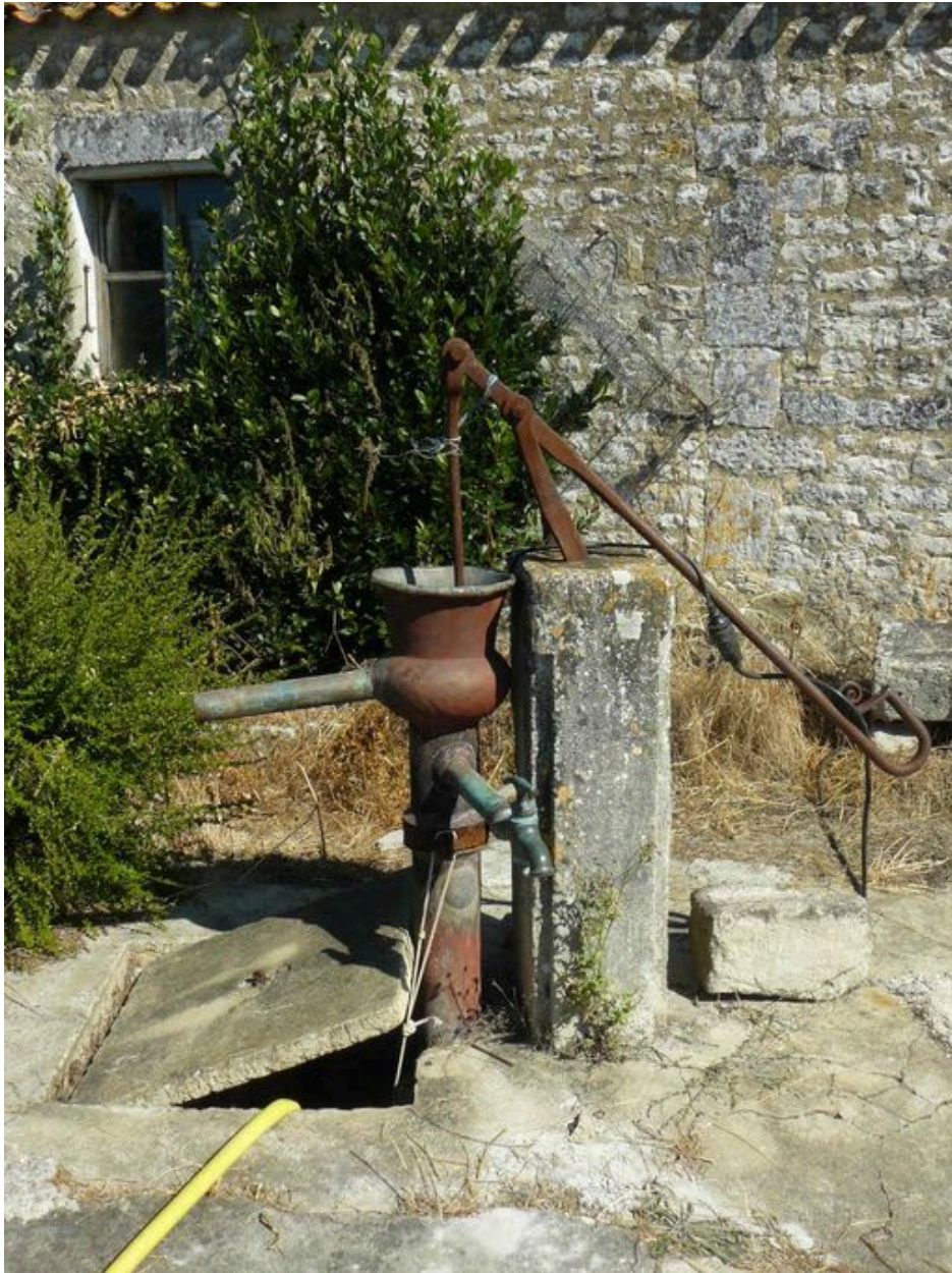
Le puits, depuis le sud-est.