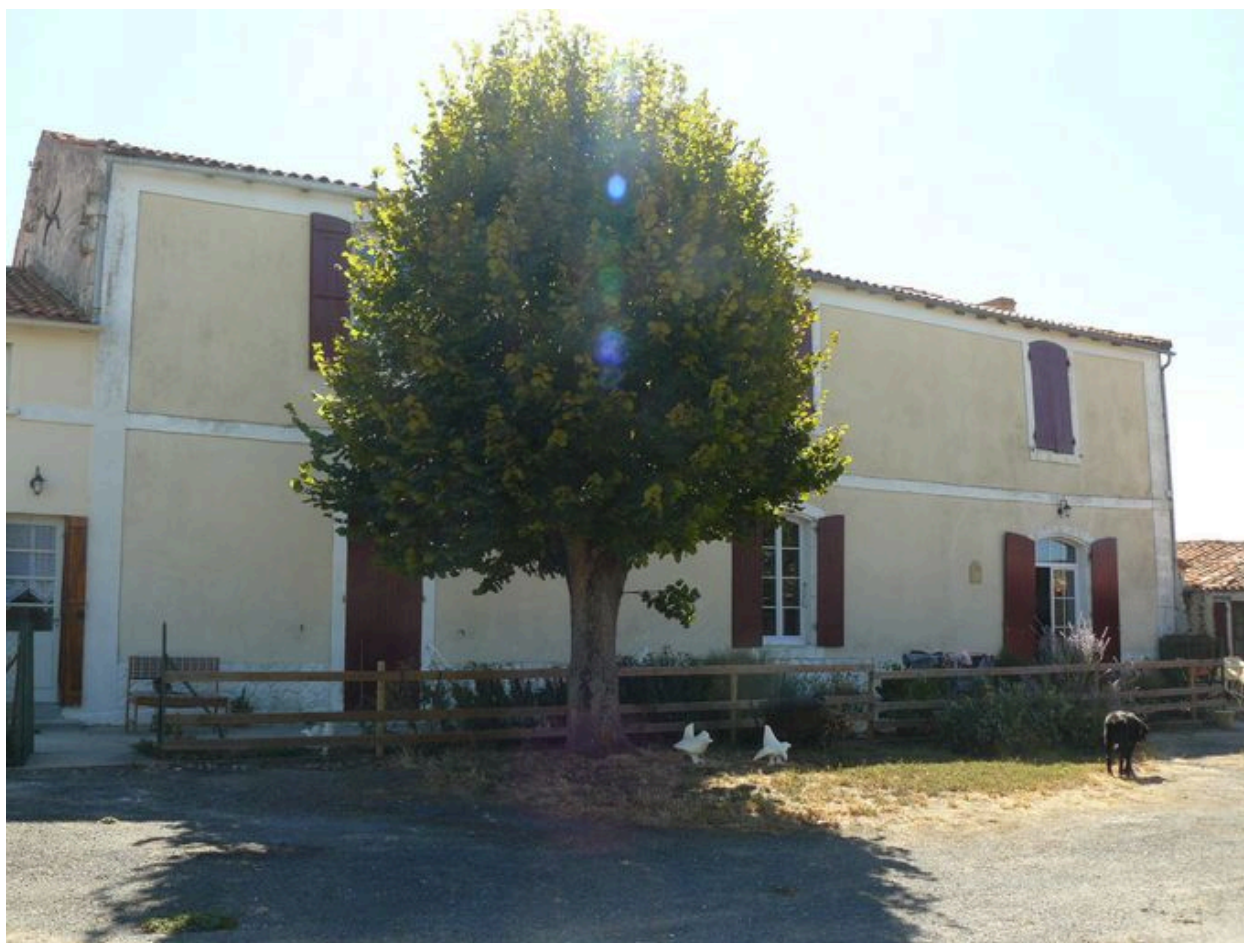
La façade sur cour du logis, depuis le nord-ouest.