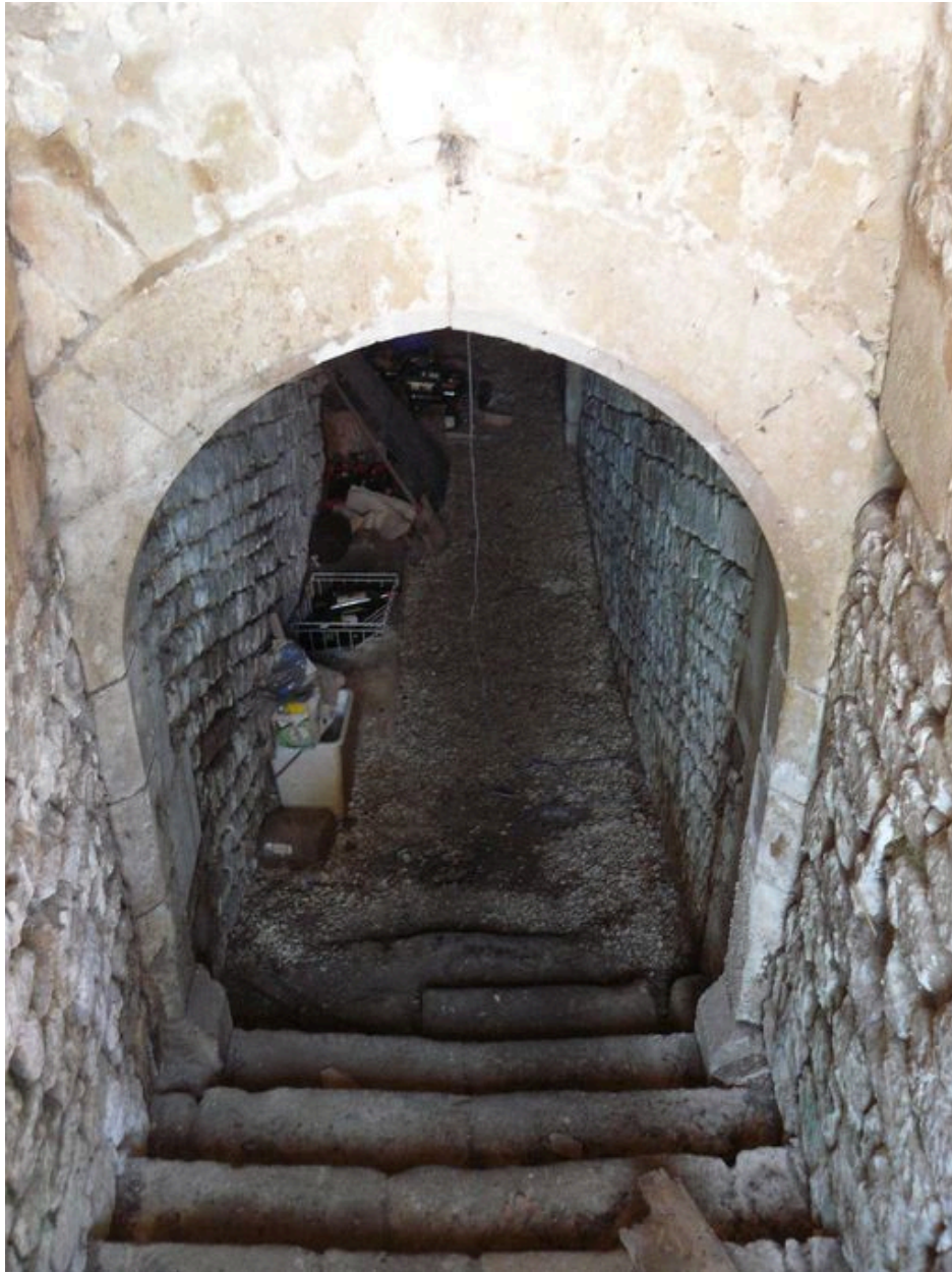
L'entrée du souterrain, depuis le sud-ouest.