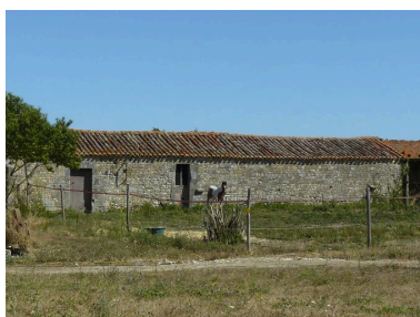
Une dépendance, depuis le sud-est. IVR54_20091701729NUCA