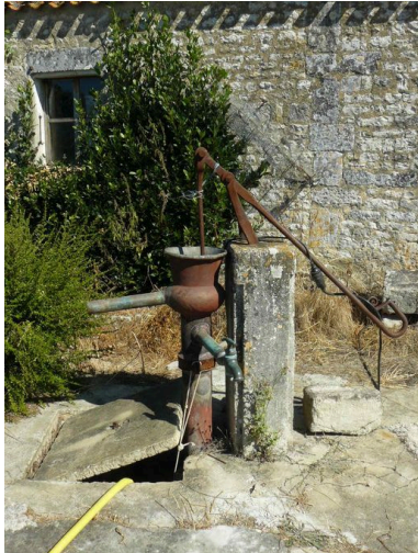
Le puits, depuis le sud-est. IVR54_20091701730NUCA