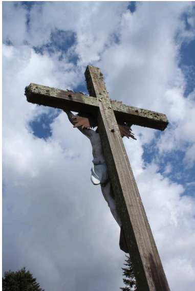
Revers de la croix. IVR72_20124000605NUC2A