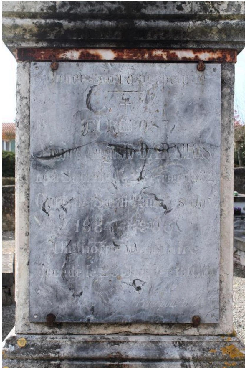
Plaque funéraire sur la face du socle.