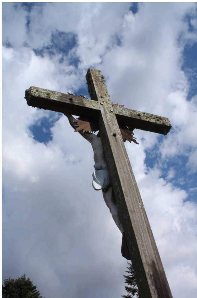
Revers de la croix.