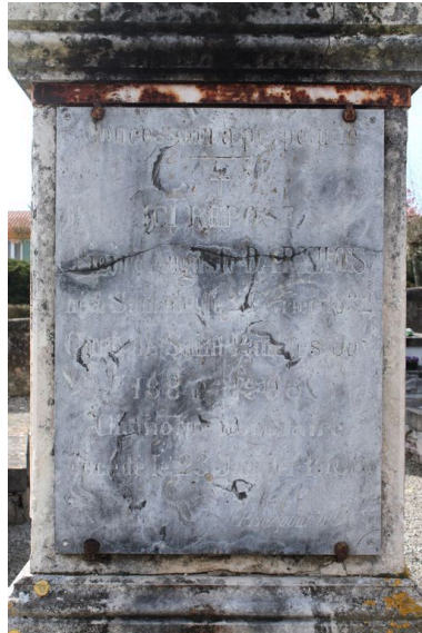
Plaque funéraire sur la face du socle.