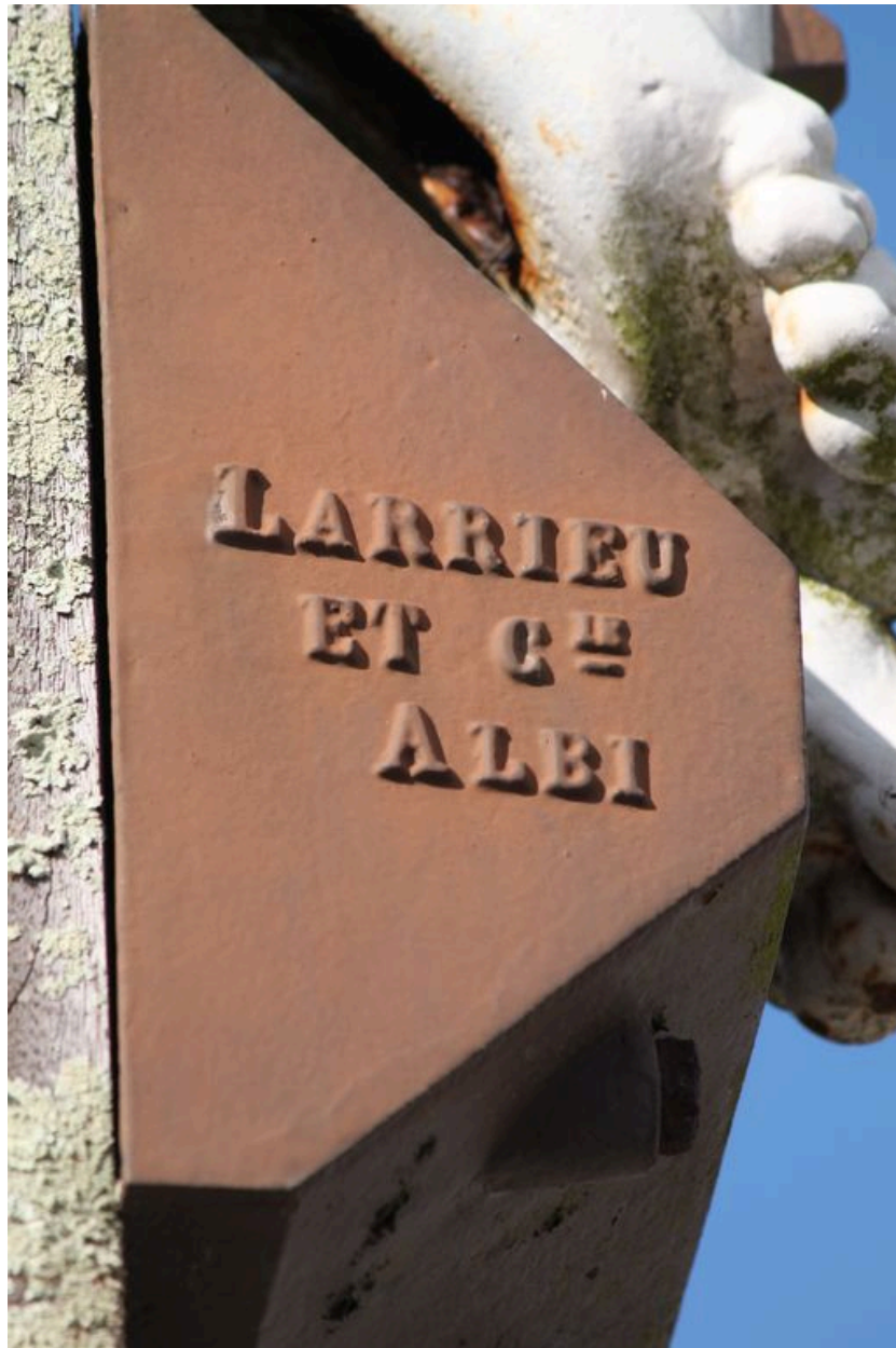
Marque du fondeur Larrieu sur le suppedaneum de la croix.