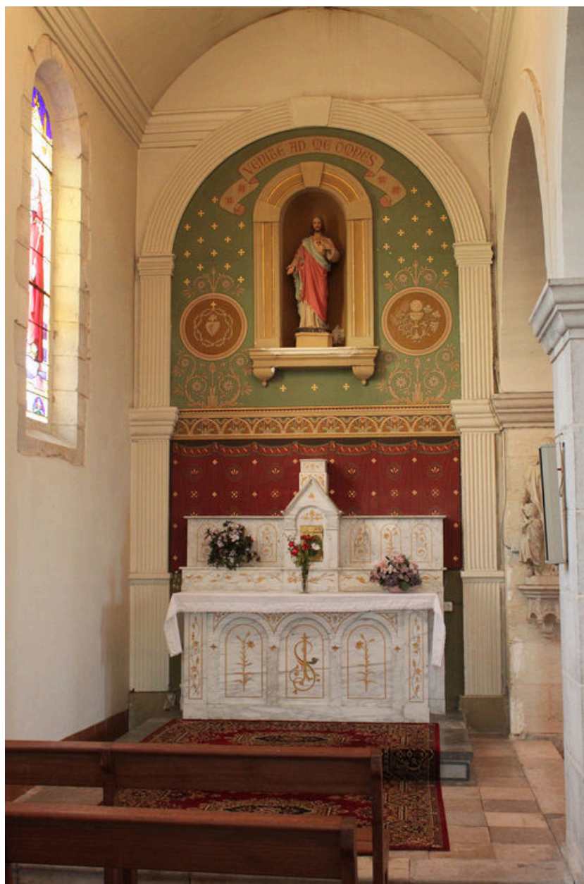
Peinture de l'autel du Sacré-Coeur.