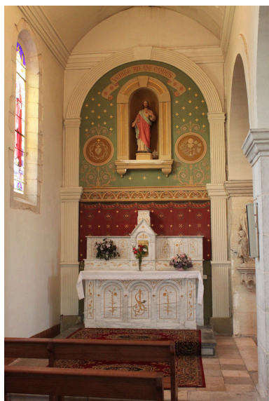
Peinture de l'autel du Sacré-Coeur. IVR72_20114000721NUC2A