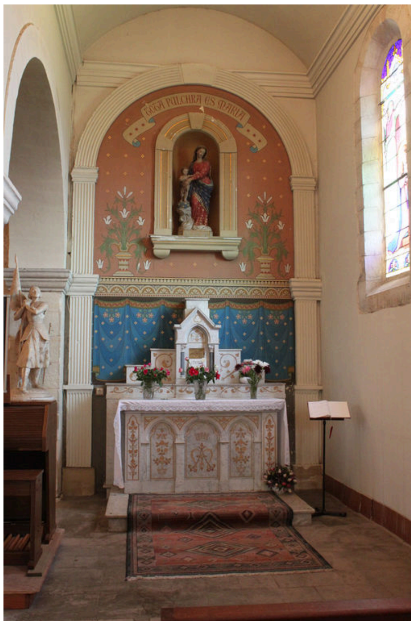
Peinture de l'autel de la Vierge.