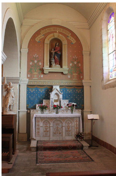
Peinture de l'autel de la Vierge.