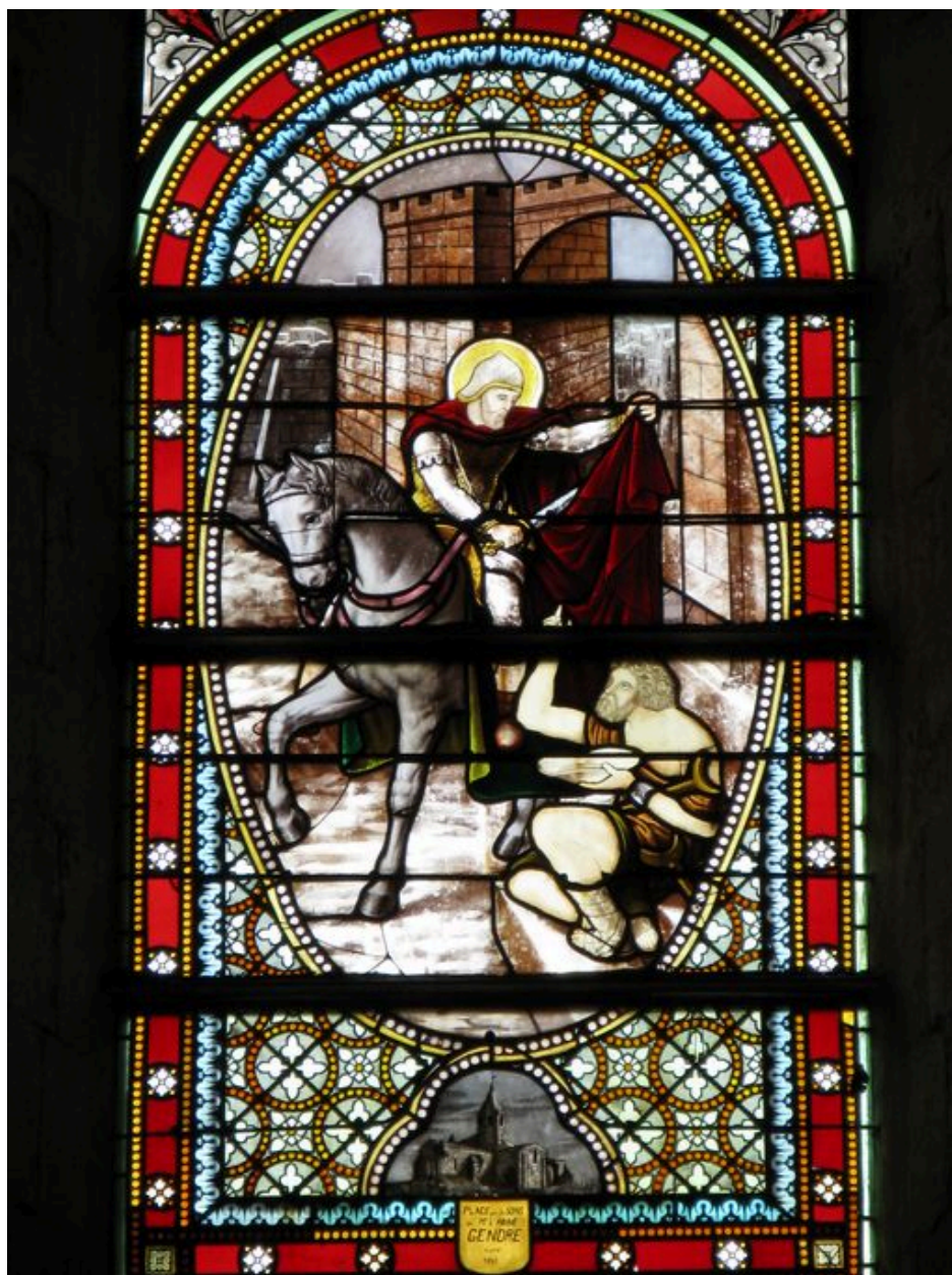
Vue d'ensemble de la verrière.