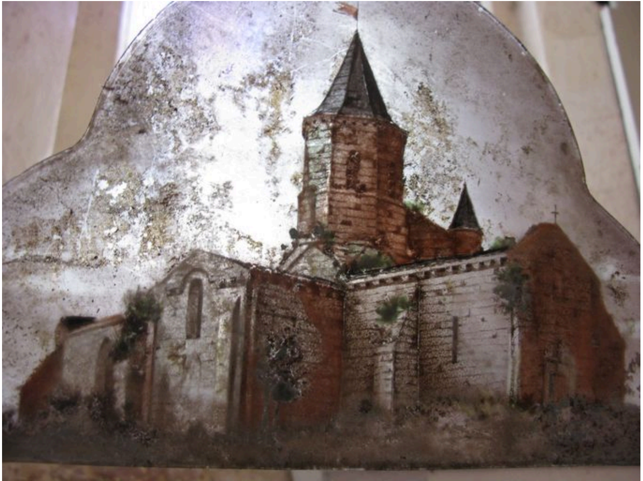
Panneau ancien figurant l'église d'Arces et déposé dans la sacristie.