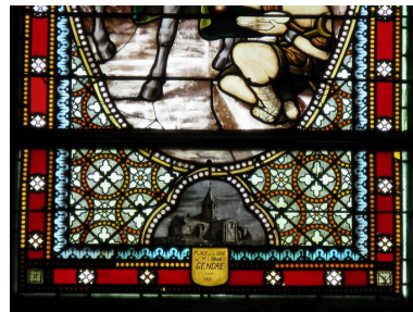
Détail de la partie inférieure.