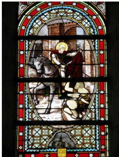
Vue d'ensemble de la verrière. IVR54_20131706391NUCA