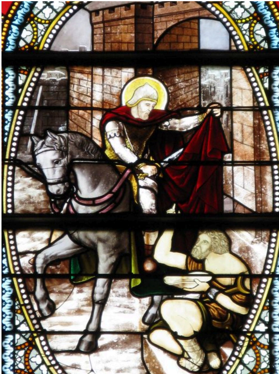
Détail de la Charité de saint Martin.