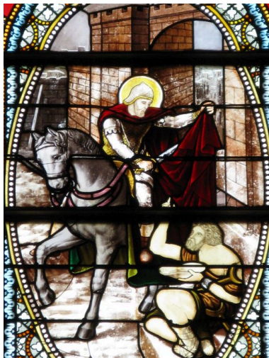
Détail de la Charité de saint Martin.