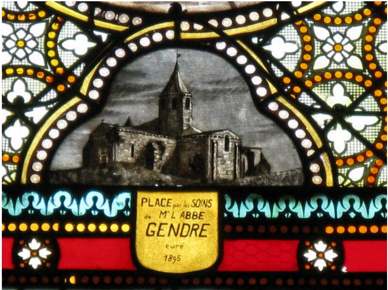
Détail de l'inscription et de l'église d'Arces.