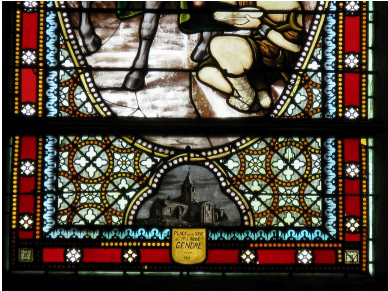
Détail de la partie inférieure.