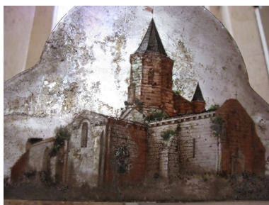
Panneau ancien figurant l'église d'Arces et déposé dans la sacristie.