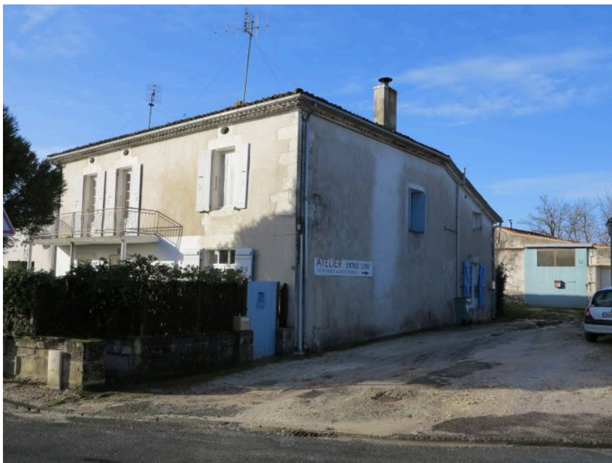
La maison vue depuis le nord-est.