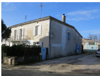
La maison vue depuis le nord-est.