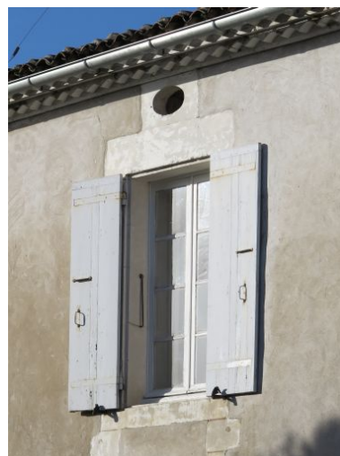
Détail.