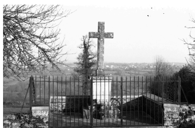
Le monument aux morts du Puy Brévier en 1977. Photographie issue du pré inventaire bénévole de la Creuse (1977-1984).