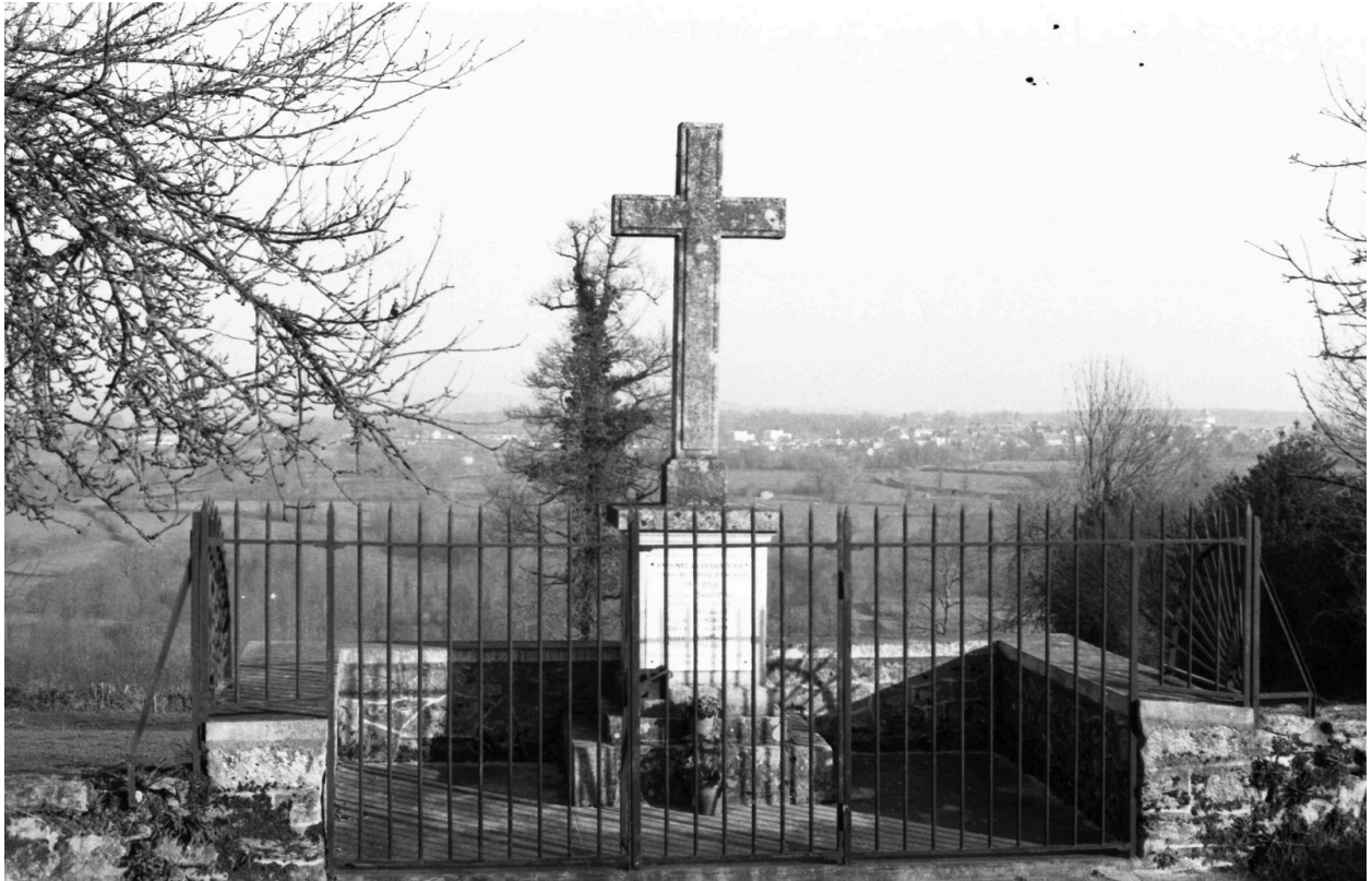
Le monument aux morts du Puy Brévier en 1977. Photographie issue du pré inventaire bénévole de la Creuse (1977-1984).