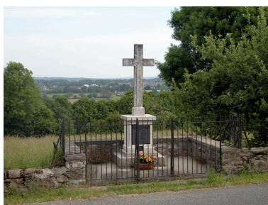
Vue générale du monument aux morts du Puy Brévier.