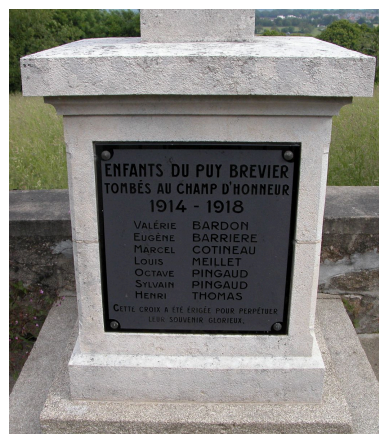
La plaque de verre scellée au piedestal du monument aux morts du Puy Brévier.