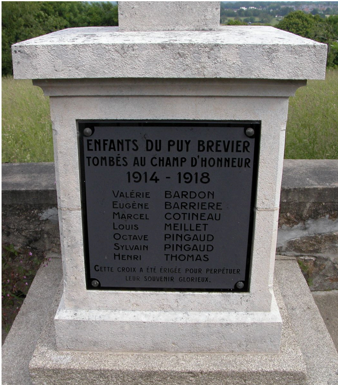
La plaque de verre scellée au piédestal du monument aux morts du Puy Brevier.