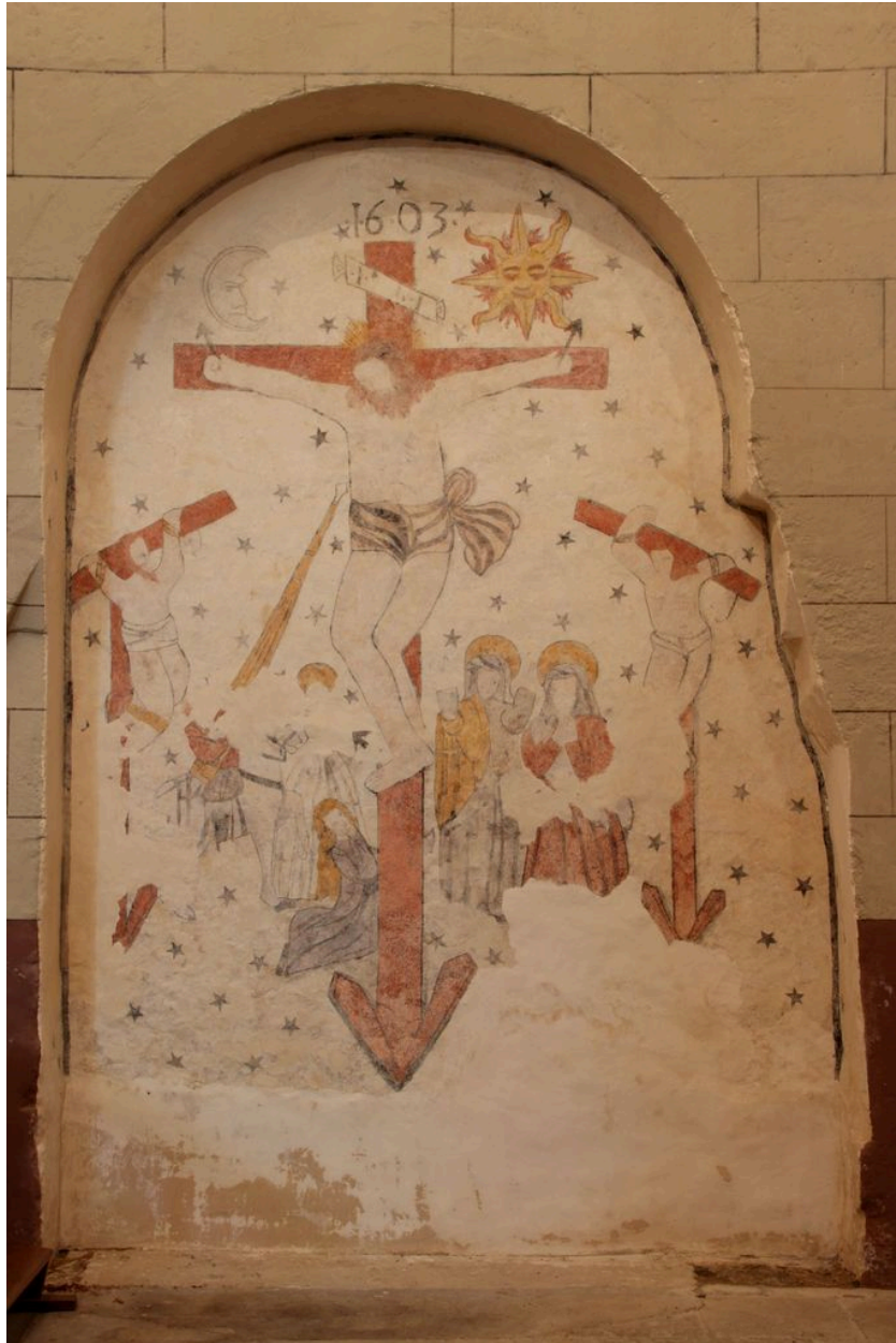
Peinture du mur sud du vaisseau principal : Calvaire.