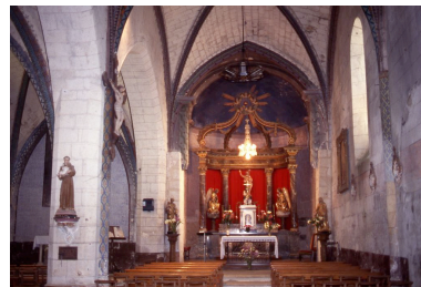
Vue intérieure de l'église en 1992, avant restauration et suppression des peintures de 1868 dans le chœur. IVR72_20144001747NUC1A