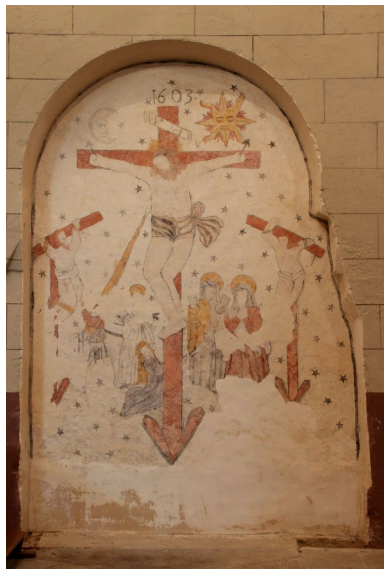
Peinture du mur sud du vaisseau principal : Calvaire. IVR72_20144001625NUC2A