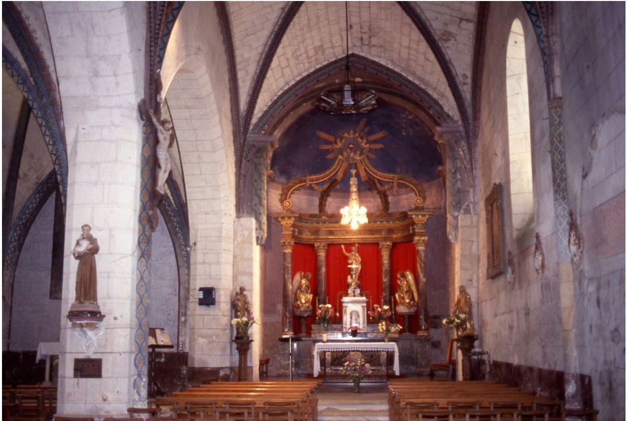
Vue intérieure de l'église en 1992, avant restauration et suppression des peintures de 1868 dans le choeur.