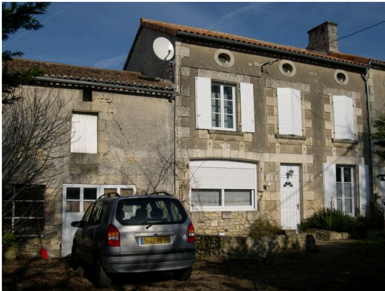
Le logis vu depuis le sud ; à gauche l'ancien atelier de charron.