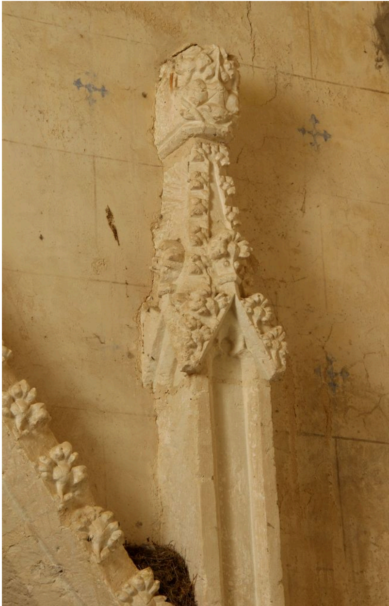
Détail du pinacle de droite.