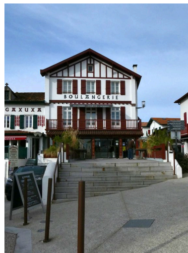
Vue d'ensemble depuis la rue (est). IVR72_20206401662NUC2A