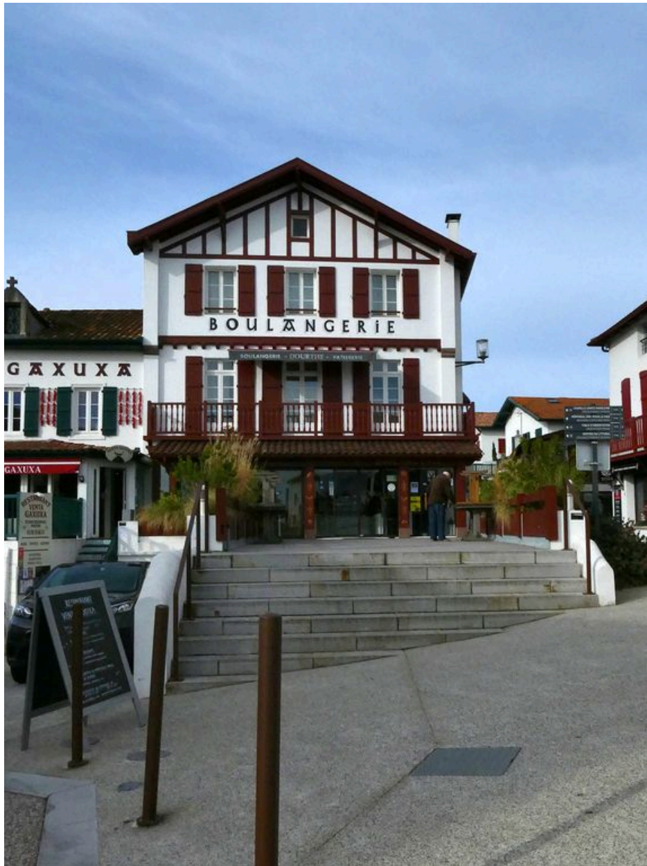
Vue d'ensemble depuis la rue (est).