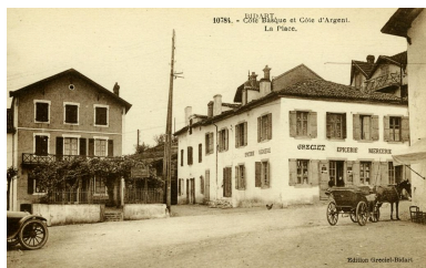
"Côte Basque et Côte d'Argent, La Place", vue de l'auberge depuis la place, carte postale, 2e quart du 20e siècle. IVR72_20196403069NUC1A