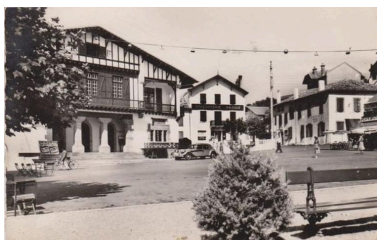
Vue de la boulangerie depuis la place, carte postale, 3e quart 20e siècle.