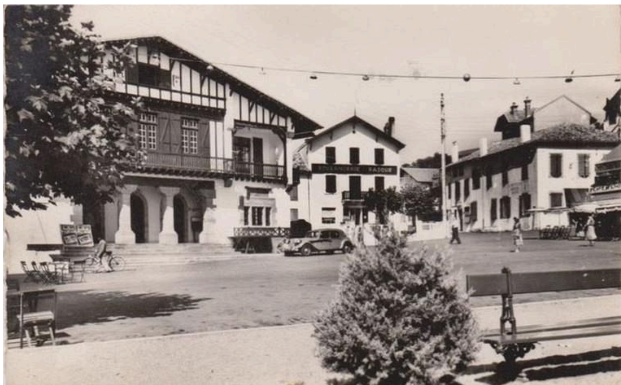
Vue de la boulangerie depuis la place, carte postale, 3e quart 20e siècle.