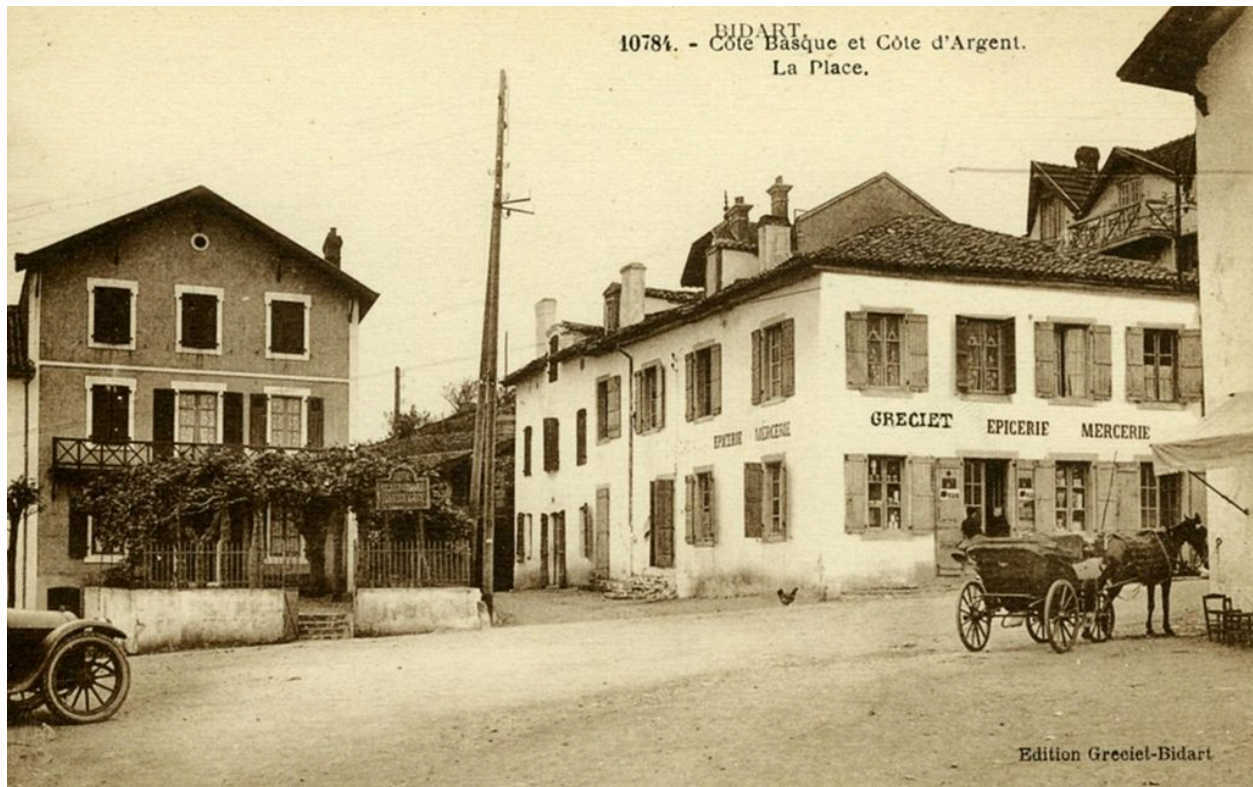
"Côte Basque et Côte d'Argent, La Place", vue de l'auberge depuis la place, carte postale, 2e quart du 20e siècle.