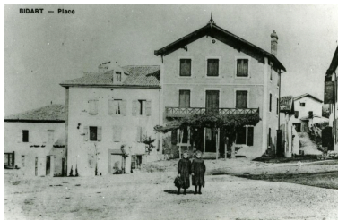
Vue d'ensemble depuis la place, carte postale, 1er quart du 20e siècle. IVR72_20196403070NUC1A