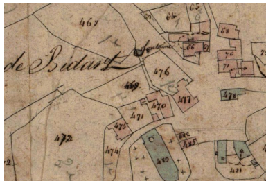
Cadastre ancien de 1831 : détail de la place, parcelle 67. IVR72_20186401981NUC1A