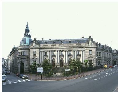
Vue de la façade de la préfecture de Limoges. IVR74_19988700761VA