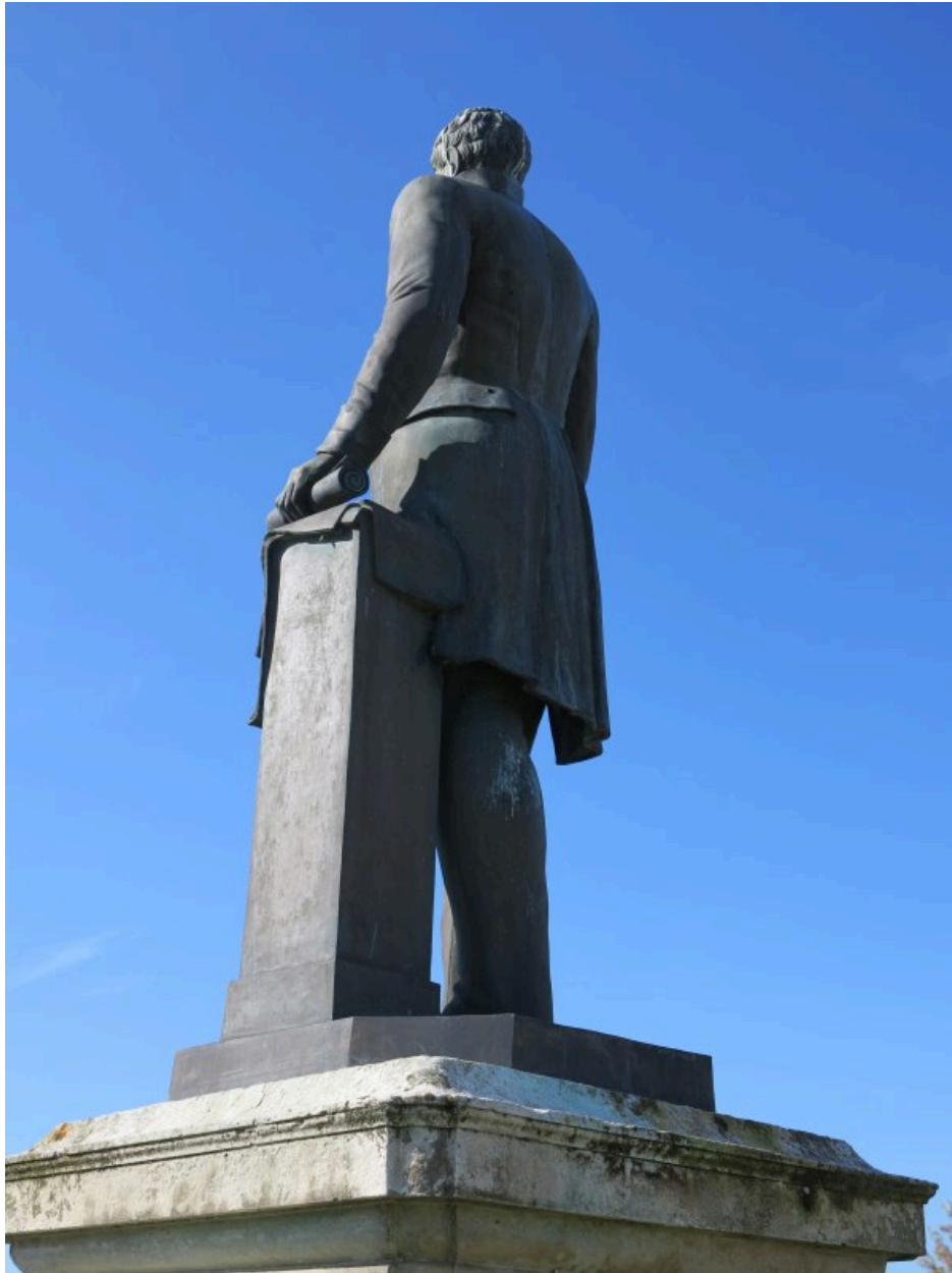
La statue vue de trois quarts arrière.