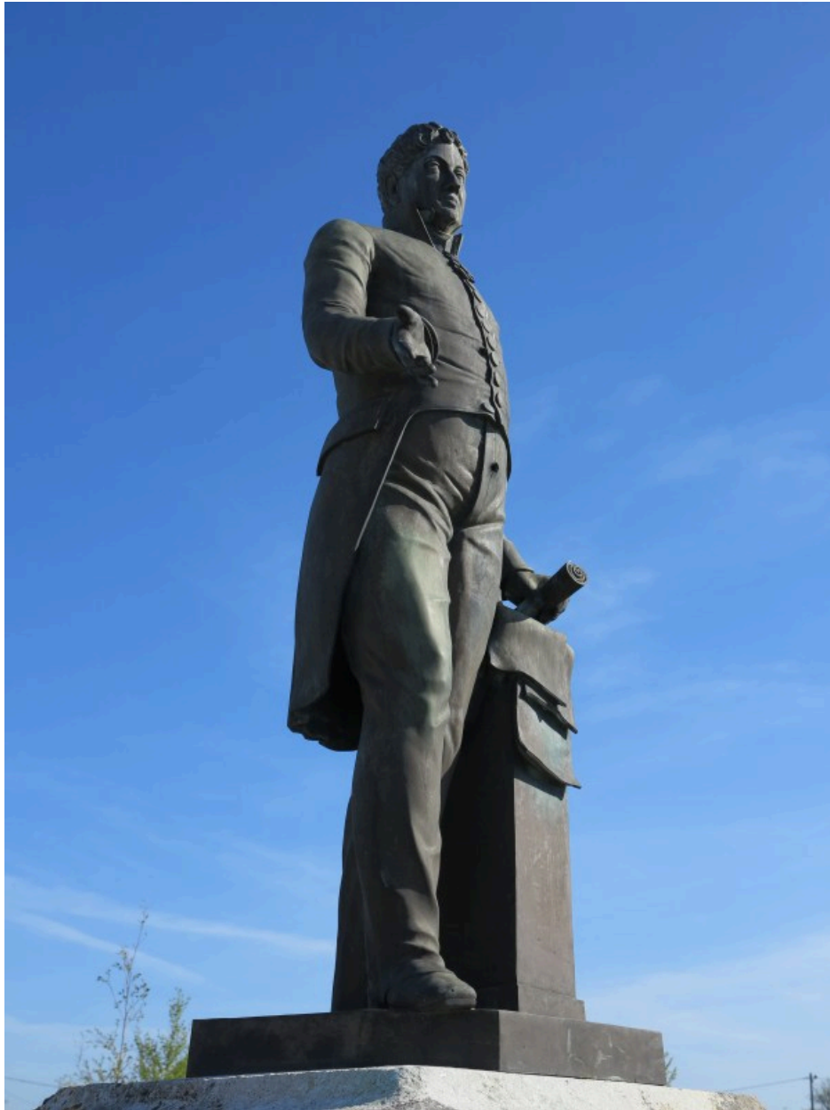
La statue vue de trois quarts avant.