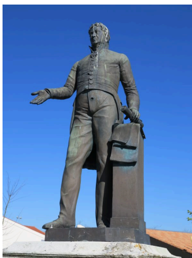
Vue avant de la statue. IVR54_20171706790NUCA