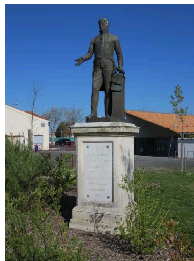
La statue et son socle vus depuis le sud.