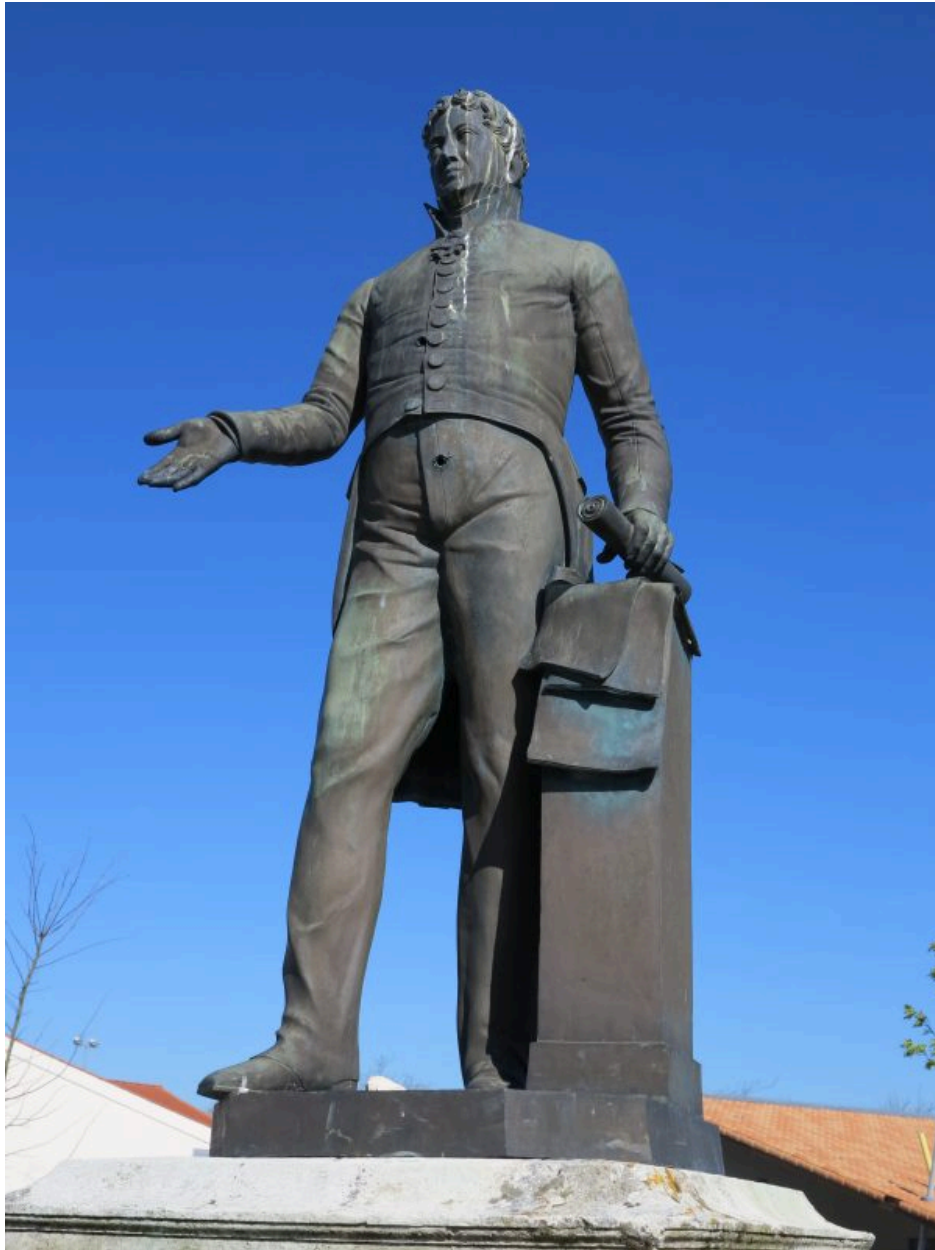
Vue avant de la statue.