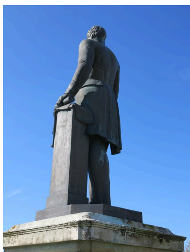
La statue vue de trois quarts arrière.