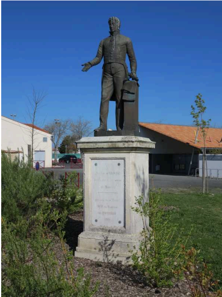
La statue et son socle vus depuis le sud.