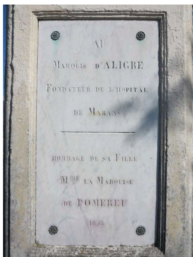
L'inscription sur le socle.