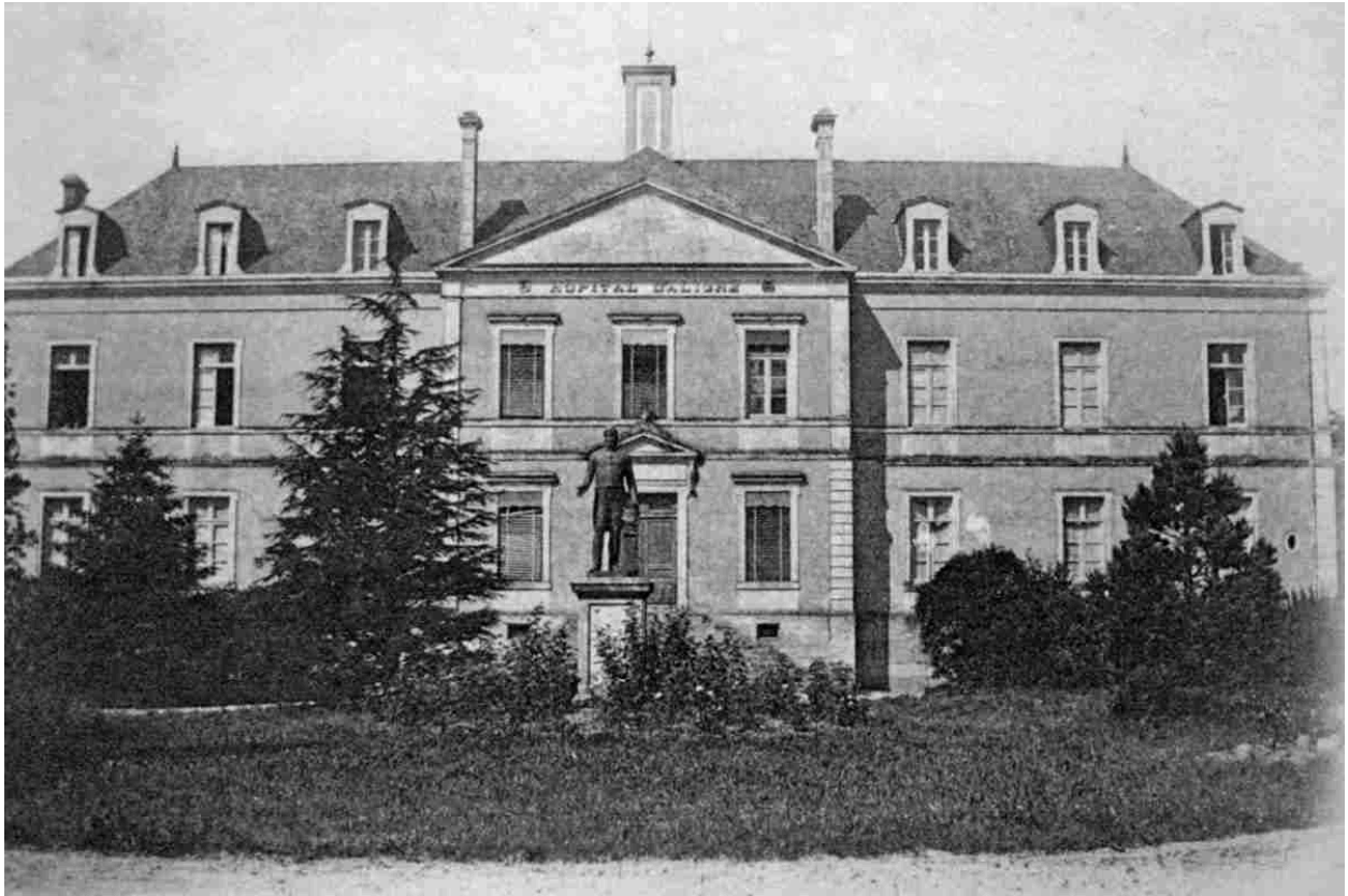
La statue du marquis d'Aligre devant l'ancien hôpital vers 1900.