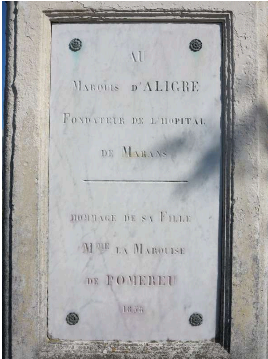
L'inscription sur le socle.