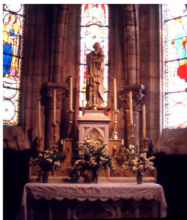
Ensemble (en 1992). IVR72_20164001259NUC1A