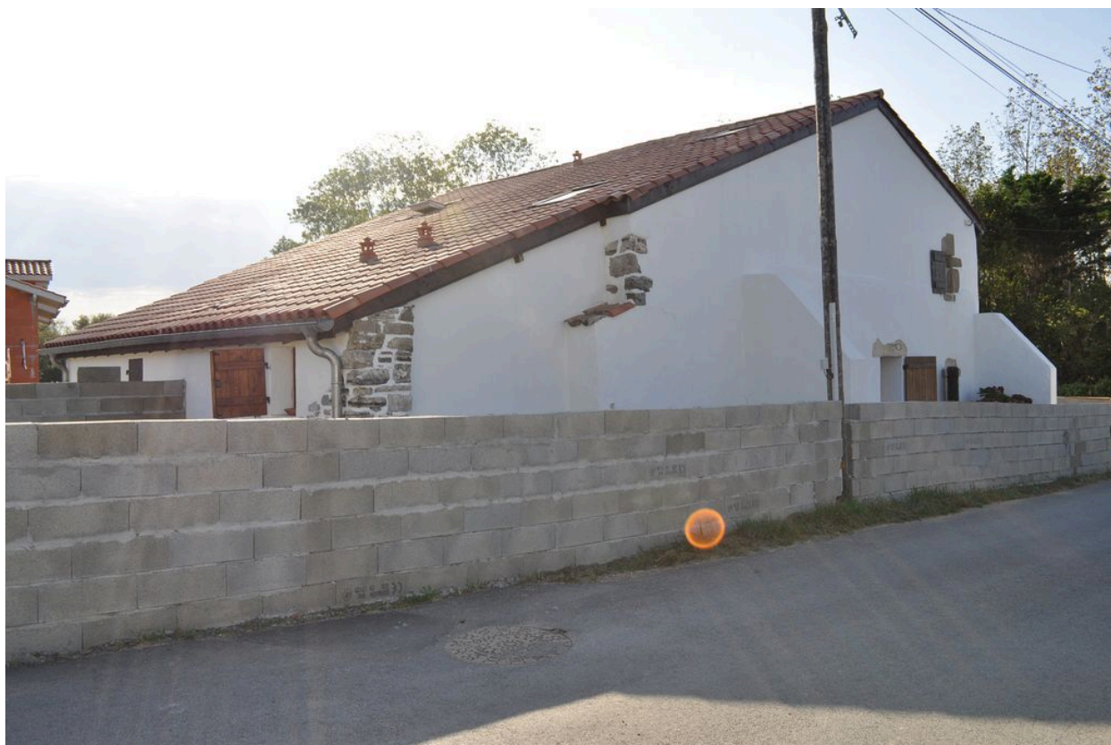
Maison Capera, chemin Capera, façade ouest.