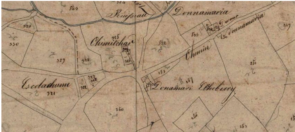
Le hameau Dona Maria, plan cadastral de 1831, Section D.