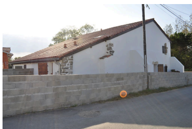
Maison Capera, chemin Capera, façade ouest.