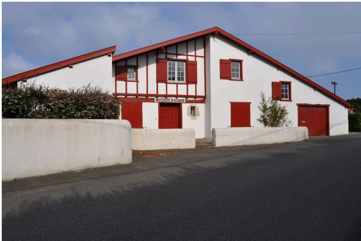
Maison Escolachume, rue Eskola, façade est.