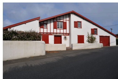
Maison Escolachume, rue Eskola, façade est. IVR72_20196403977NUC2A