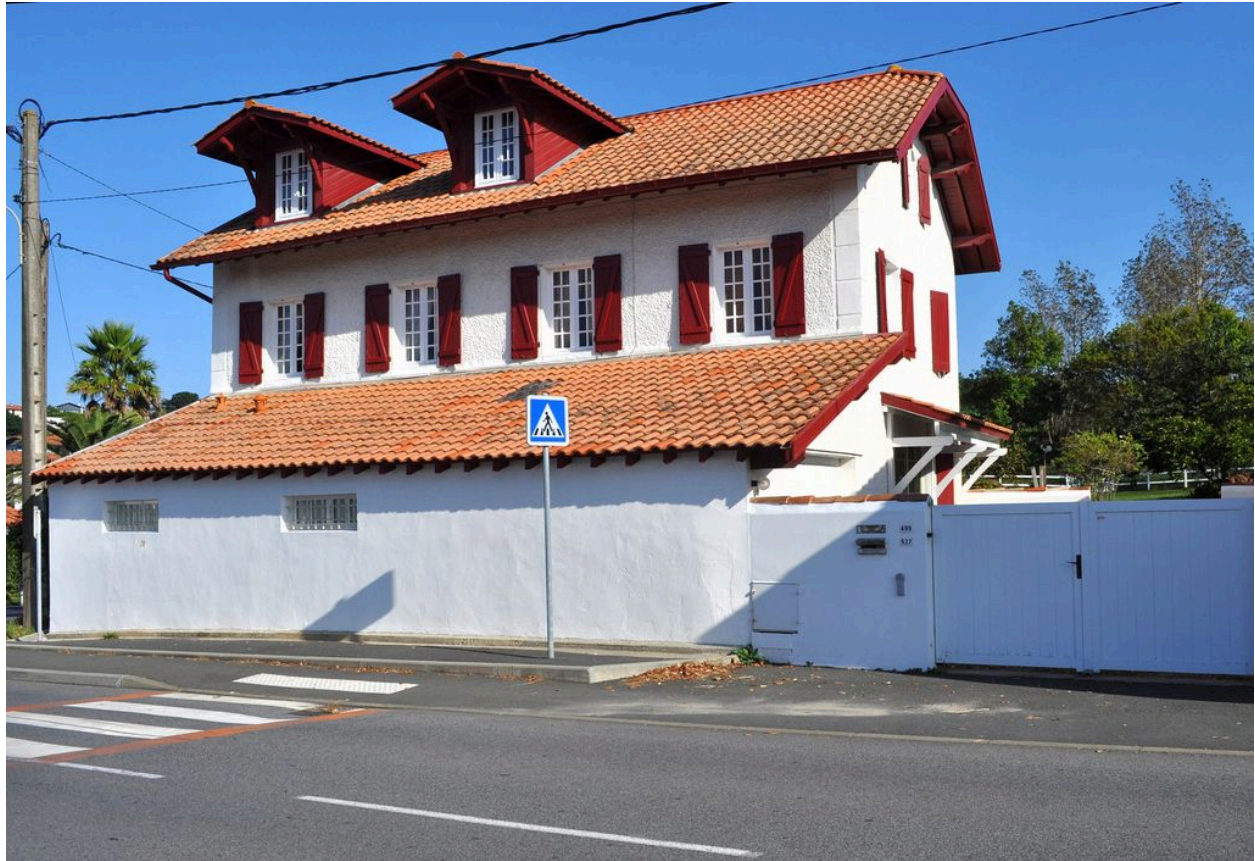
Maison Donamari-etcheberria, vue d'ensemble depuis la rue Berrua.