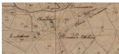
Le hameau Dona Maria, plan cadastral de 1831, Section D.

IVR72_20196403978NUC1A