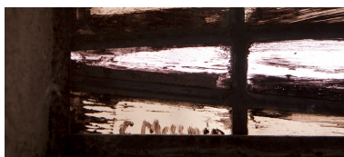
Baie 0 : détail de la signature.