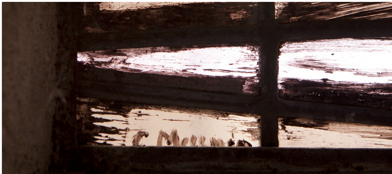
Baie 0 : détail de la signature.