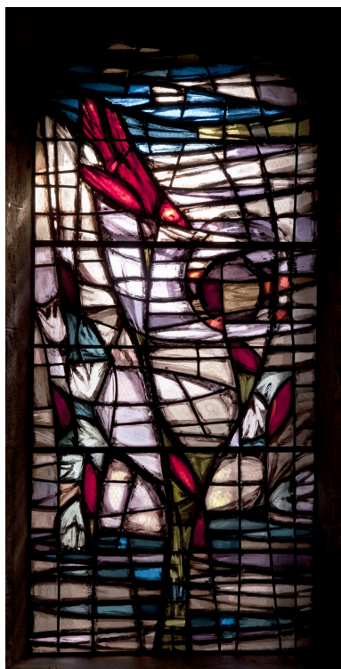
Baie 0 : Verrière figurée. IVR74_20141900800NUCA