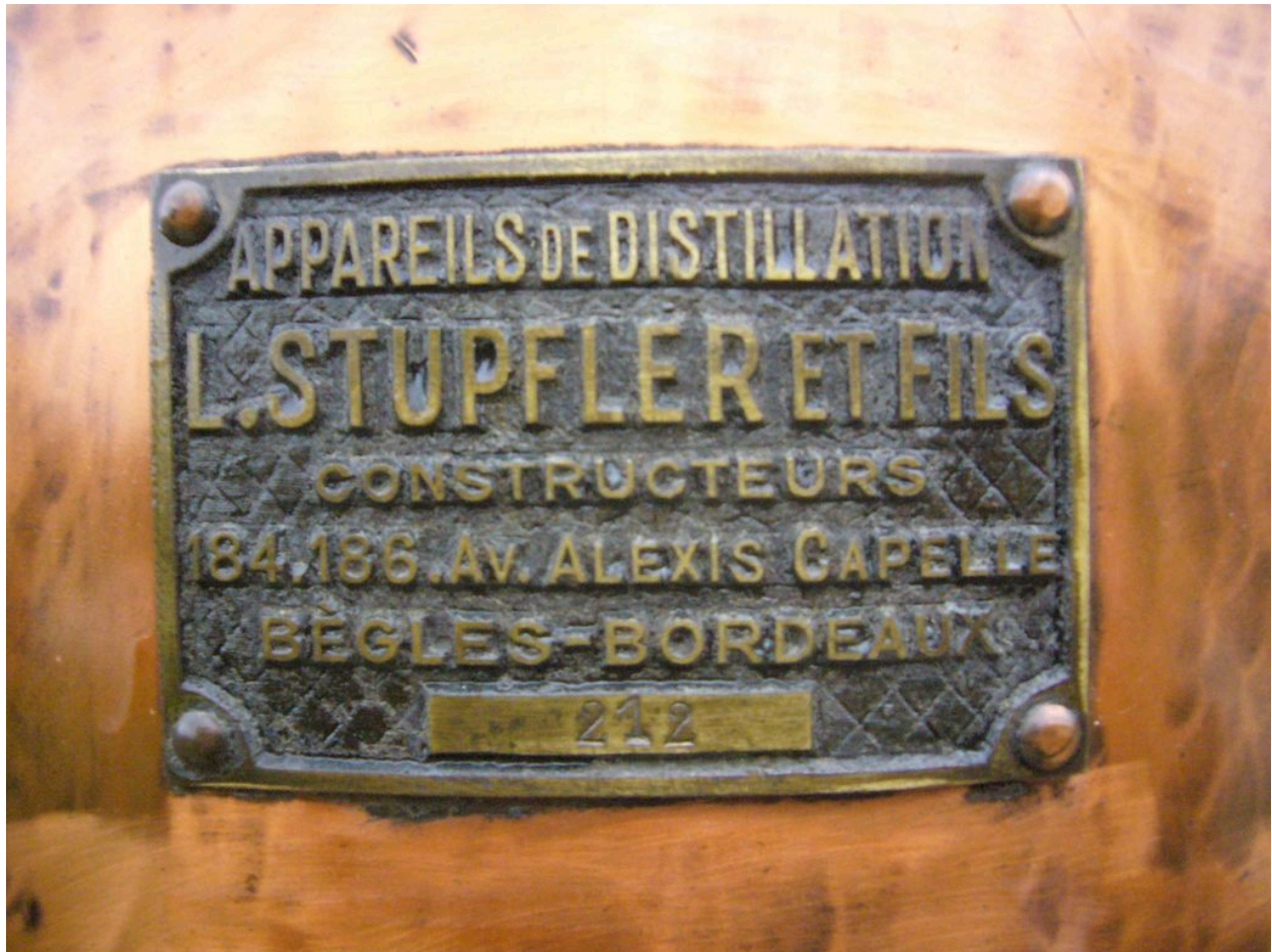
Détail : plaque portant le nom du fabriquant : L. STUPFLER ET FILS, à Bordeaux.