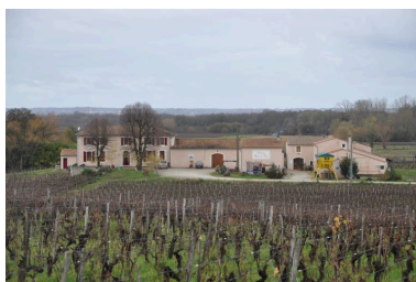
Vue d'ensemble. IVR72_20123300582NUCA