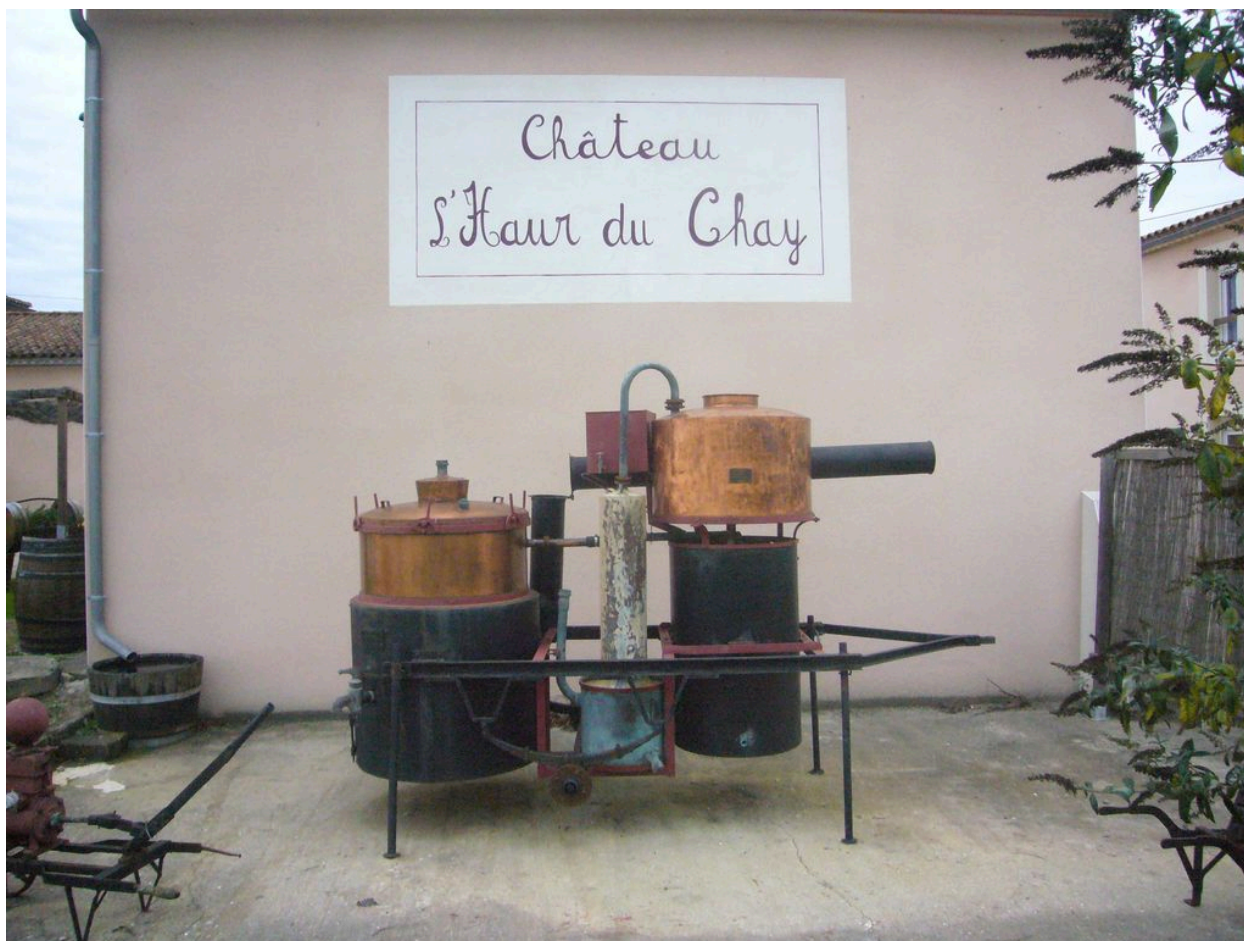
Appareil de distillation.