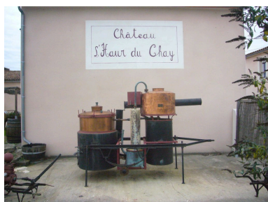
Appareil de distillation. IVR72_20153300019NUC2A