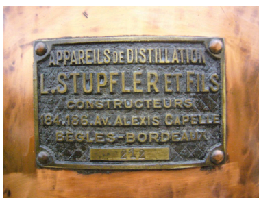
Détail : plaque portant le nom du fabriquant : L. STUPFLER ET FILS, à Bordeaux.