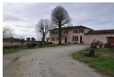
Logis principal. IVR72_20123300581NUCA