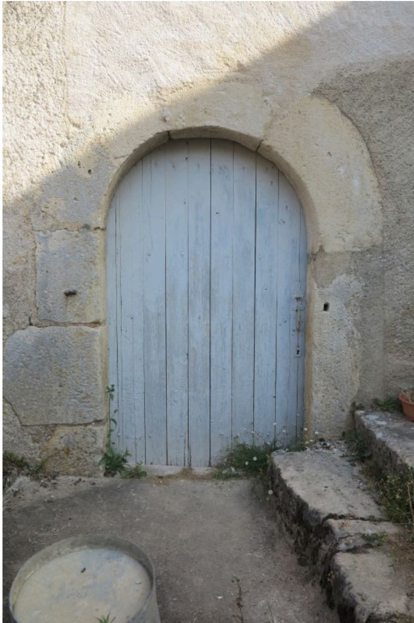
Pignon sud, porte couverte en plein cintre donnant accès à l'étage de soubassement.