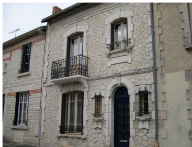
Elévation antérieure. IVR54_20041743361NUCA