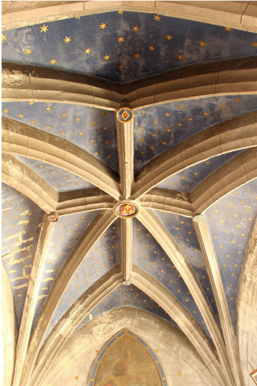
Voûte de la deuxième travée.