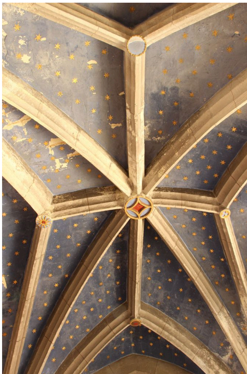
Voûte de la première travée.