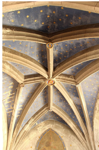
Voûte de la deuxième travée.