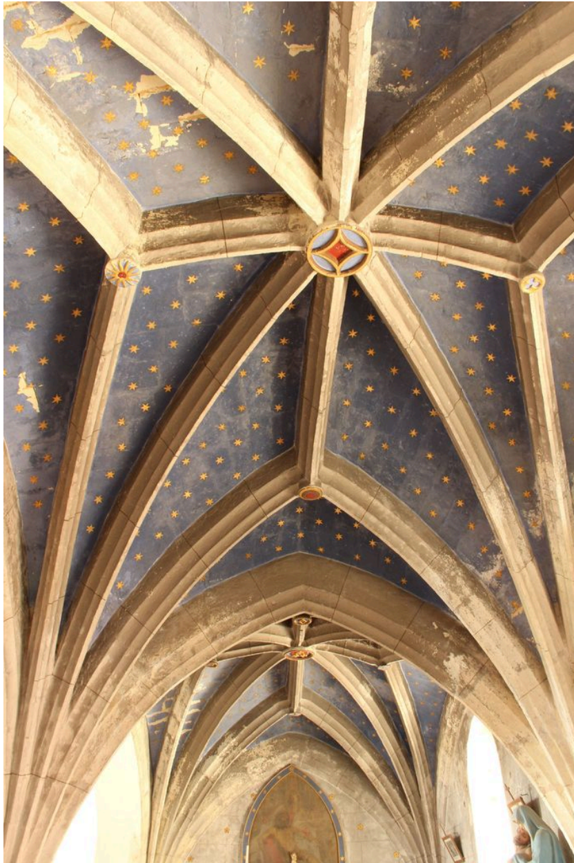
Vue d'ensemble de la voûte depuis l'ouest.