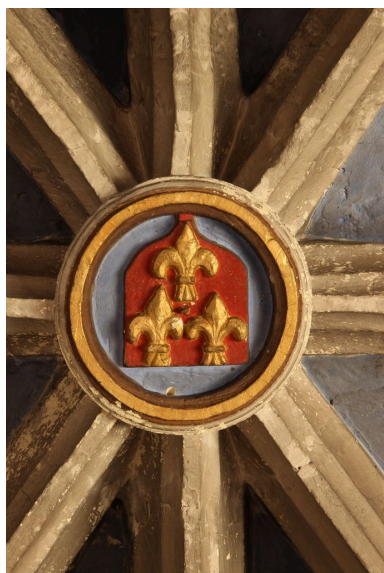
Clef centrale de la deuxième travée.