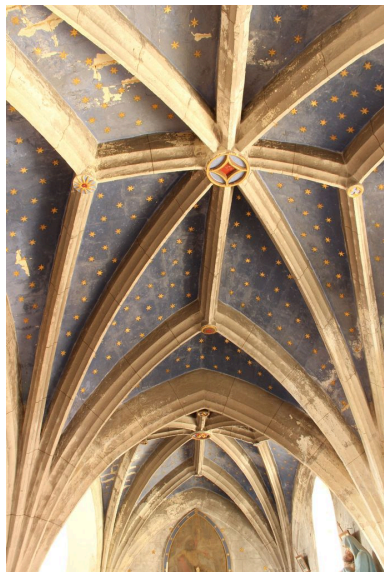
Vue d'ensemble de la voûte depuis l'ouest.