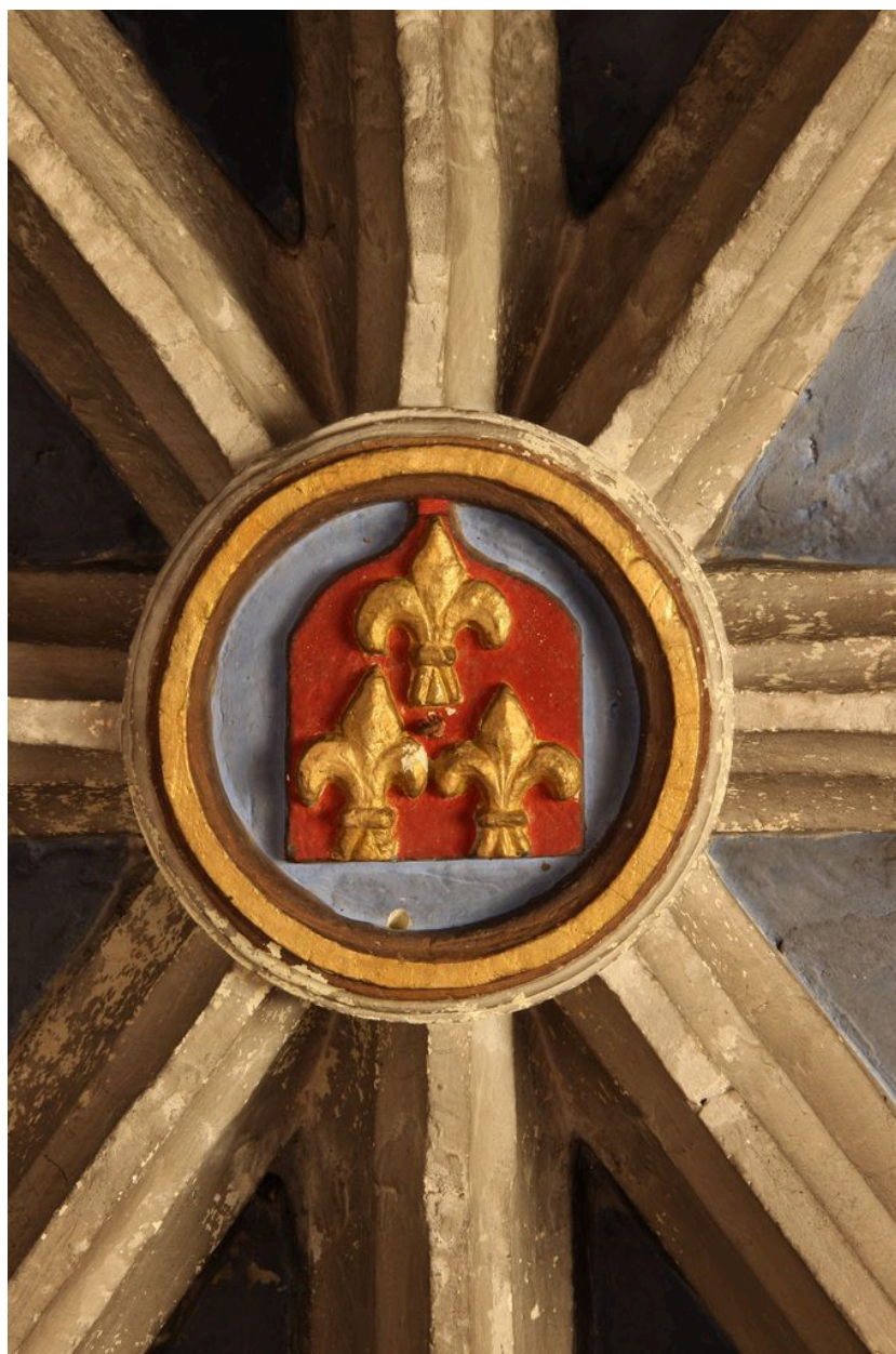
Clef centrale de la deuxième travée.