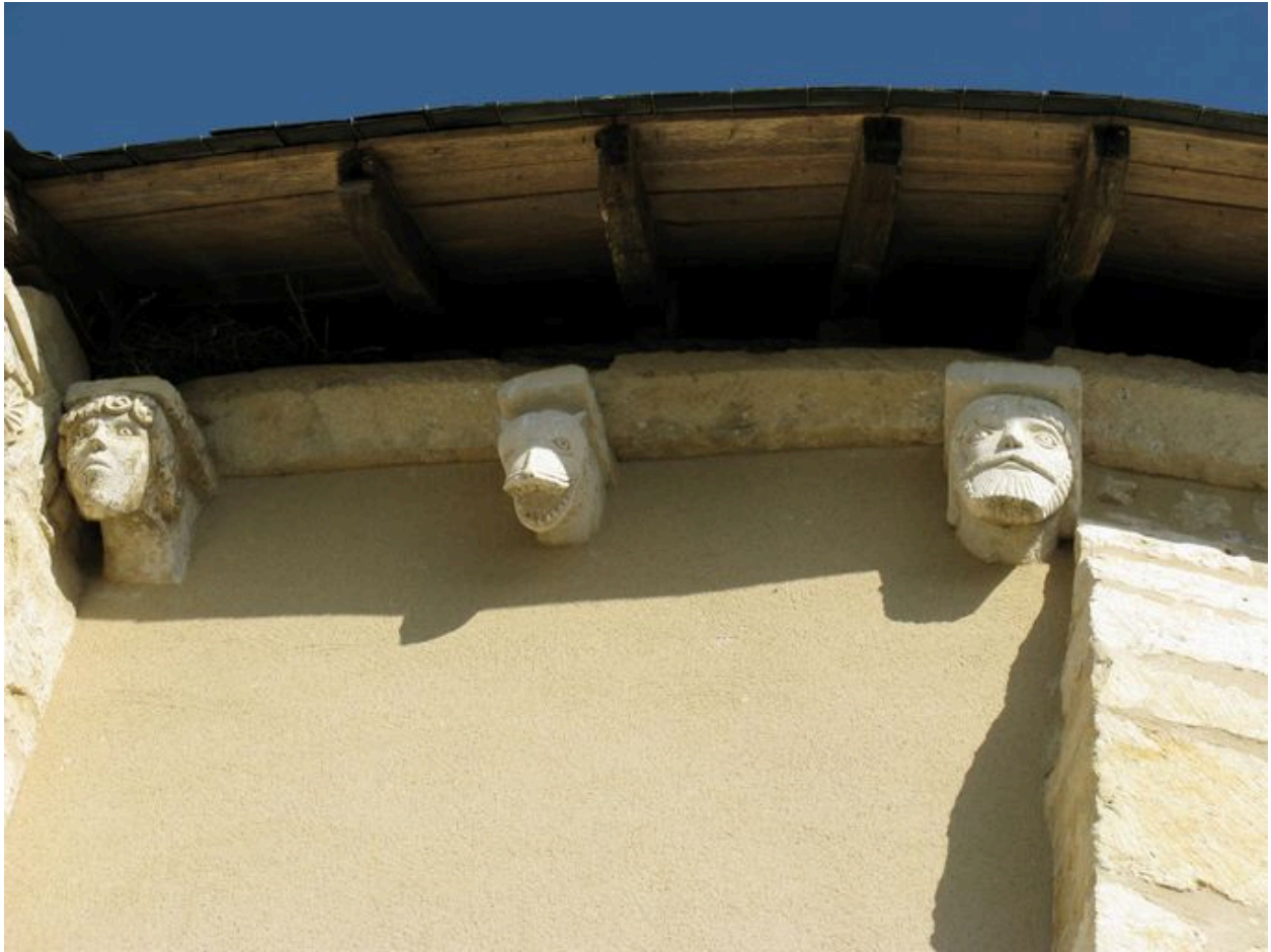
Abside, élévation sud, modillons : modillons 1 à 3.