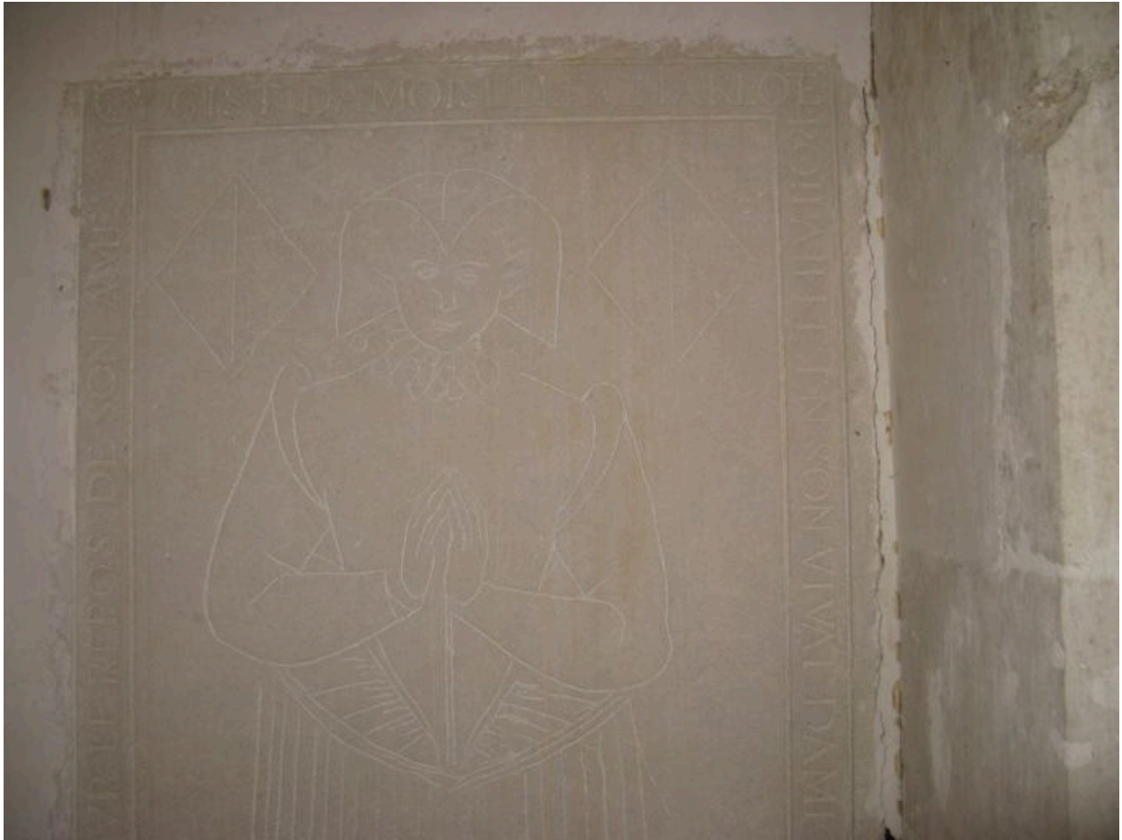
Chapelle nord, mur est : dalle funéraire de la demoiselle de la Baumière, détail de la tête.