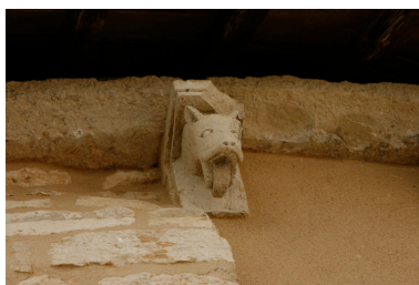
Abside, élévation sud-est, quatrième modillon : tête de chien, vu de trois-quarts.