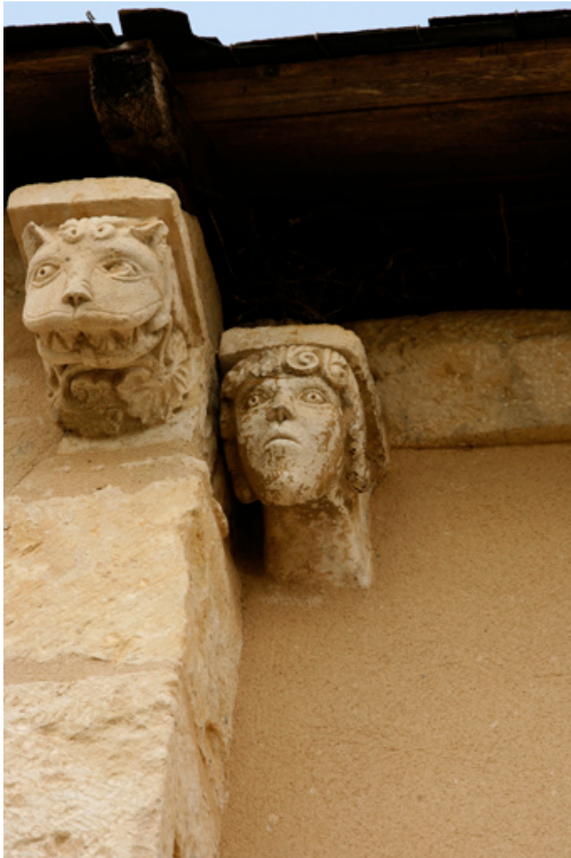
Abside, élévation sud, modillons : dernier modillon de la travée droite (tête de lion) et premier modillon de l'abside (tête humaine).