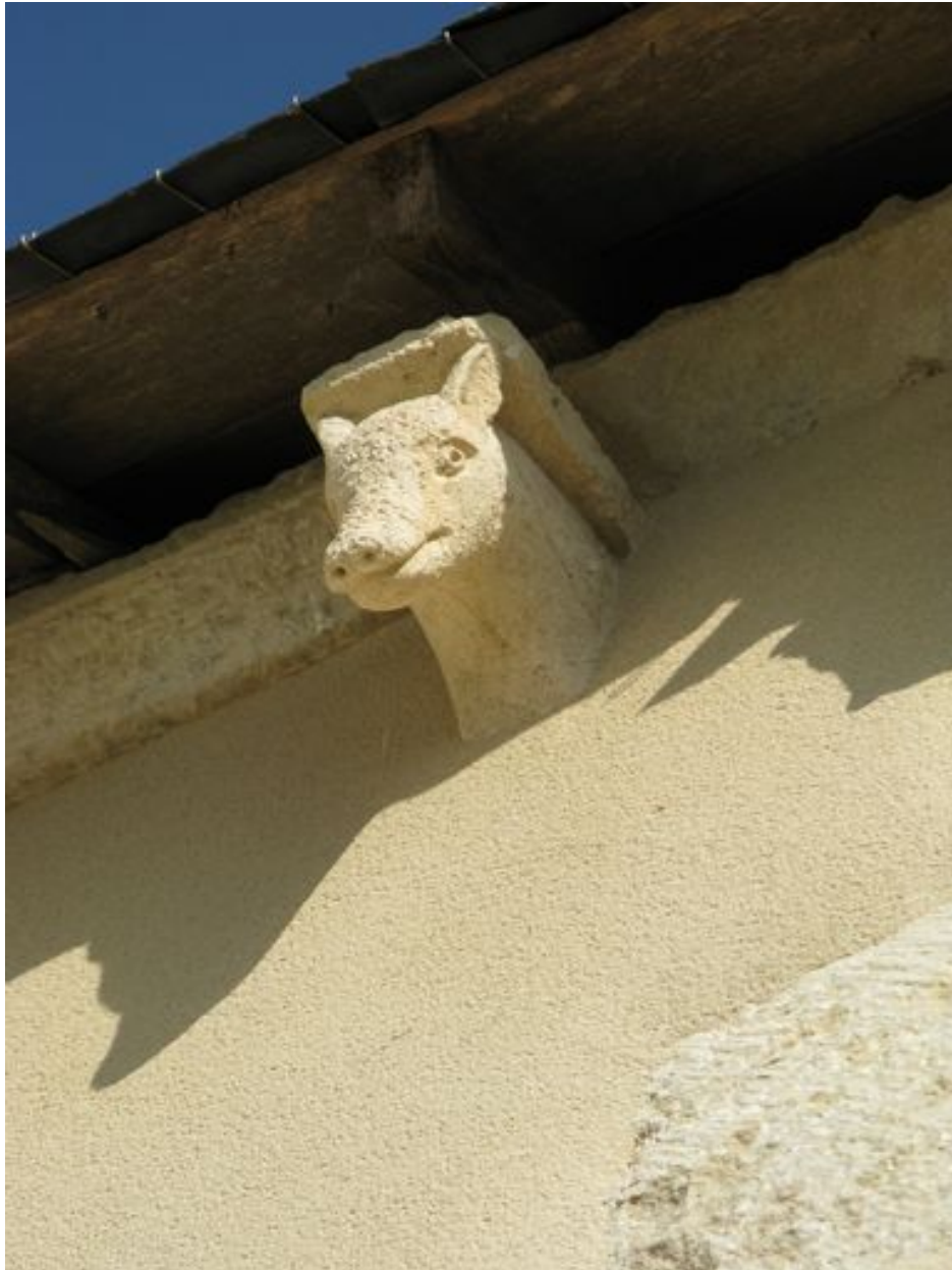
Élévation sud, travée droite du choeur, quatrième modillon, tête animale.