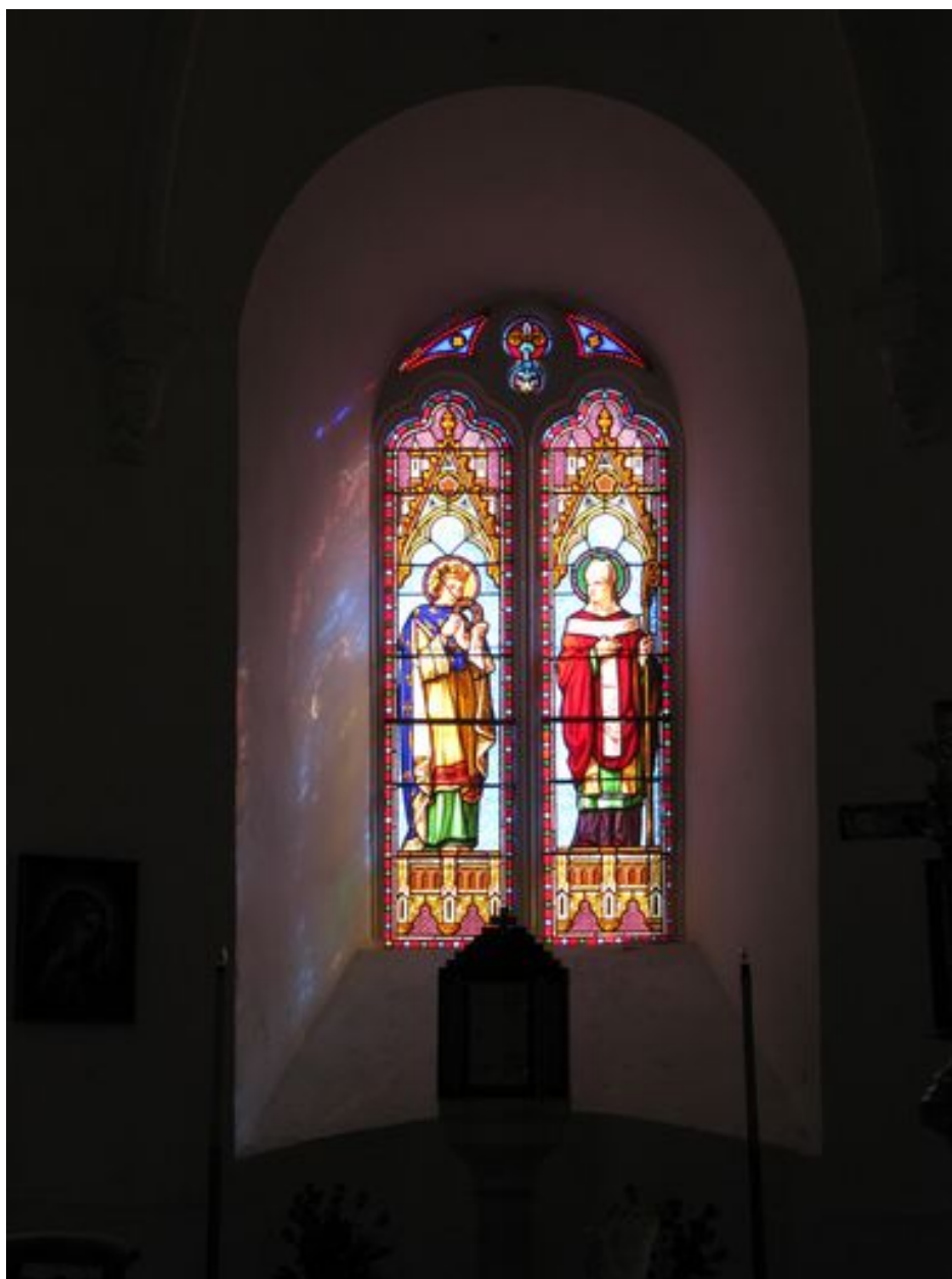
Abside, baie d'axe, verrière : saint Louis.