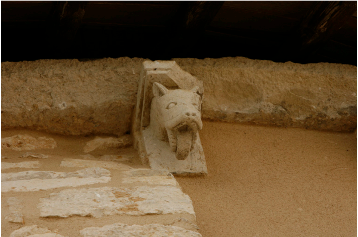
Abside, élévation sud-est, quatrième modillon : tête de chien, vu de trois-quarts.