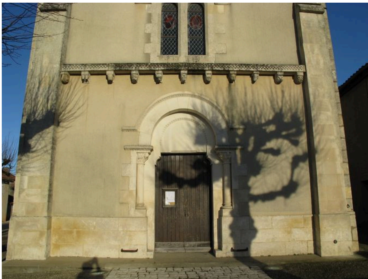
Façade, détail du portail et de la corniche à modillons du 19e siècle.