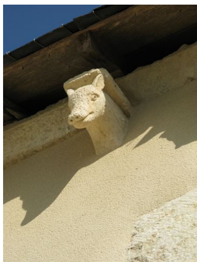
Élévation sud, travée droite du choeur, quatrième modillon, tête animale.