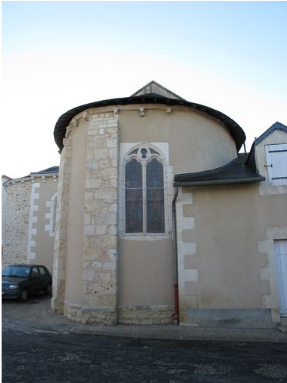
Chevet, vu de l'est.