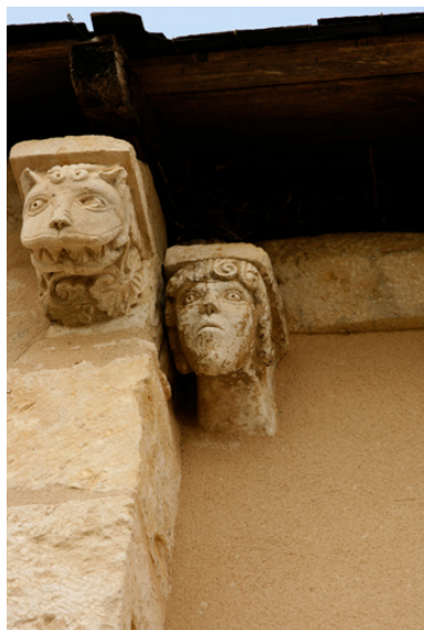
Abside, élévation sud, modillons : dernier modillon de la travée droite (tête de lion) et premier modillon de l'abside (tête humaine).