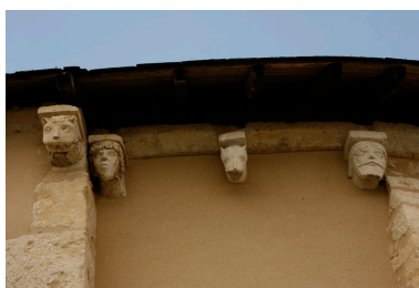
Abside, élévation sud, modillons : dernier modillon de la travée droite et modillons de l'abside. IVR54_20098600069NUCA