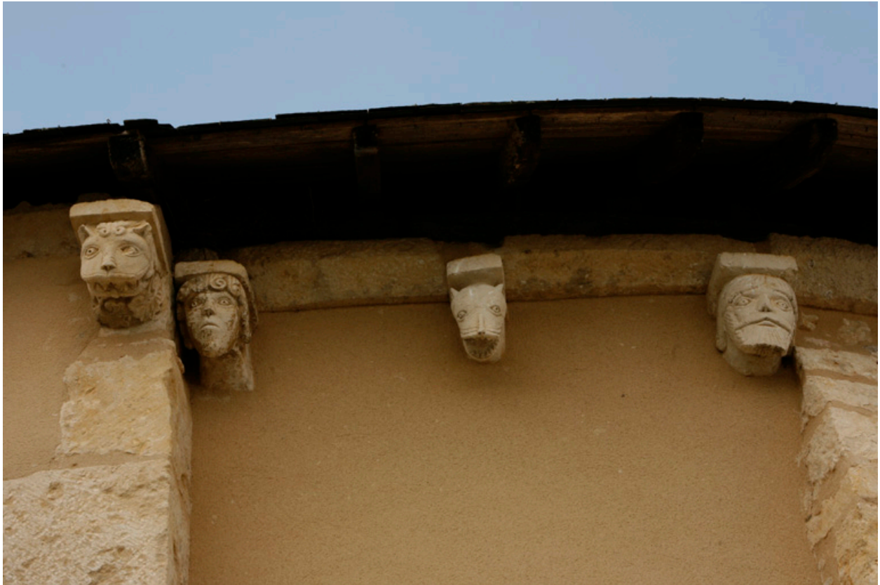
Abside, élévation sud, modillons : dernier modillon de la travée droite et modillons de l'abside.