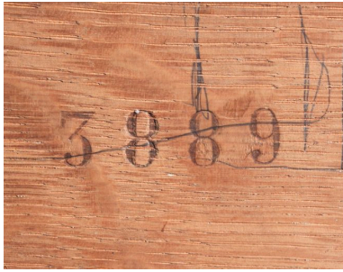
Numéro de série sous le clavier. IVR72_20124000204NUC2A