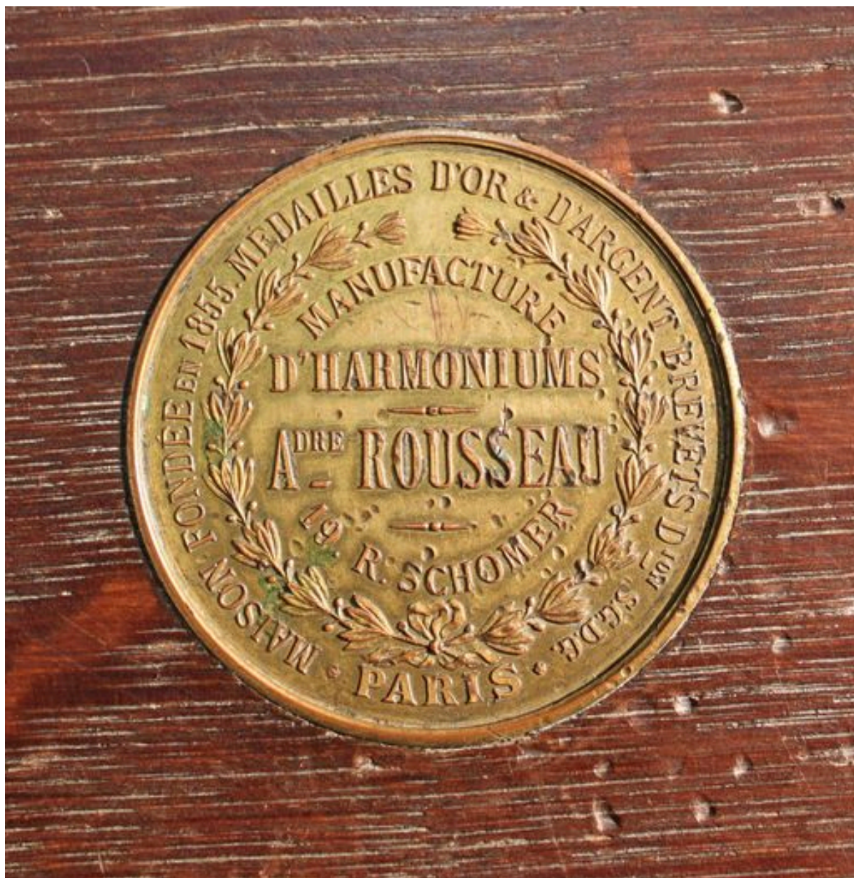
Marque du fabricant.