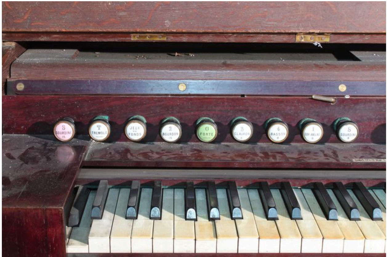
Partie gauche du clavier.