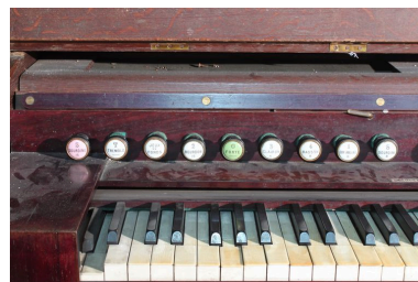
Partie gauche du clavier.

IVR72_20124000205NUC2A