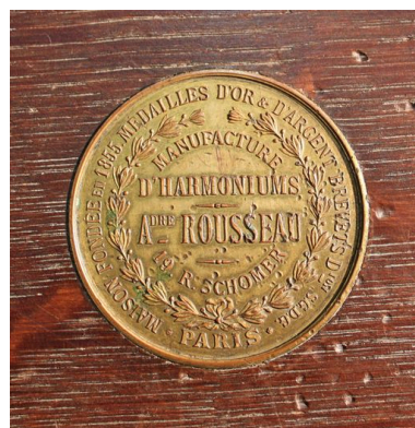
Marque du fabricant.

IVR72_20124000201NUC2A