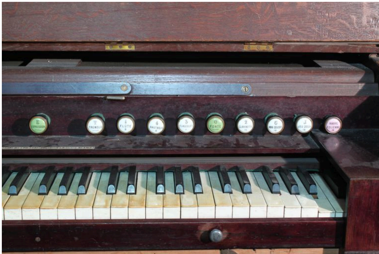
Partie droite du clavier.