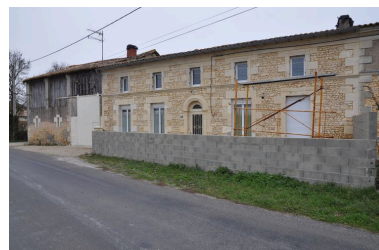
Façade principale. IVR72_20113300059NUCA