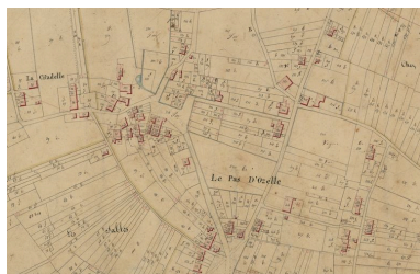
Extrait du plan cadastral de 1828.