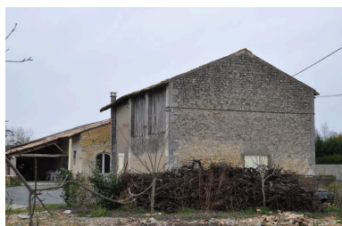
Vue d'ensemble depuis le l'ouest.