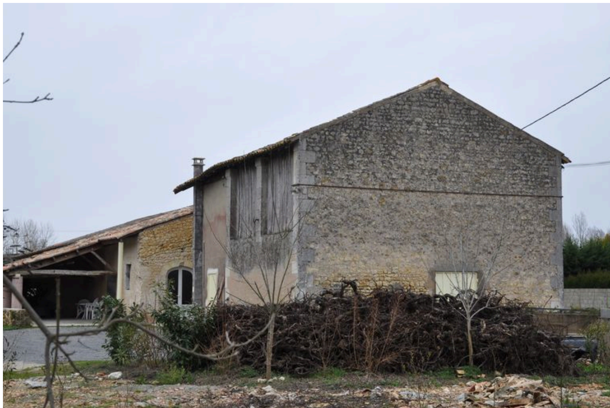
Vue d'ensemble depuis le l'ouest.