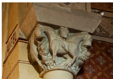
Chapiteau nord. IVR72_20144090274NUC2A