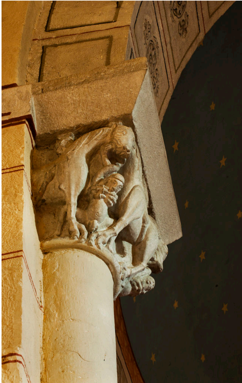
Chapiteau nord (vu du côté gauche).