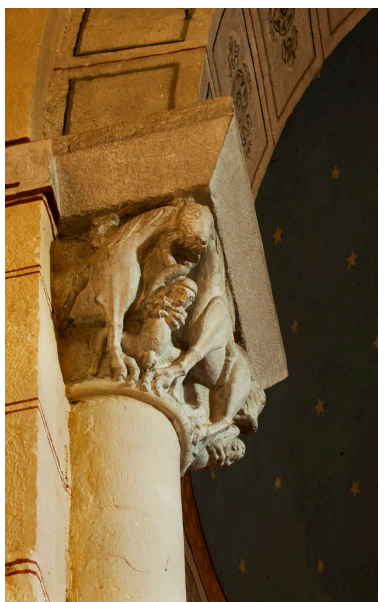
Chapiteau nord (vu du côté gauche). IVR72_20144090275NUC2A