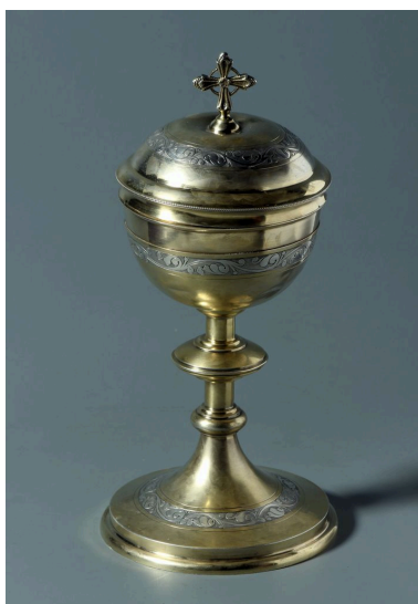
Ensemble. IVR72_20206401836NUC2A