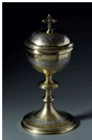
Ensemble. IVR72_20206401837NUC2A