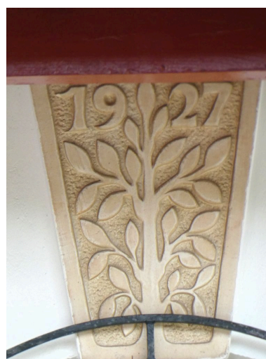
Détail du faux claveau sculpté d'un arbre. IVR72_20206401636NUC2A