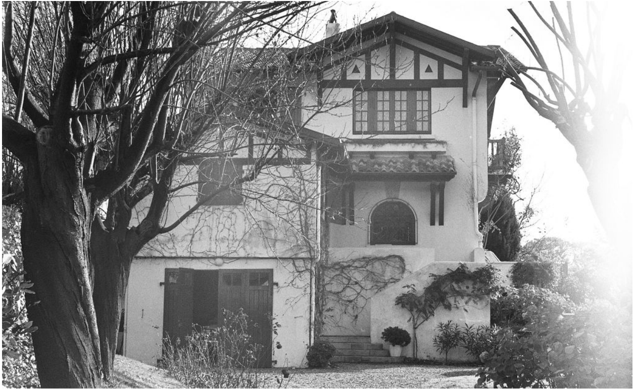
Ensemble depuis l'ouest, vers 1994.