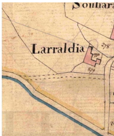
"Larraldia", plan cadastral de 1831, Section B, feuille 2.

IVR72_20206401637NUC1A