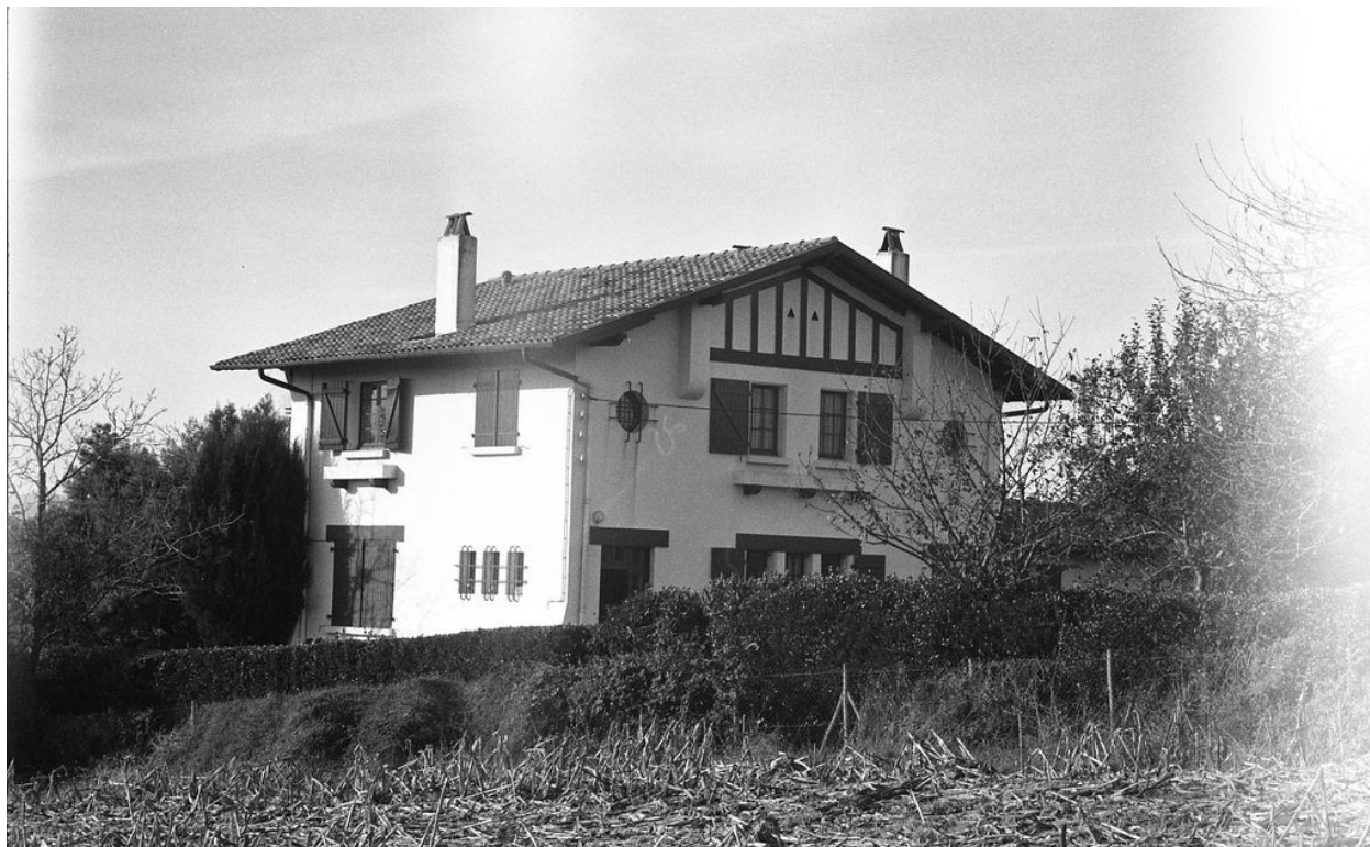
Ensemble depuis le nord-est vers 1994.