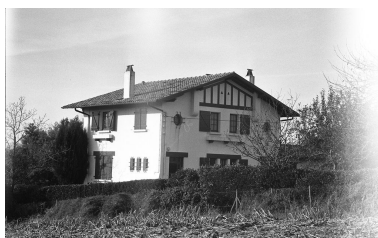
Ensemble depuis le nord-est vers 1994.