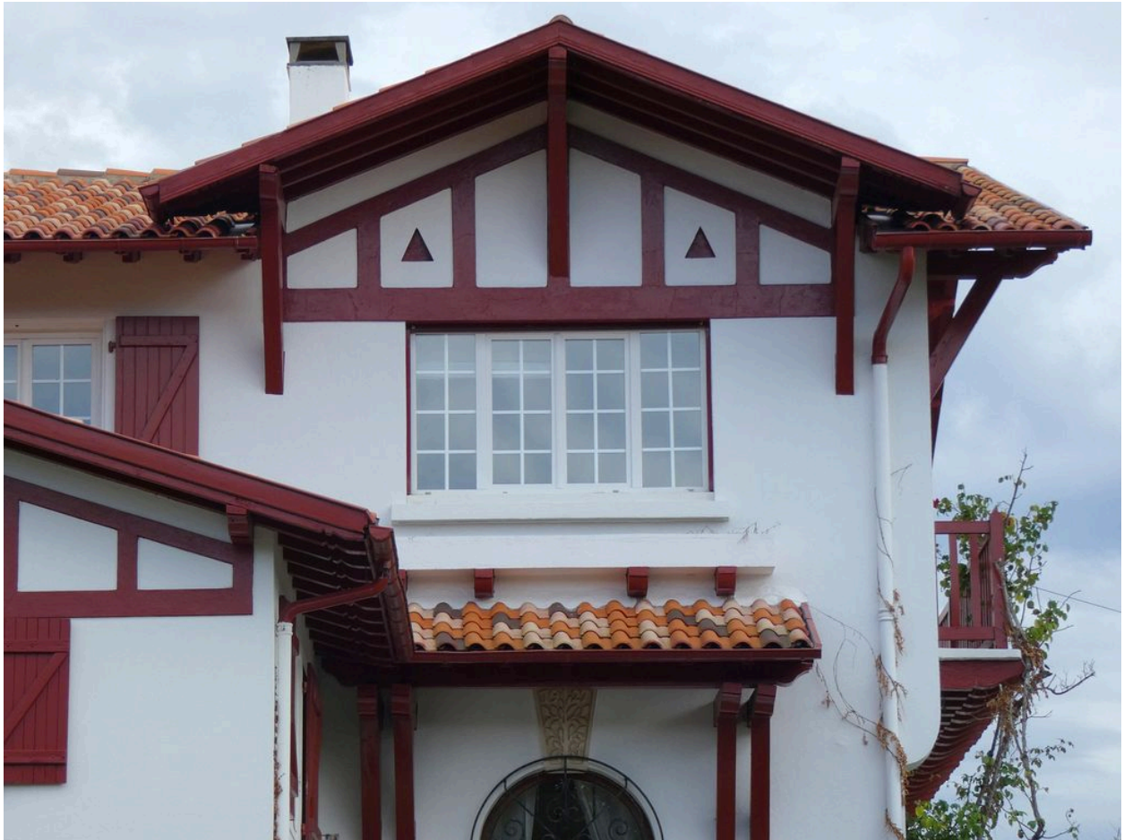
Détail de la façade ouest.