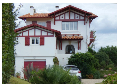
Vue d'ensemble depuis le nord. IVR72_20206401634NUC2A