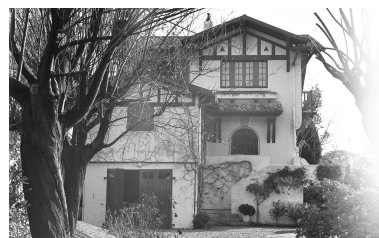
Ensemble depuis l'ouest, vers 1994.