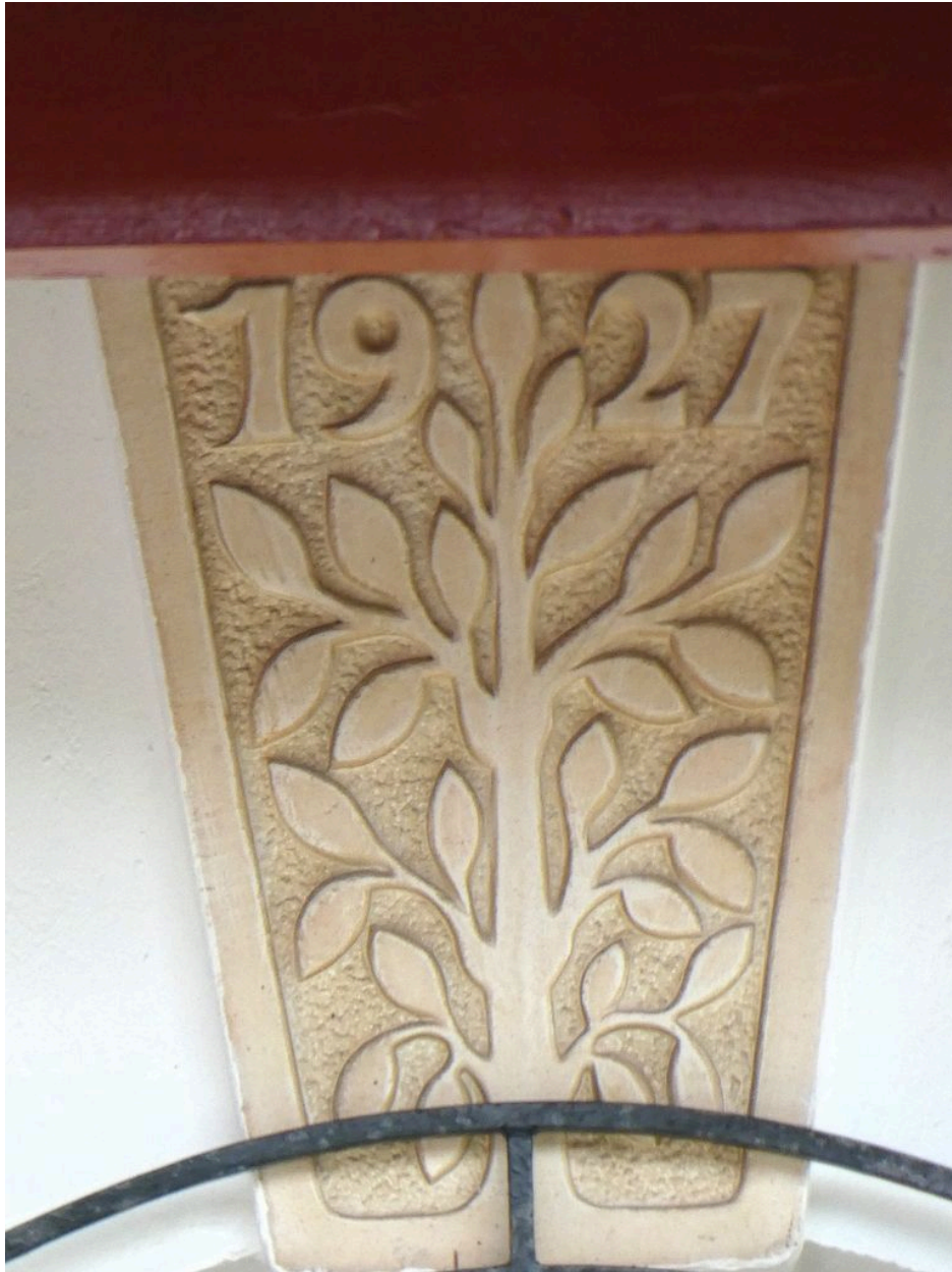
Détail du faux claveau sculpté d'un arbre.