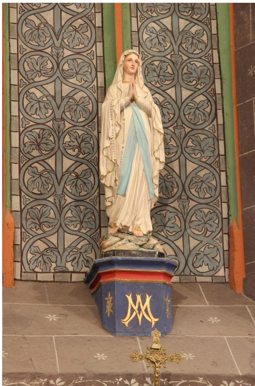
Statue de Notre-Dame de Lourdes.