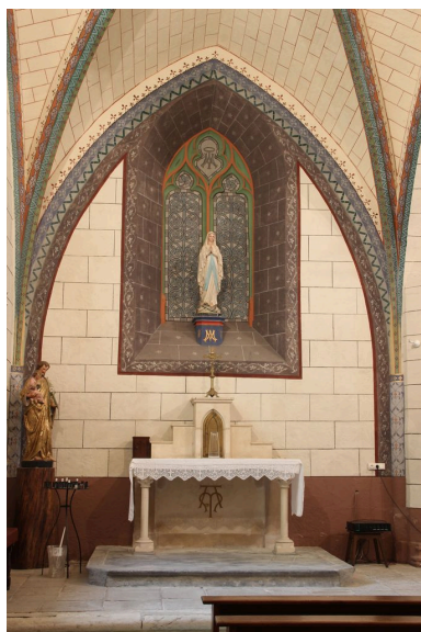
Ensemble avec la fenêtre murée. IVR72_20144001624NUC2A