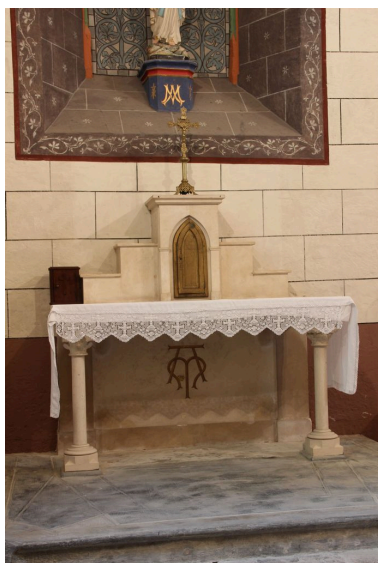
Autel. IVR72_20144001635NUC2A