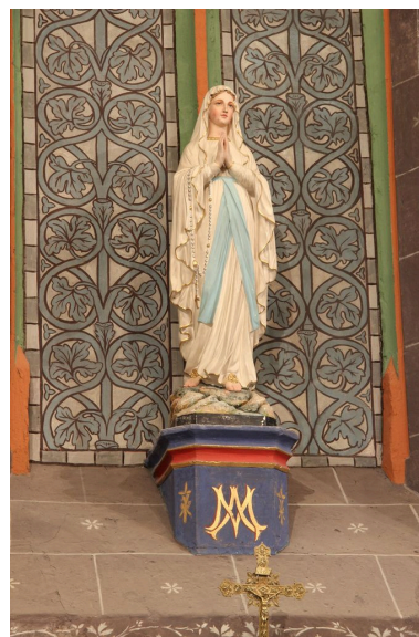
Statue de Notre-Dame de Lourdes. IVR72_20144001636NUC2A