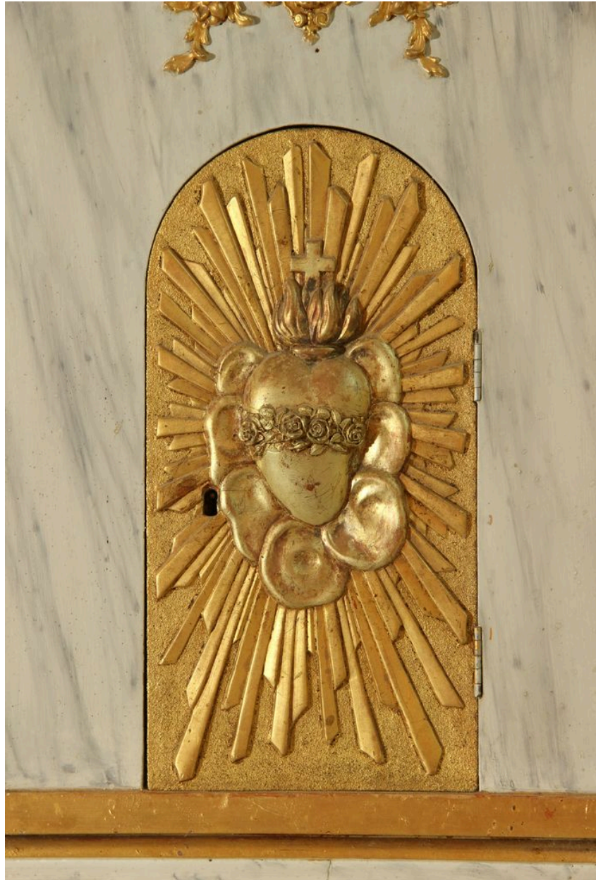
Détail du tabernacle : porte.