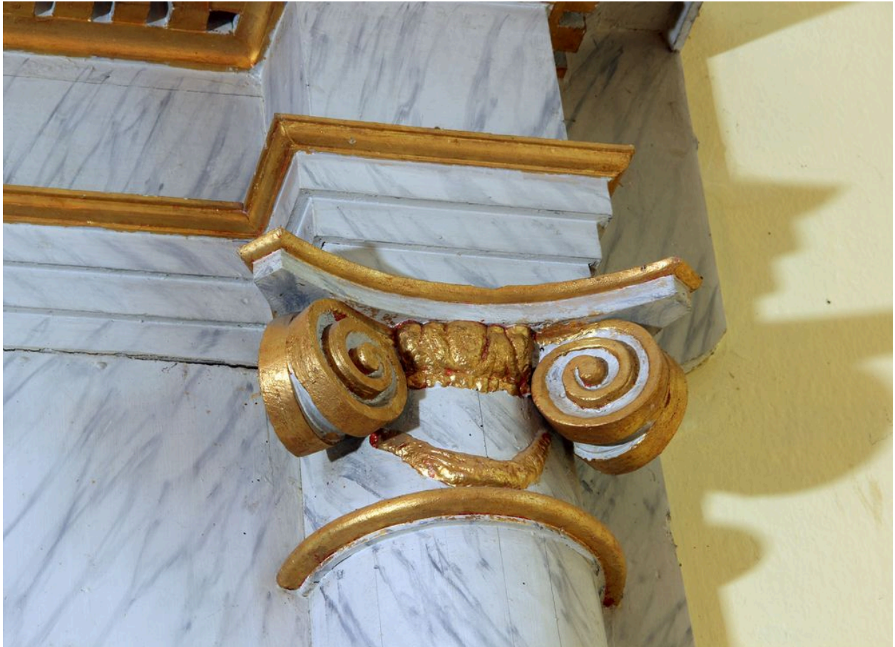
Détail du retable : chapiteau ionique de la demi-colonne de droite.