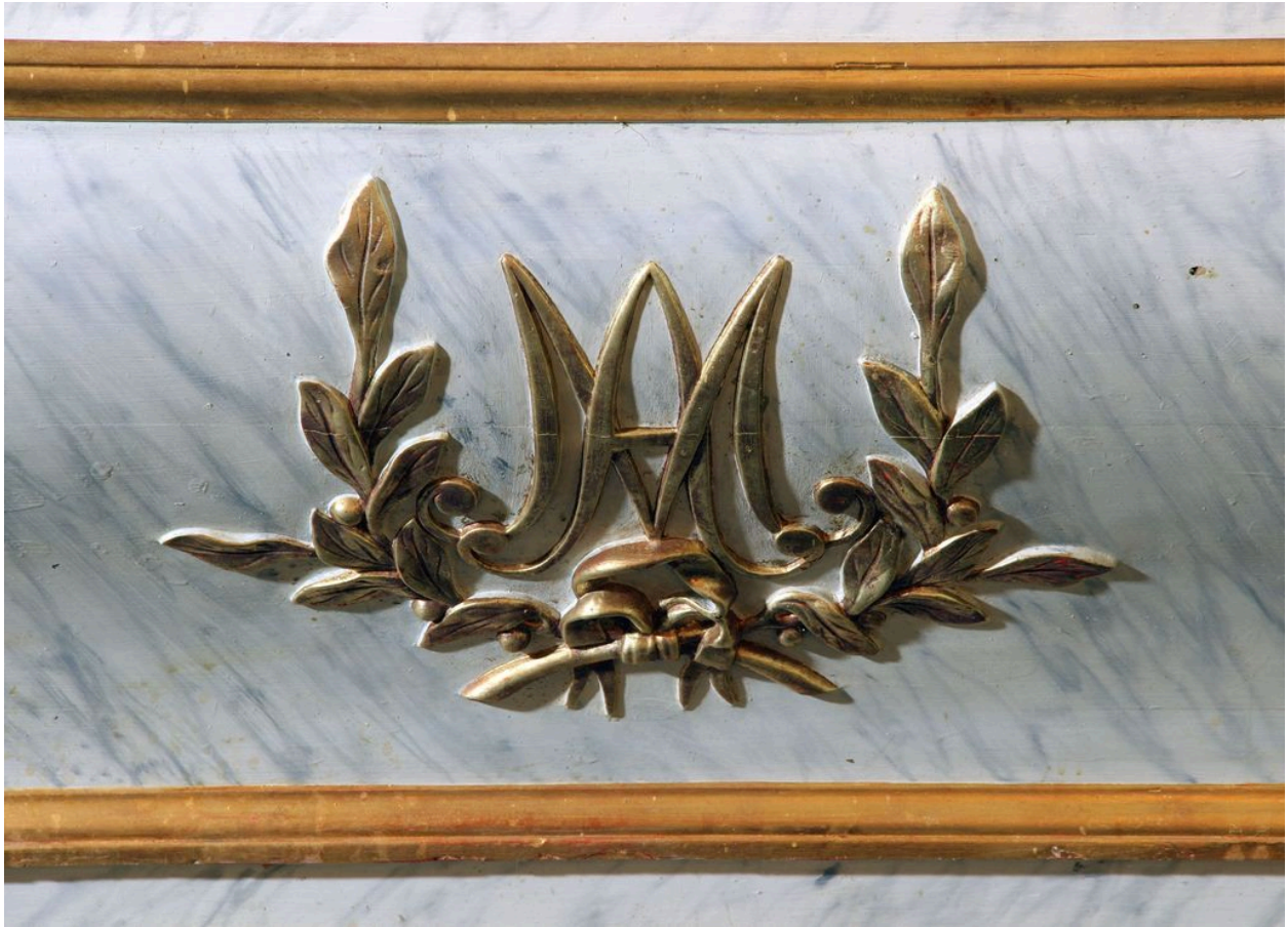
Détail du tombeau d'autel : monogramme MA.