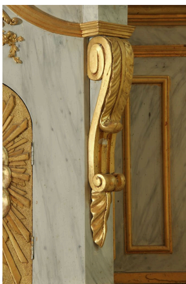
Détail du tabernacle : console. IVR72_20204001465NUC2A