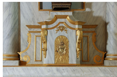
Tabernacle.