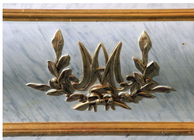
Détail du tombeau d'autel : monogramme MA. IVR72_20204001462NUC2A

IVR72_20204001461NUC2A