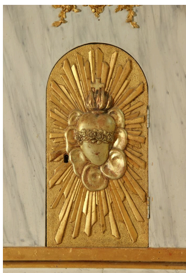
Détail du tabernacle : porte.