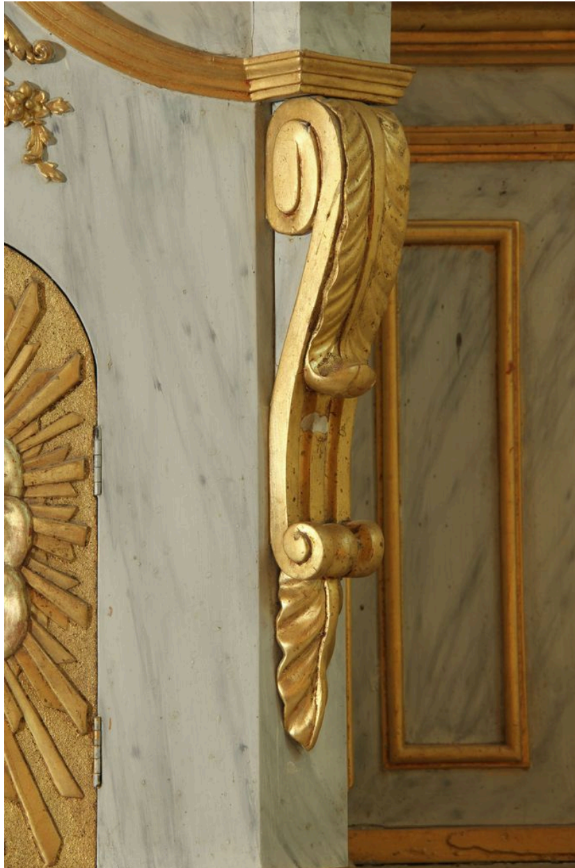
Détail du tabernacle : console.