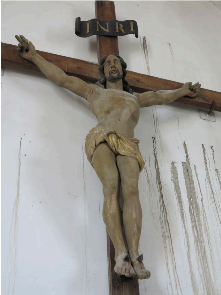
Détail : statue du Christ.