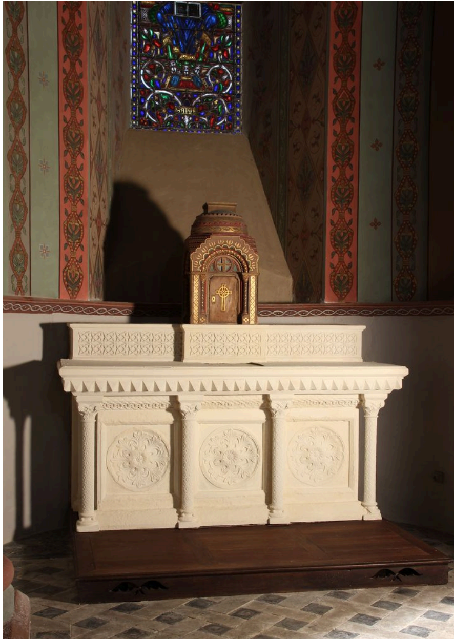
Autel de sainte Anne.