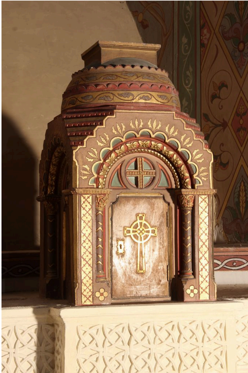
Autel de sainte Anne : détail du tabernacle.