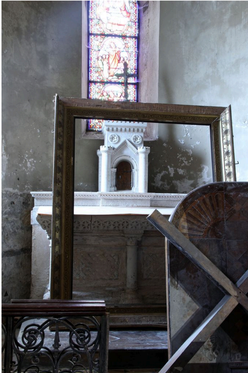
Autel de saint Vincent de Paul.