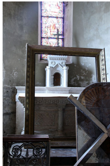
Autel de saint Vincent de Paul.