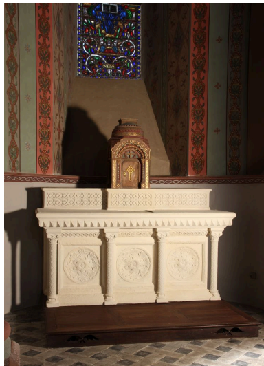
Autel de sainte Anne.