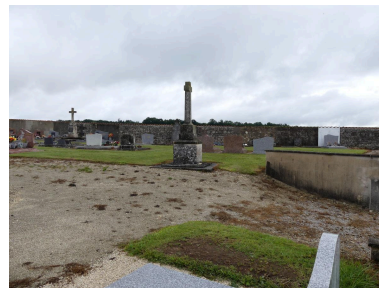
Vue générale prise depuis le sud-est.