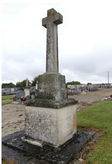
Croix de cimetière, prise de vue depuis le nord-est.