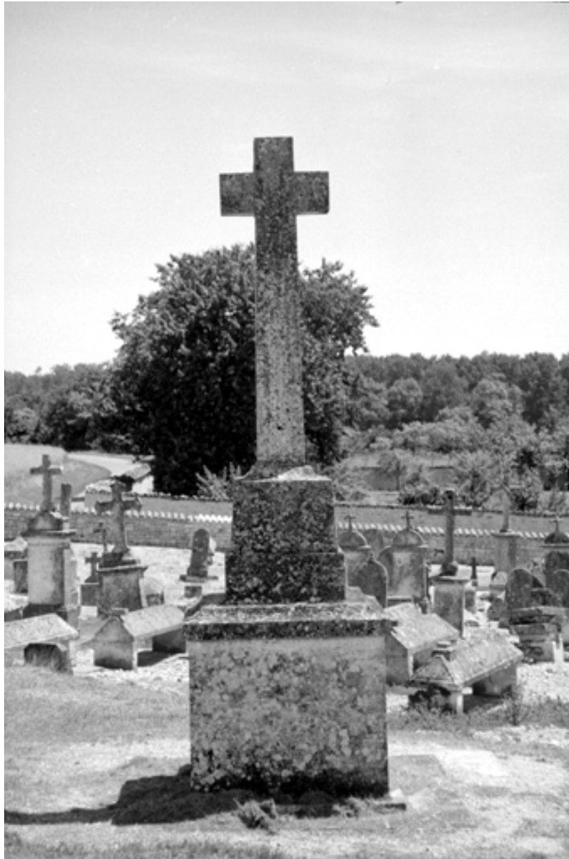
Croix de cimetière, prise de vue depuis l'ouest.