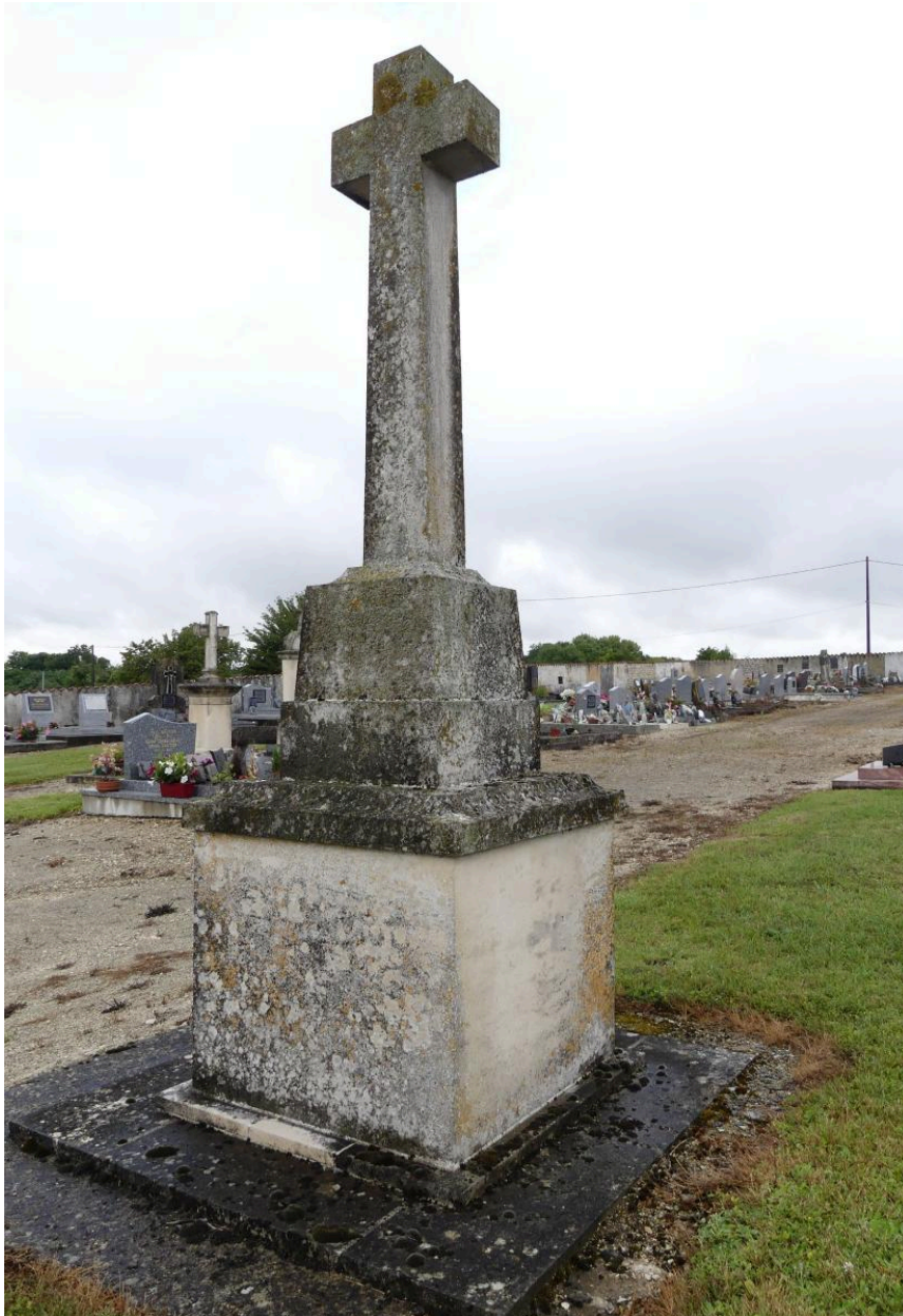
Croix de cimetière, prise de vue depuis le nord-est.