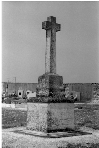
Croix de cimetière, prise de vue depuis le sud-est. IVR54_19941701564Z