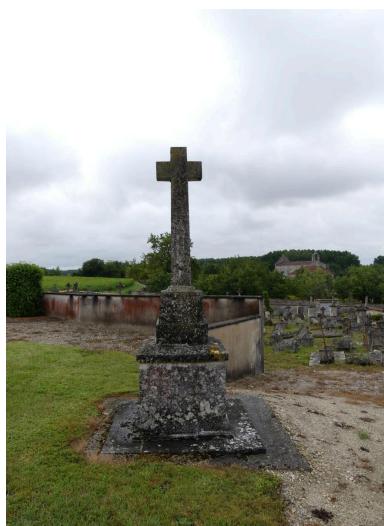
Croix de cimetière, prise de vue depuis l'ouest.