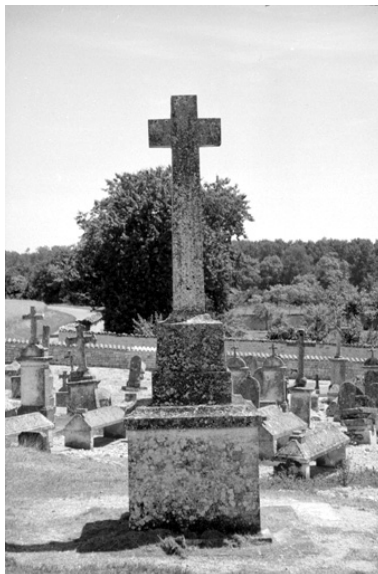
Croix de cimetière, prise de vue depuis l'ouest. IVR54_20001704691Z