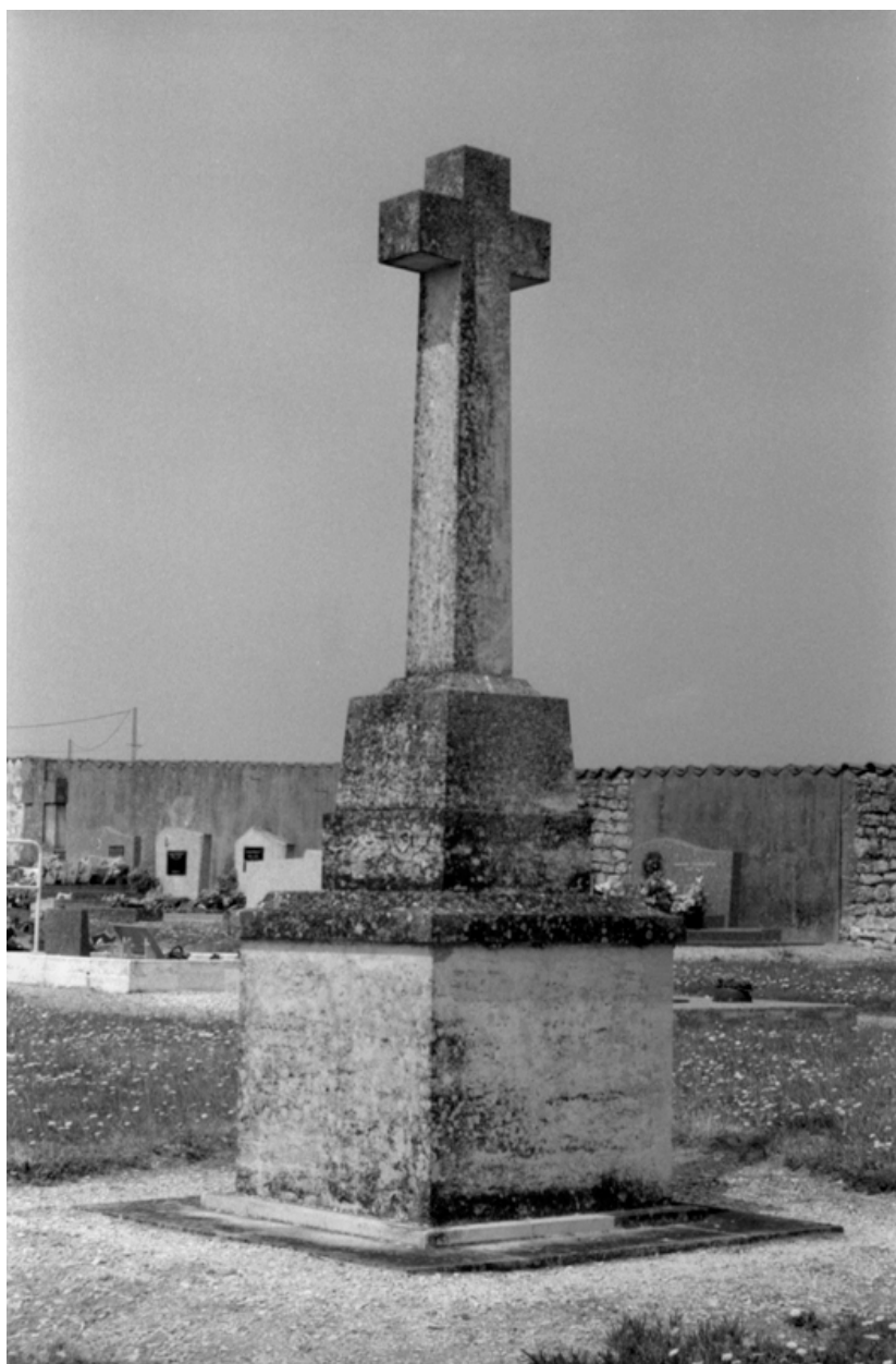
Croix de cimetière, prise de vue depuis le sud-est.