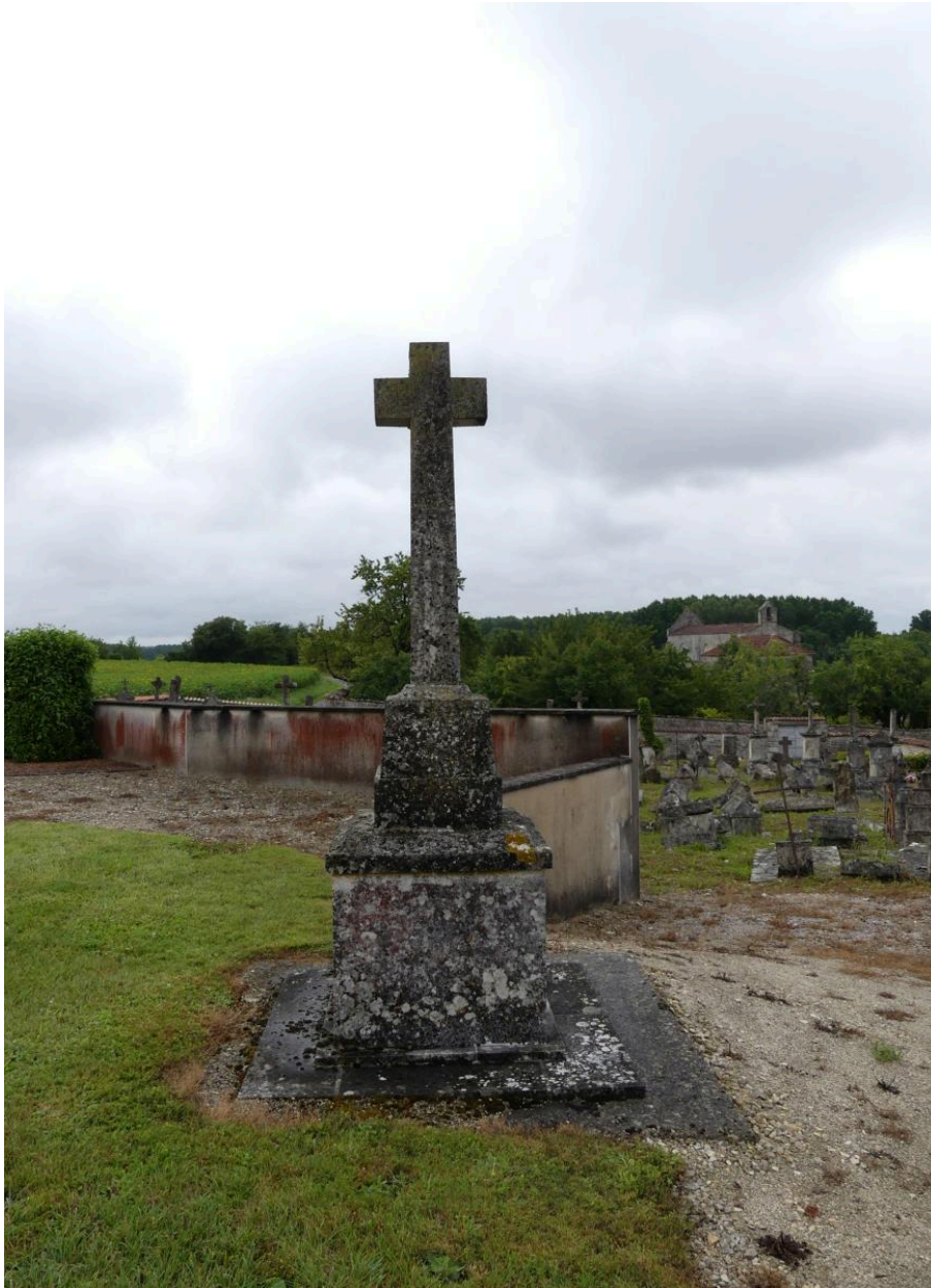
Croix de cimetière, prise de vue depuis l'ouest.