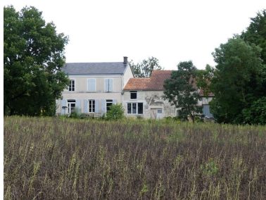
Façade orientée au sud.