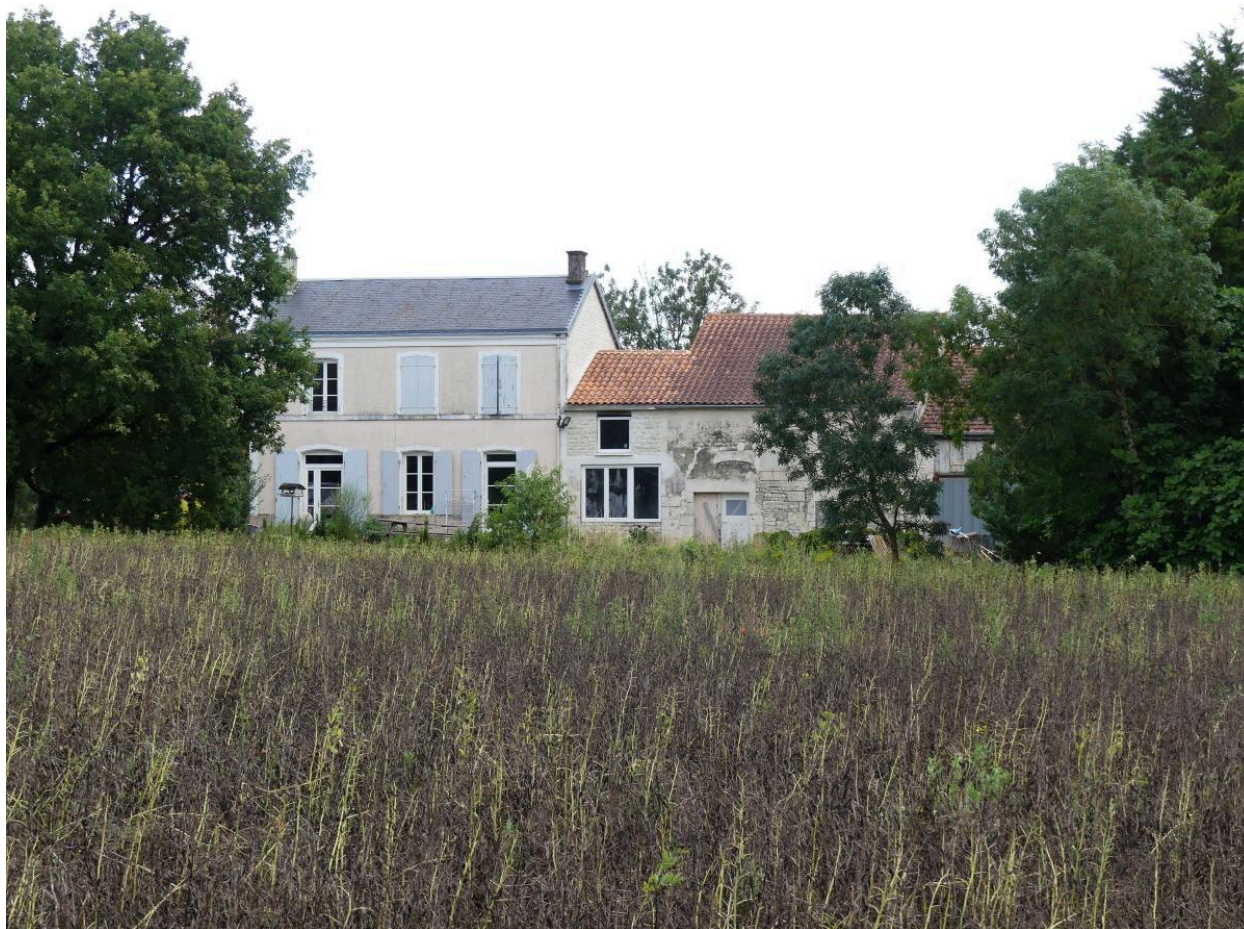
Façade orientée au sud.