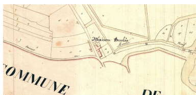
Détail du plan cadastral napoléonien de Saint-Séverin-sur-Boutonne, section C2, 1839.

Repro. Océane Charruyer IVR75_20211705811NUCA