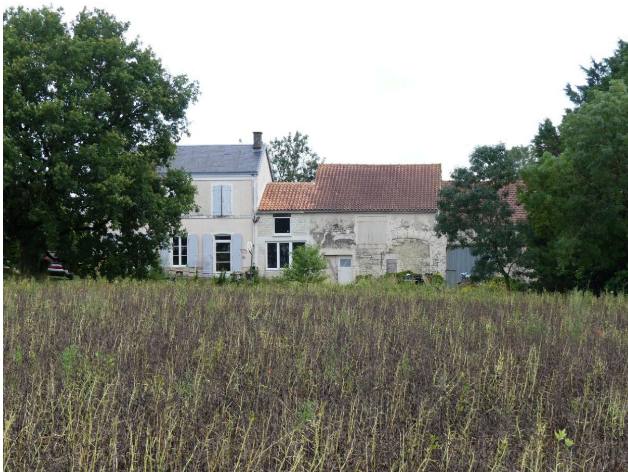
Façade orientée au sud.