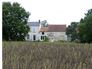
Façade orientée au sud. IVR75_20211705792NUCA